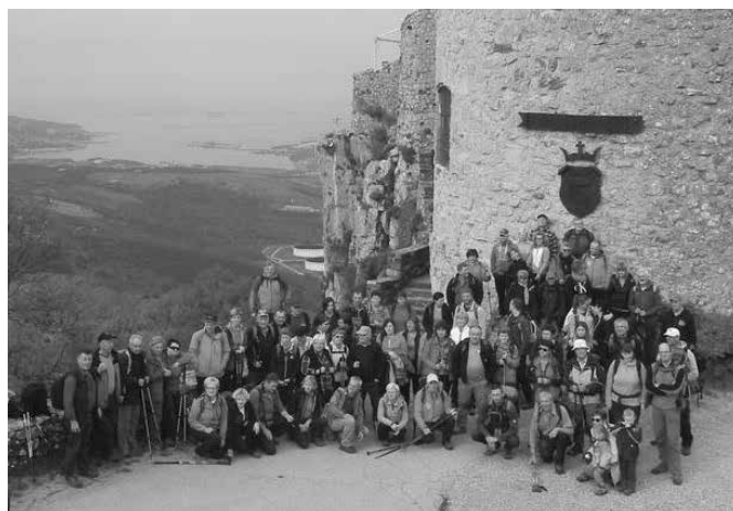
Skupinski posnetek pri gradu Socerb