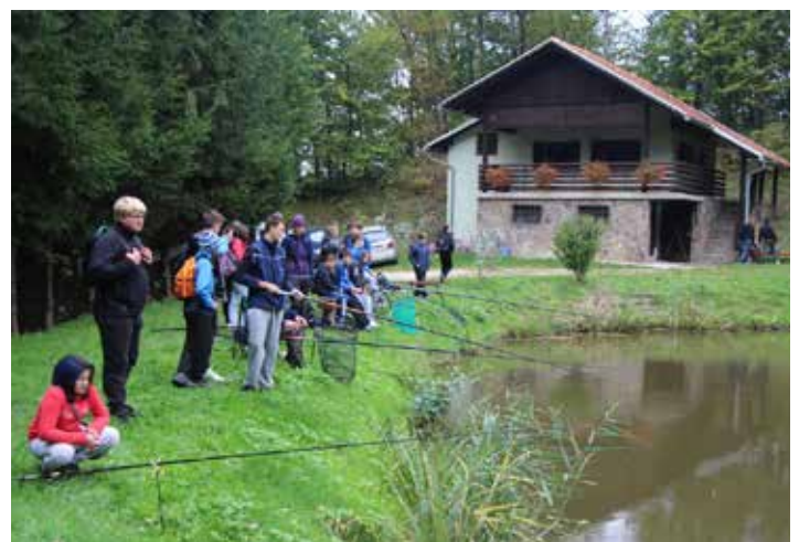
Ribarjenje ob projektu Voda, vir življenja