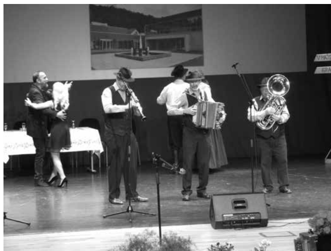
Veseli prijatelji