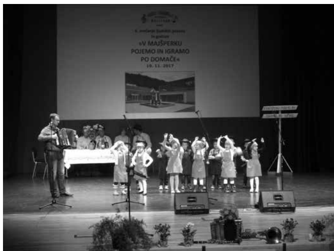
Nastop vrteške skupine Metulji