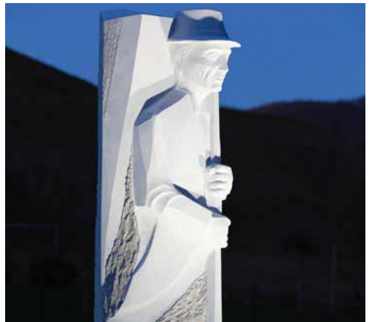
Skulptura »Stope« ponoči