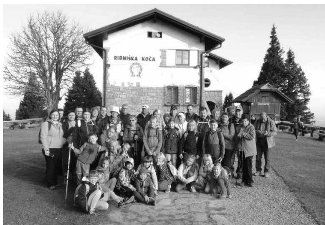
Skupina otrok in staršev pri Ribniški koči