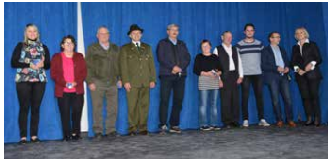
Predstavniki društev so prejeli ključce doma krajanov