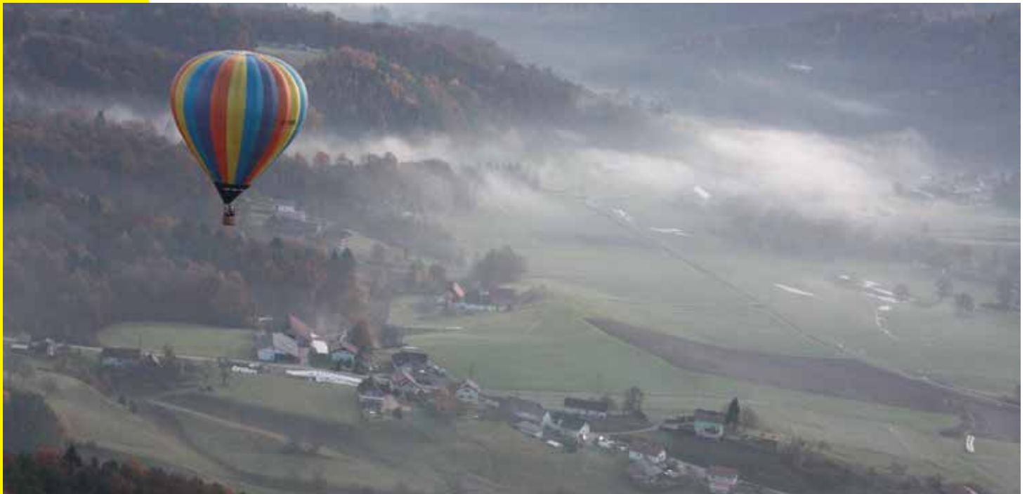
Pogled na naše kraje iz balona