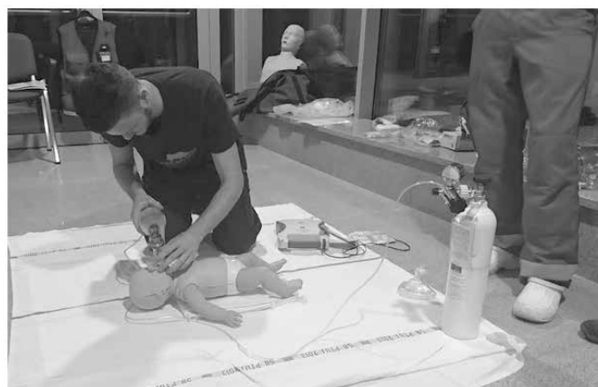
Praktično preverjanje uporabe AED in temeljnih postopkov oživljanja