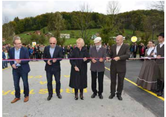
Slovesno odprtje doma krajanov