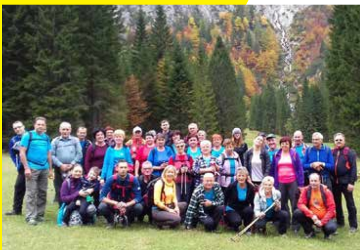
V Tamarju s pogledom na izvir Nadiže