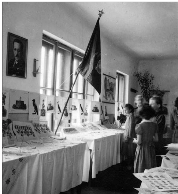
Za zaključek šolskega leta 1951/52 je šola pripravila razstavo šolskih del in igro ter plesne točke. To je bila prva šolska razstava na Igu. Čisti dobiček igre so porabili za nakup knjig za šolsko knjižnico 32 (SI ZAL LJU 460, Osnovna šola Igu).

terial za obnovo četrte učilnice, zasteklili vsa zunanja in notranja okna ter prebelili okna in vrata. 33 A obnova četrte učilnice je mirovala tudi v naslednjem šolskem letu, saj niso dobili za to potrebnega posojila. 34 Šele v šolskem letu 1949/50 so zapisali, da so »s trdom« obnovili okna, tla in strop velike učilnice, za plačilo stroškov pa je šolska uprava priredila veselico, s katero je zbrala 42.266 dinarjev. 35