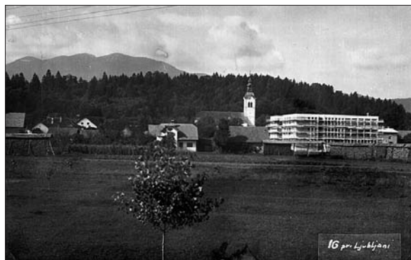
Razglednica Iga pri Ljubljani, na kateri je vidna osnovna šola v gradnji.

Tudi v naslednjih šolskih letih je pouk zaradi naraščajočega števila učencev potekal v treh izmenah. Prva polovica oddelkov od petega do osmega razreda je imela pouk od 7.00 do 10.30, druga od 10.30 do 14.00, razredi od prvega do četrtega pa so imeli pouk od 14.00 do 17.30. Zapisali so, da odmorov skoraj ni bilo, le med menjavami je bilo pet minut odmora, zaradi česar učilnic niso mogli prezračevati. 86 V poročilu Zavodu za prosvetno pedagoško službo Vič iz leta 1962 so na osnovni šoli Ljubo Šercer Iga izpostavili tudi to, da so bile učilnice vlažne, temne in neprimerne za sodobni pouk. 87 V šolski kroniki se v šolskem letu 1962/63 pojavi zanimiva novica. Zapisali so, da naj bi časopisno podjetje Borba iz Beograda namenilo sredstva za montažno šolo, a se je načrt izjalovil, vzroka za to pa niso navedli. 88 Iz občinskih zapisnikov je razvidno, da je podjetje ponudilo finančna sredstva za štiri učilnice, želeli pa so, da občina popularizira njihovo prilogo Kekec in zanjo pridobi 2.000 novih naročnikov, uredi temelje in zunanost šole ter prispeva 40 milijonov dinarjev za preostale štiri učilnice. Po mnenju nekaterih občinskih odbornikov naj bi šlo za skupno akcijo Borbe in drugih podjetij, s katero so želeli na jugoslovansko tržišče uvesti montažne objekte, narejene po švedski licenci. Kljub temu da je bila večina odbornikov načeloma naklonjena Borbini ponudbi, saj je bilo novo šolsko poslopje na Igu res potrebno, do realizacije ni prišlo. 89