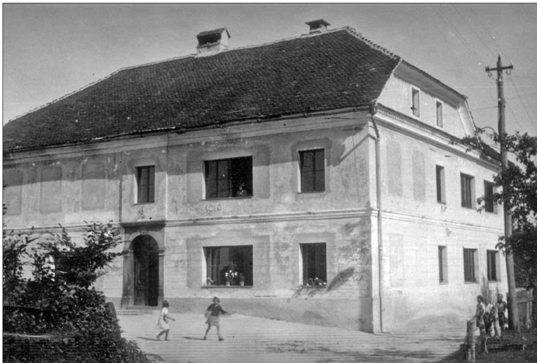
Osnovna šola z delno zazidanimi okni. Čas nastanka fotografije ni znan, verjetno je nastala v štiridesetih letih 20. stoletja, saj lahko v šolski kroniki preberemo, da so vsa okna zasteklili ob koncu omenjenega desetletja (SI ZAL LJU 460, Osnovna šola Igu).

ru skrajno nedostatno«. Predvidevali so, da bo zaradi naraščajočega števila otrok kmalu začelo primanjkovati učilnic. 5 Leta 1939 so bile v šoli štiri učilnice, oddelkov pa osem. Iz zapisnika vidimo, da so bile vse učilnice dopoldne in popoldne polno zasedene. A na obnovo ali novo gradnjo v bližnji prihodnosti niso upali. Kot so zapisali, je bil velik del občinskega proračuna porabljen za elektrifikacijo Iga. 6 Tega leta so tudi v šolskem poslopju na Igu namestili prvo električno napeljavo. 7