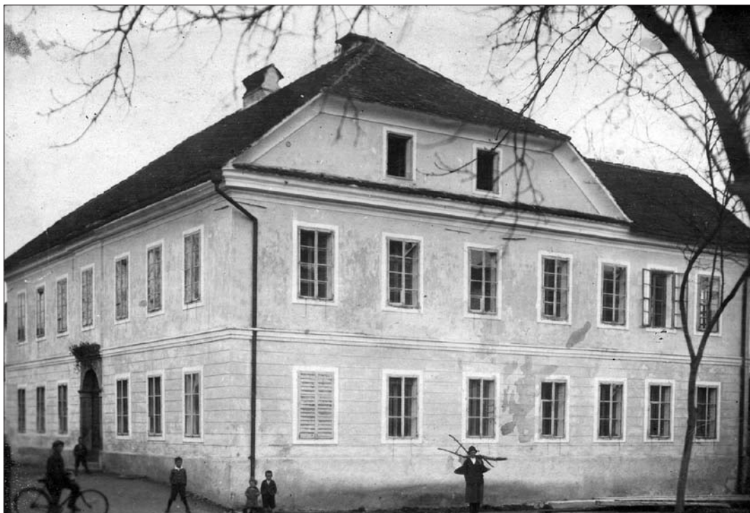
Osnovna šola Ig pred drugo svetovno vojno (SI ZAL LJU 460, Osnovna šola Ig).

V socialistični Jugoslaviji za šolstvo zaradi slabih gospodarskih razmer na začetku ni bilo namenjenih veliko sredstev, čeprav so v njem videli temelj za vzgojo v duhu novih družbenopolitičnih razmer. Po koncu druge svetovne vojne je bilo treba najprej obnoviti domovino, vzpostaviti novo družbeno ureditev in razviti gospodarstvo. Ko se je začel življenjski standard počasi dvigovati in je število prebivalcev naraščalo, so se začele večati njihove potrebe, kar se je pokazalo tudi v primeru premajhnih in slabo opremljenih šol. Še posebno na podeželju so bile te težave izrazite, saj je bila nova infrastruktura zaradi pomanjkanja finančnih sredstev težko dosegljiva. Na spremembo potreb je vplivala tudi reorganizacija šolske mreže, ki jo je prinesla šolska reforma konec petdesetih let.