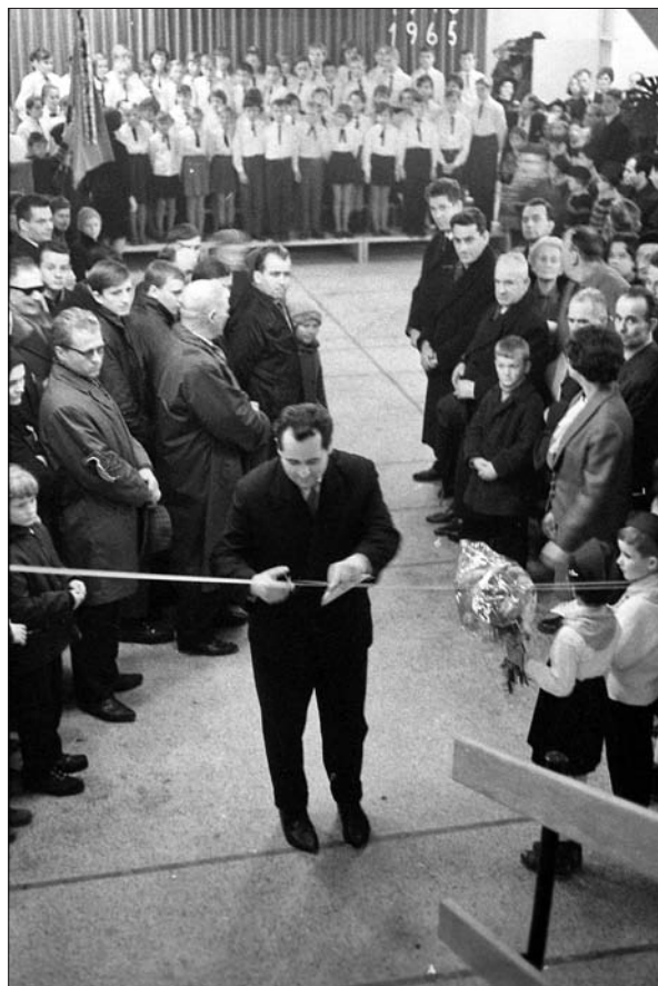
Slavnostna predaja in prerez vrvice.

in Kovinske industrije Ig naj bi bil velik, vaščani pa naj bi prispevali 250 kubičnih metrov lesa in uredili cesto. 96 S skupnimi močmi so tako dela na novi šoli počasi napredovala.