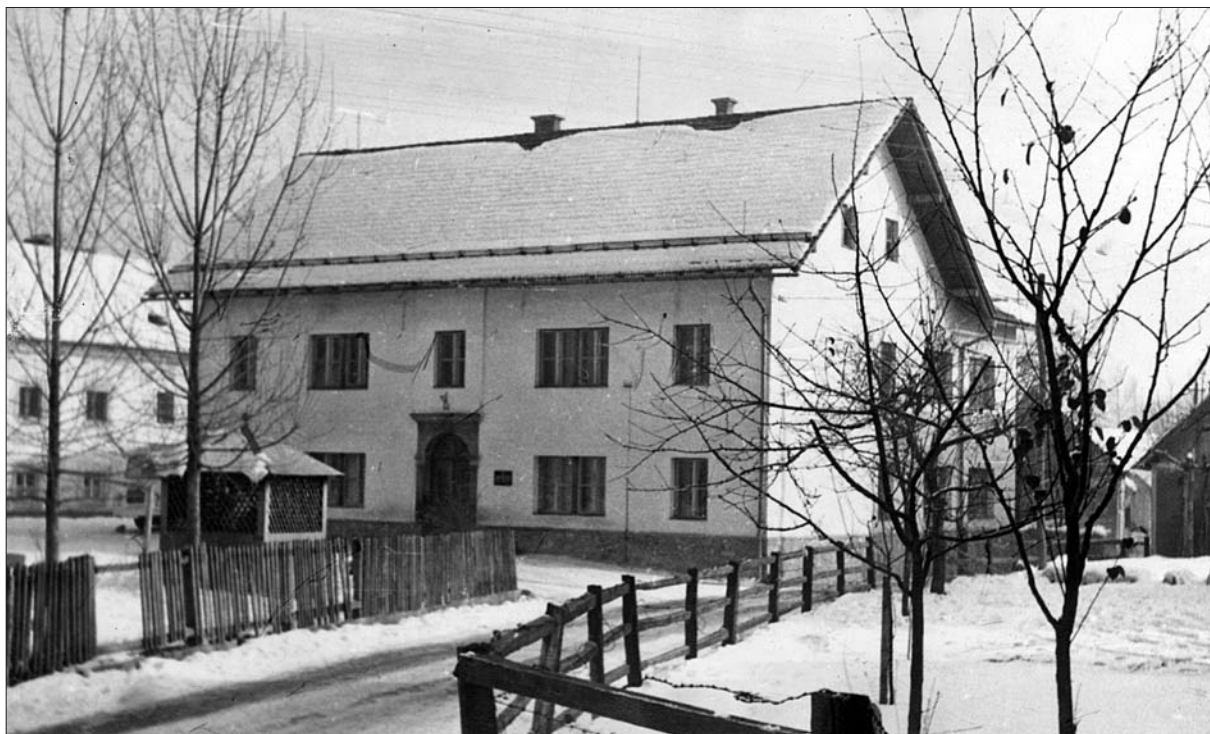
Osnovna šola Igu po končani obnovi (SI ZAL LJU 460, Osnovna šola Igu).

Ob koncu šolskega leta 1952/53, med 17. junijem in 31. julijem, so na Igu končno izvedli večja adaptacijska dela. Uredili so fasado ter prebelili okna, vrata in notranjost šole, za kar je šola plačala 700.000 dinarjev. V šolski kroniki so zapisali, da je šolsko poslopje »sedaj povsem urejeno in v okras in ponos vsej občini«. 47 V naslednjih nekaj letih se o obnovah in popravilih v šolski kroniki ni več pisalo. Oddelkov je bilo še vedno šest, število otrok pa je zmeroma raslo. 48 Do sredine petdesetih let so bila proračunska sredstva za obnovo in gradnjo šol majhna in neredna. Večinoma so bila namenjena gradnji manjših šol na podeželju. Ob pripravah na šolsko reformo se je stanje začelo počasi spreminjati. 49 Postopoma so začeli reorganizirati nižje organizirane šole, kar se je zgodilo tudi na Igu. Vrhunec je proces reorganizacije mreže šol dosegel v letih 1958 in 1959; veliko nižje organiziranih osnovnih šol je bilo pri tem ukinjenih ali preoblikovanih v podružnične šole. 50