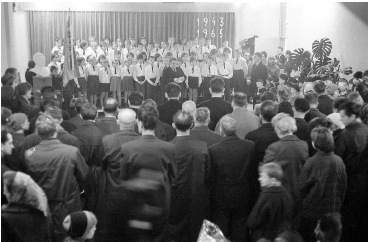
Otvoritev nove šole na Igu, 1965.