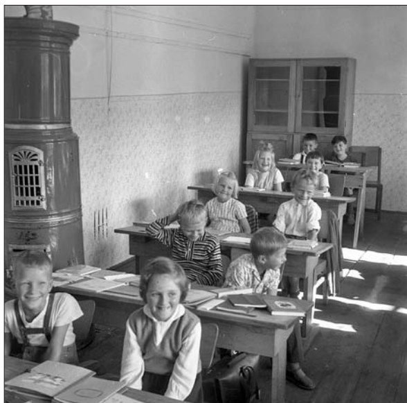
Otroci v učilnici stare šole na Igu. Fotografija je verjetno nastala v šestdesetih letih 20. stoletja.

so urediti tudi šolsko kuhinjo in rešiti stanovanjsko vprašanje učiteljev. 71 Ti načrti so se kmalu spremenili.