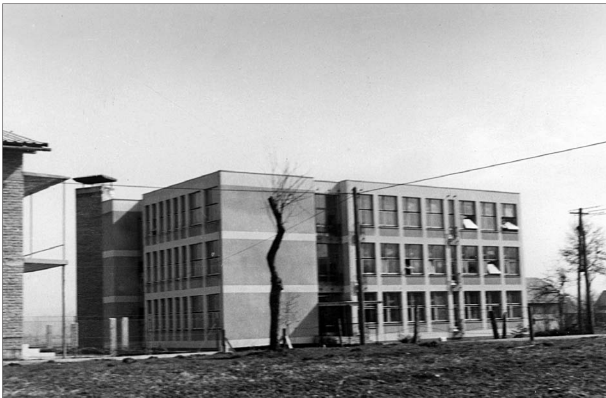
Novo šolsko poslopje na Igu (SI ZAL LJU 460, Osnovna šola Ig).