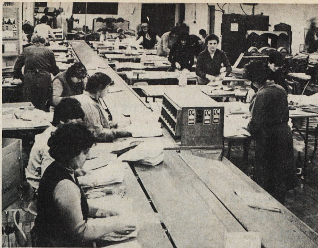
Ločna je na konferenci sindikata opozorila na osebne dohodke starejših delavk, ki jim delovni elan peša, v našem sistemu nagrajevanja pa ni vgrajenih nadomestil za to.

Ob skrbi za človeka, za povezovanje in spoznavanje Labodovih