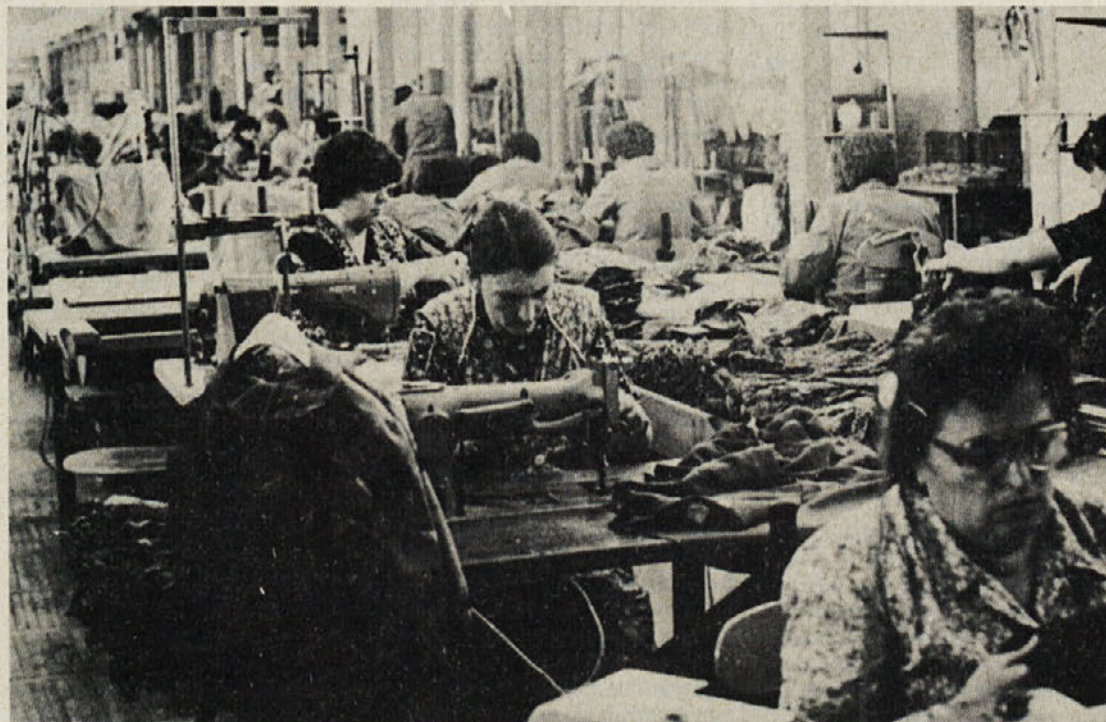
Delegacija Tip-Topa se je dotaknila vprašanja o teži in odgovornosti šivilje 1 na primer v izdelovanju srajc in bluz ter vrhnjih oblačil.