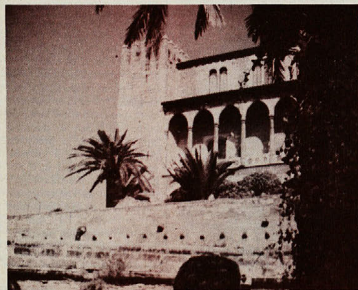
Spomin na Mallorco.

Viri trdijo, da so bili prvi naseljenci otoka Sardinici. Da je bilo na tem otoku že v pradavnini večje naselje, pričajo tudi arheološke izkopanine iz časa 3000 do 2000 let pred našim štetjem. Izkopanine pričajo, da je tako imenovana talajska kultura s tega področja pomembna, ni pa najstarejša civilizacija. Vladali pa so tam tudi Arabci in nato Rimljani ter pustili tudi svoj pečat. Bogata zgodovina in čudovite naravne danosti ter razvoj sodobnega turizma nudijo obiskovalcu zares enkratno doživetje.