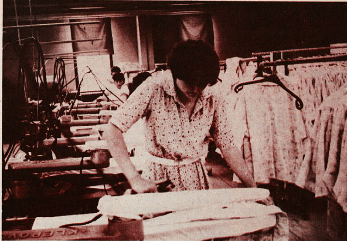
Delta je na konferenci med drugim opozorila na delovne razmere v dveh izmenah