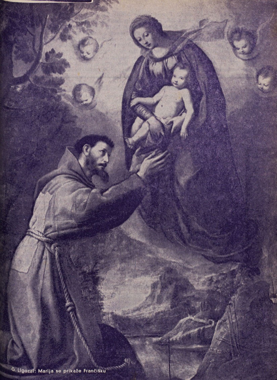
G. Ligozzi: Marija se prikazuje Francišku