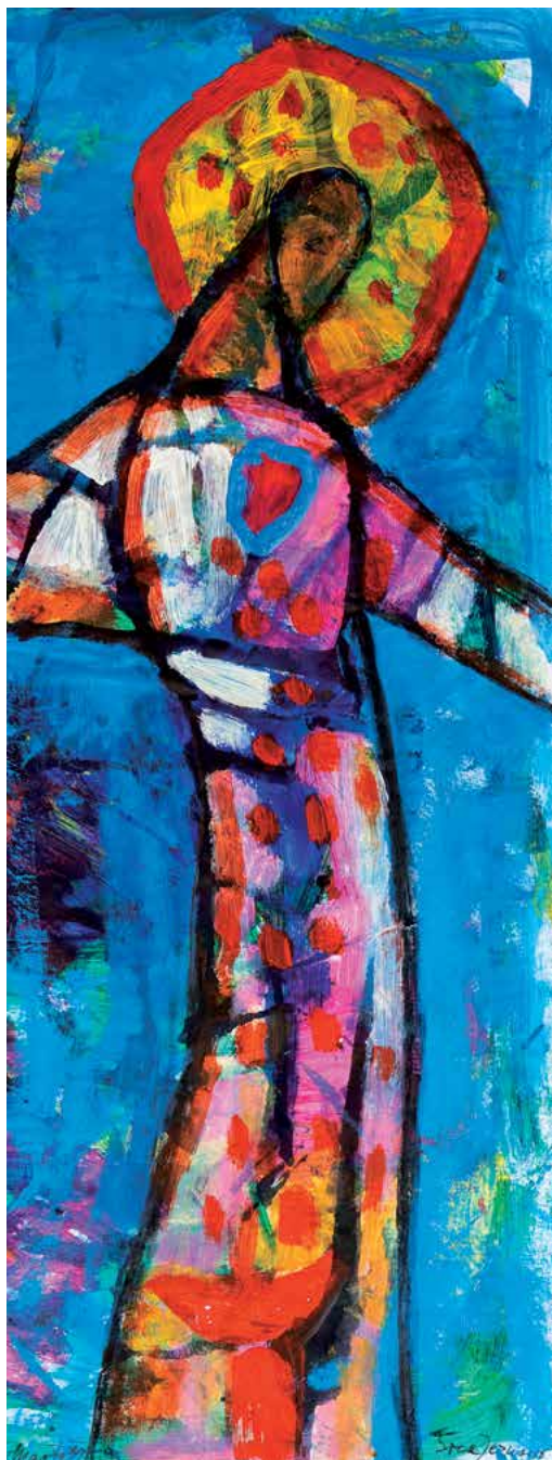
Srcce Jezusovo, 15x39cm, akril-mešana tehnika na papirju, 1999

vloge. Na to nas opozarja skopa uporaba zemeljskih barv. Razpoznavni znaki slikarkine barvne skale so postale rdeča, rumena in modra barva. Pri nekaterih motivih velja pomisliti tudi na simbolično pomenljivost barv.