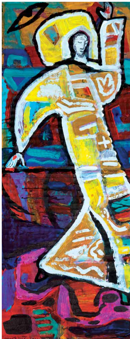
Vstali, 16x42cm, akril-mešana tehnika na kartonu, 2006