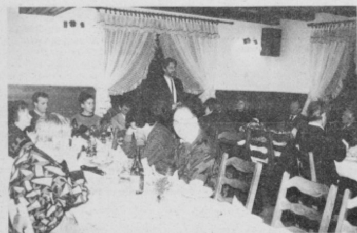
Novoletno srečanje novinarjev in dopisnikov

Vsebinska pódoba časopisa in radijskega programa se iz leta v leto spreminja prvenstveno na osnovi kritičnih pripomb »uporabnikov« in takšne sklepe so zabeležili tudi na tem srečanju v želji, da se krog sodelavcev še razširi, saj je to eden od bistvenih pogojev za celostno obveščanje bralcev časopisa in poslušalcev radia.