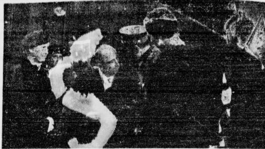
V Belgradu se je mudil te dni predsednik Čehoslovaške republike. Slika nam kaže, kako ga pozdravljajo naša kraljica Marija, knez-namestnik Pavle in kneginja Olga.

d Krona spomladanskega zasedanja Male zveze je bil prošlotedenski sprejem državnega predsednika Čehoslovaške dr. Beneša v Belgradu. Jugoslovanska prestolnica se je vsa odela v zastave in zelenje, poleg večdesetisočere množice se je sprejema udeležil knez-namestnik Pavle z vso jugoslovansko vlado in drugimi visokimi dostojanstveniki. Čehoslovaški predsednik je bil deležen tako pristranskega sprejema in tako viharnih ovacij, kot še nikdo pred njim. Jugoslovanski listi so dali izraza bratskim čutom Jugoslovanov do češkega naroda in čehoslovaške države v dolgih člankih in posebnih prilogah. Dnevi dr. Beneševga bivanja v Belgradu so bili veličastna manifestacija sloge med Jugoslavijo in Čehoslovaško in tako na svoj način dragocen prispevek k utrditvi Male zveze in pomirjenja v Podonavju.