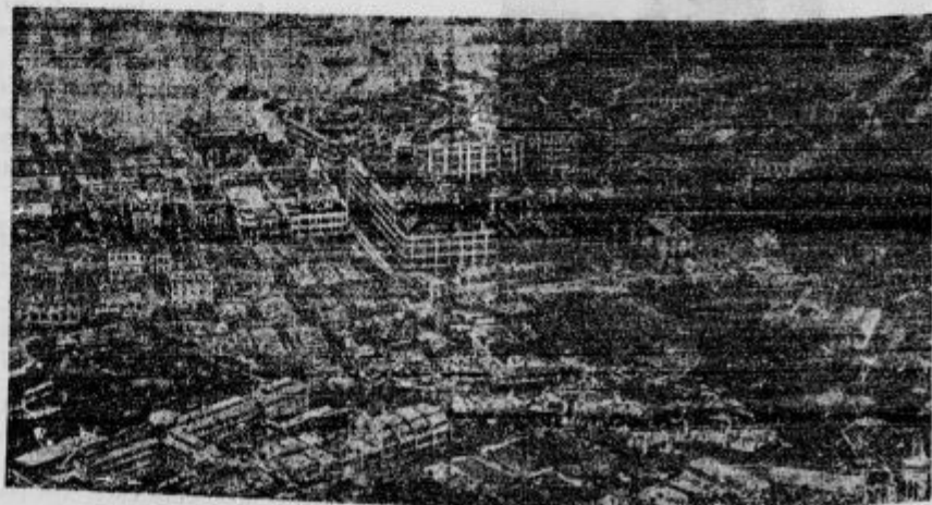
Mesto Hongkong na Kitajskem hočejo Anglieži spremeniti v močno pomorsko trdnjavo.

d Neopravičen dvig cene modre galice. Modra galica se bo podražila zaradi skoka cen bakru na vseh svetovnih tržiščih. Prvo skrb je po-