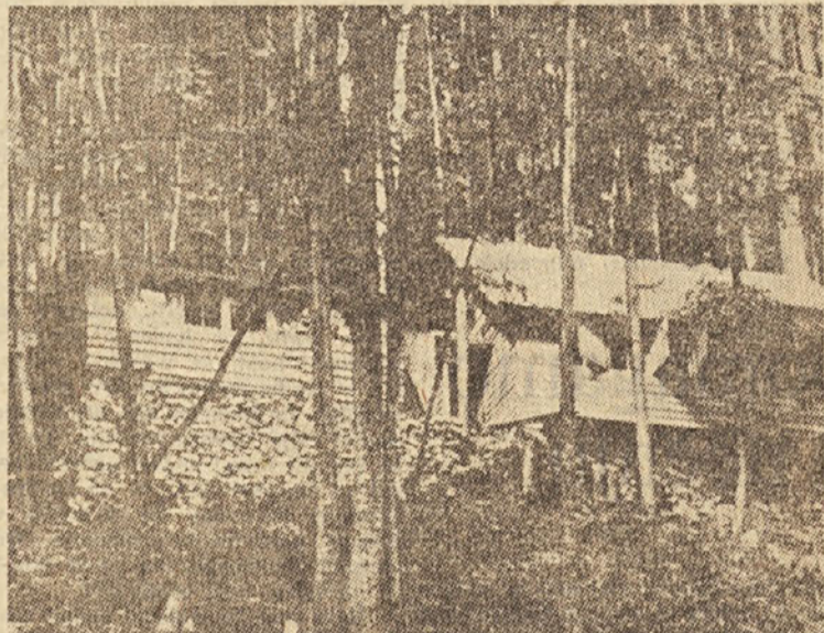
Partizanska tiskarna »Slovenija« na Vojskem