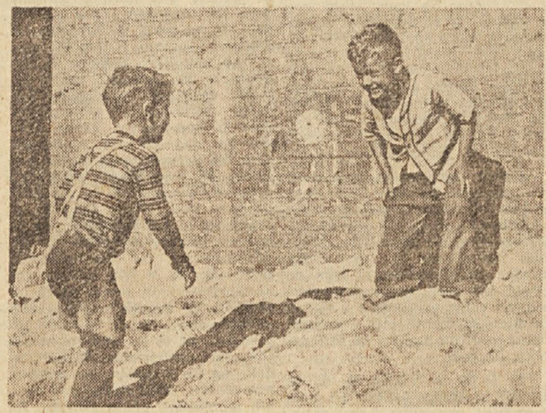
Prizadevanja vzgojnih zavodov so bila doslej pri nas vse premalo ocenjena — vnjih imamo vrsto čisto posebnih vzgojnih problemov, ki niso lahki in njihovo reševanje ni zavidanja vredno...

• Našim učnim načrtom očitajo mnogi preobširnost. Kaj menijo prosvetni delavci o učnih načrtih v Trstu? — Ne da bi se natančneje spuščal v problematiko naših in drugih učnih načrtov, bi dejal le to, da se pri nas prav zaradi »epške širine« učnih načrtov lahko skrijemo zanje in nanje zvalimo doberšen del lastnih neuspehov v šoli (to delamo leto za letom že vsaj dvajset let), medtem ko so drugod (npr. v Italiji) v učnih načrtih nakazani predvsem le smotri pouka, vse drugo pa je prepuščeno učitelju; in ta se seveda potem ne more skrivati za učni načrt. V letošnjem šolskem letu so bili odobreni učni načrti za vse slovenske šole. Na podlagi teh učnih načrtov izdelujemo sedaj ustrezne nadrobne učne načrte z navodili za osnovne in nižje srednje šole. Stevilno predmetov in ur v učnih načrtih osnovnih in srednjih šol v Italiji je manjše kot pri nas. Temeljno osnovno-