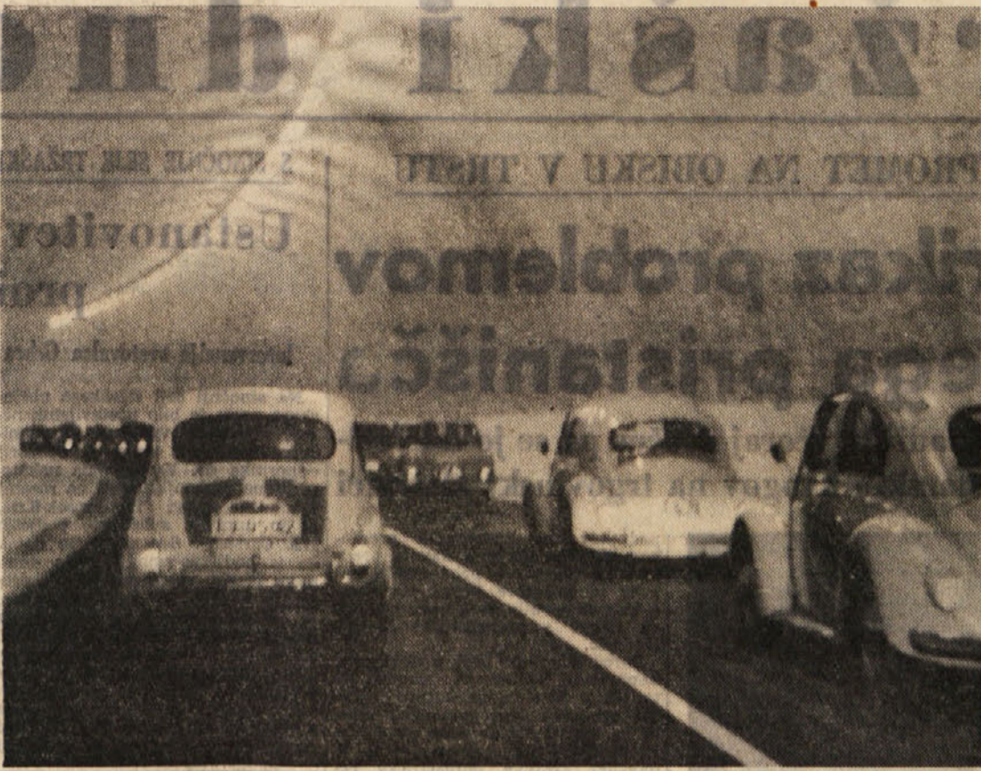
Pred dnevi so končali dela na Ljabelskem predoru med Slovenijo in Avstrijo. Na sliki vidimo prvo kolono avtomobilov ko vozi skozi predor. Ta pa bo izročena prometu šele spomladi

Indijski in zahodnega letalstva. Govoriti je celo že moč o nevarni zaostritvi indijsko-pakistanskih odnosov, kar potrjujejo tudi medsebojno obtoževanje o zbiranju čet in pa številni incidenti v obmejnem pasu.