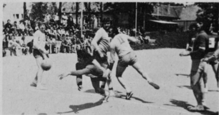
Takih akcij je bilo več

Zelim o jim mnogo uspehov.