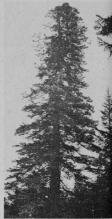
Maroltova jelka se dviguje kot čuvar nad vrhovi dreves bistrškega Pohorja.