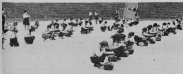
Pionirji in pionirke — podmladkarji Rdečega križa — pri reševanju testov v ormoški Mestni grabi.

Tekmovanje so strokovno vodile medicinske sestre ormoškega zdravstvenega doma in bolnišnice, ki so tudi sicer pionirje pripravljale in poučevale v nudenju prve pomoči. jr