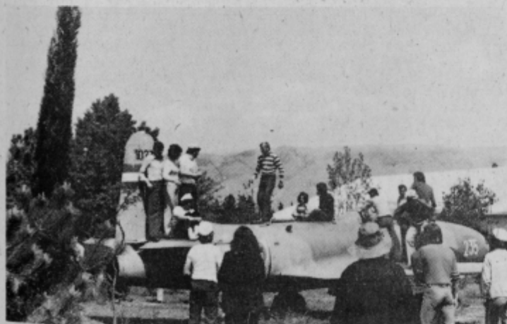
S posebno pozornostjo so si mladi ogledali v Mostarju nekatere dosežke na področju letalstva. Foto in tekst Viktor Horvat