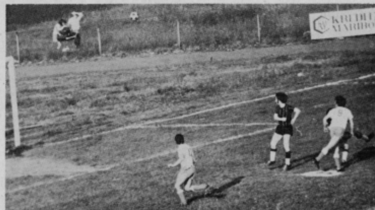
Prvi gol za „Dravo“ je dal Plajšek V.