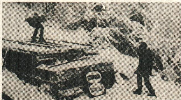
Čeprav ni snega ravno na pretek je sezona zimskih športov na vrhuncu. Prizadevni borovniški smučarski skakalci in ljubitelji tega razvijajočega športa v Borovnici so letos že izpeljali eno tekmo v Ljokih. Nastopilo je enaindeset skakalcev z Logatca, iz Ljubljane, z Moravč, z Ihana in iz Borovnice.

Automontaža TOZD Kovinarska Vrhnika 15 krvodajalcev LIKO Vrhnika 11 krvodajalcev Skupščina občine Vrhnika 2 krvodajalca