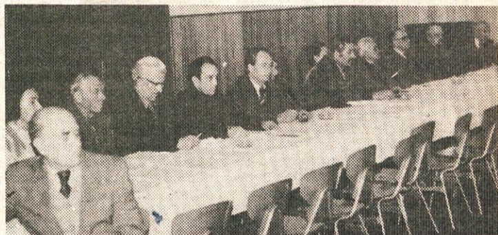
Na volilni seji so se borci dogovorili za nadaljnje naloge

Posebno strokovno telo pa mora ugotoviti kdo je za okvare na cevovodu odgovoren.