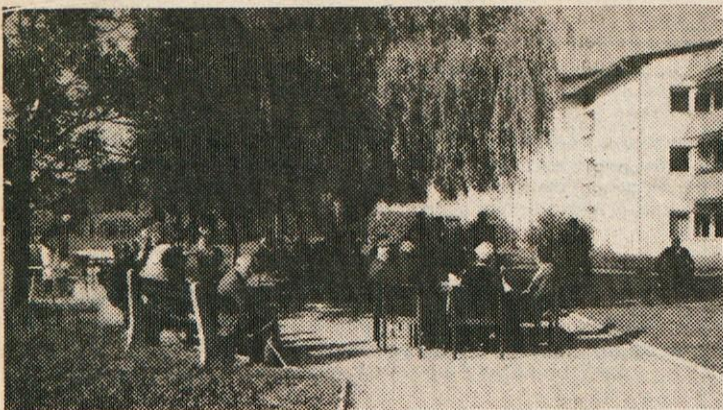
Piknik na našem vrtu