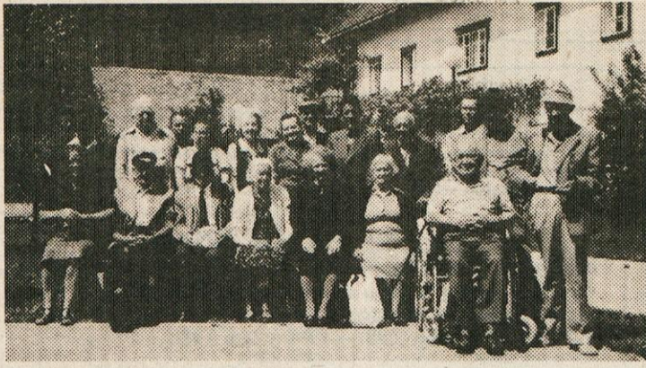
Z izleta v Tržič