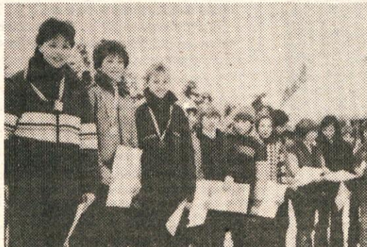
Najboljši v posameznih kategorijah na zmagovalnih stopnicah