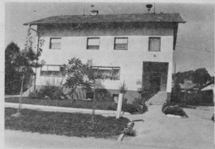
Lepo urejen prostor pred pošto in krajevnim uradom.

Pa še pogled v novi del vasi. Ta daje občutek novega življenja: vas torej ne izumira, temveč se širi. V novi center sodijo Zdravstvena ambulanta, gostilna, trgovina, pošta, sedež krajev-