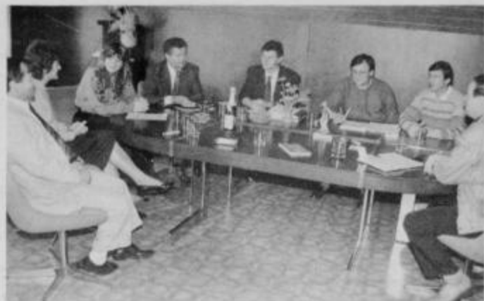
Avstrijski in ptujski podjetniki med sklepanjem pogodbe za mešano avstrijsko-jugoslovansko firmo GHZ Center.