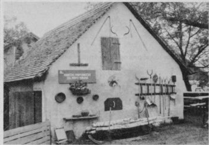
Pripomočki za peko kruha.