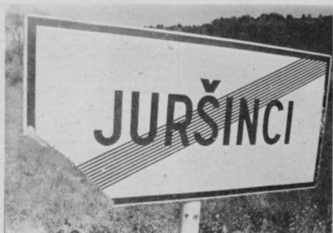
Prometni znak se je srečal z objestneži.

vidika Juršinci v starem delu nimajo možnosti turističnega razvoja. Drugo so seveda okoliški griči, polni lepih hiš. Do nekaterih seže pogled tudi iz vasi in veseli smo bili bogatih cvetličnih okraskov, kar je dokaz srčne dobrote, želje po urejenosti in lepoti.