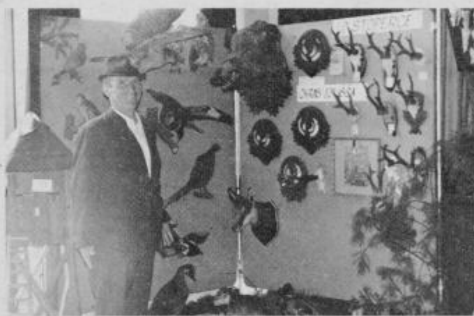
Najkakovostnejše trofeje LD Stoperce na razstavi.

nikov. Za naraščaj se tej lovski družini ni treba bati, saj se vključujejo mladi, med njimi sinovi lovcev, ki bodo ostali doma na