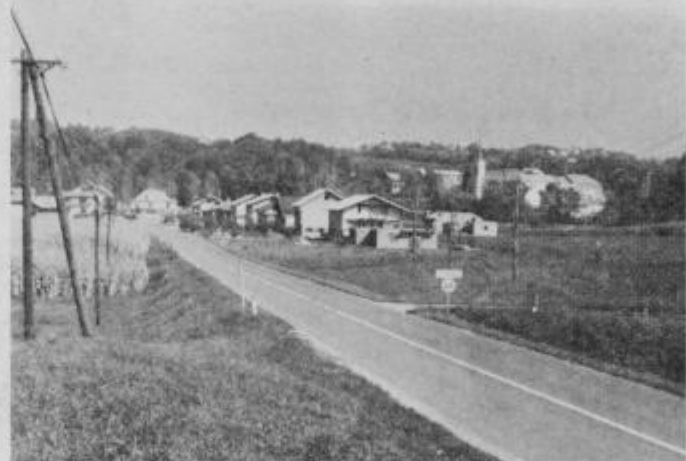
Lep pogled na Juršince.

V starem delu vasi se človek počuti domače med starimi domacijami. Poloti se ga tudi malce nostalgije, saj pogled kaže, da so