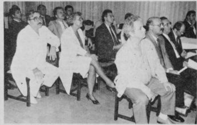
Slovenski kirurgi v jedilnici ptujске bolnišnice.