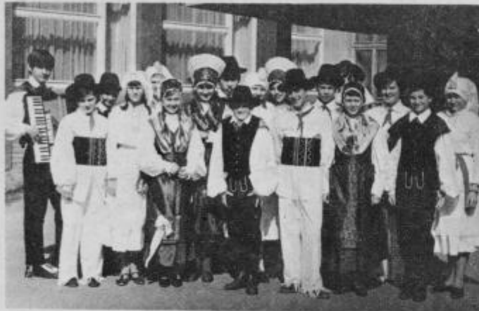
Folklorna skupina, ki je pred 20 leti delovala v okviru DPD Svoboda Kidričevo v zlatih časih, ko je bilo denarja dovolj tudi v Kidričevem.

denimo skoraj nikoli ne pridejo do enotne, skupne programske usmeritve. Veliko reči bi lahko še našteali, mednje sodi tudi problem plačevanja najemnine za prostore, ki jim ima DPD Svoboda in kjer je tudi društvena knjižnica. Problem so tudi mladi oziroma prostor, ki ga imajo, ker jih menda nihče noče imeti za sosedo, predvsem kadar se grejo »disco«, kar pa je po svoje zopet zelo ozkosrčno od starejših ljudi, ki bi, tako pravijo, ponoči radi spali, menda pa pri tem pozabljajo na svoja mlada leta. Brez