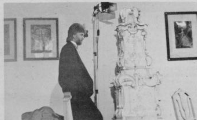
Eden izmed kadrov pri snemanju videa Šum na srcu.

Ker se je vsa ekipa — zelo glasna, seveda — z dvorišča preselila v eno izmed soban, smo prodajali zijala tudi mi. V živo smo si ogledali, kako poteka takšno