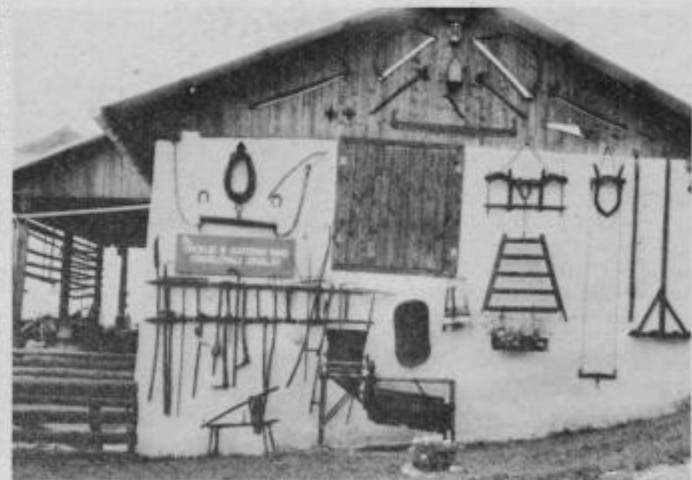
Orodje za obdelovanje zemlje.