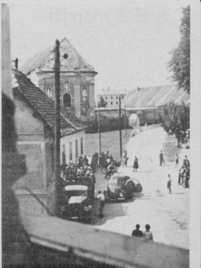
Pred stavbo sodnega zapora v Ptuj — kamion s talci, ki so jih odpeljali na morišče v Celje poleti 1942.

Pretresljiva je usoda Irmanove družine, kajti oče in mati ter