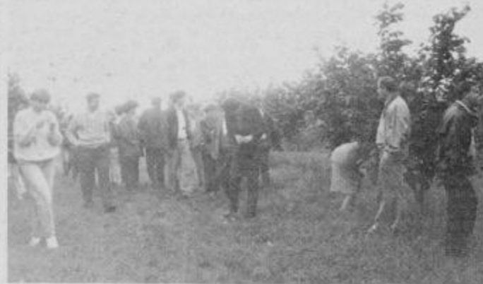
V nasadu leske.

Organizatorji naše ekskurzije so dejali, da ta ne bi bila celovita in