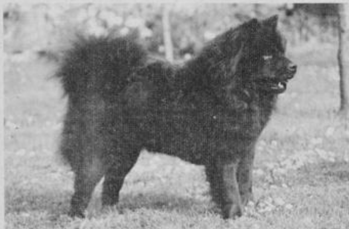
Argosz je bil najlepši