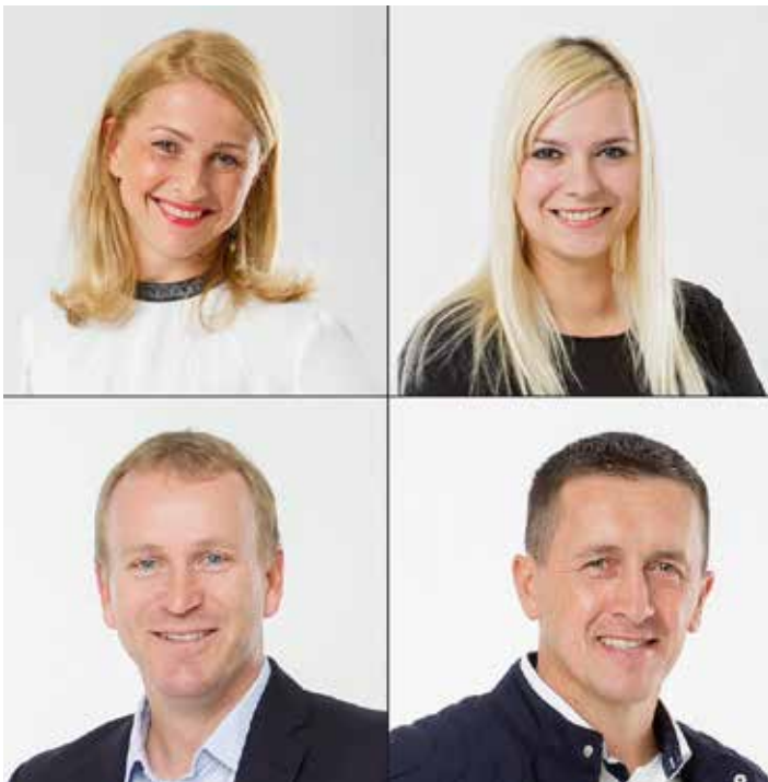
Svetniška skupina Liste Mateja Kotnika 2018–2022