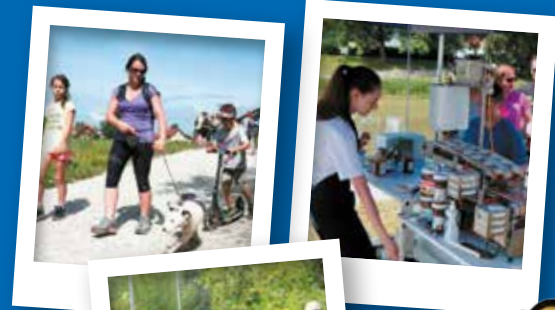
4. POHOD OB REKI, KI POVEZUJE