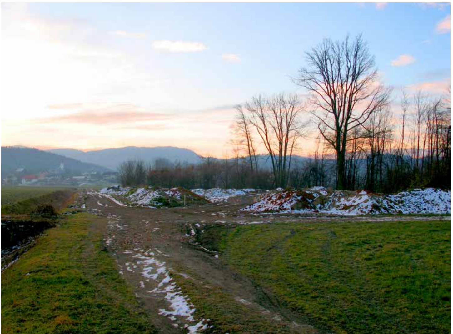
Njivice, Hudičeve jame, januar 2018. Varovalni gozdiček ali "varovana deponija" gradbenega materiala in zemlje ?!