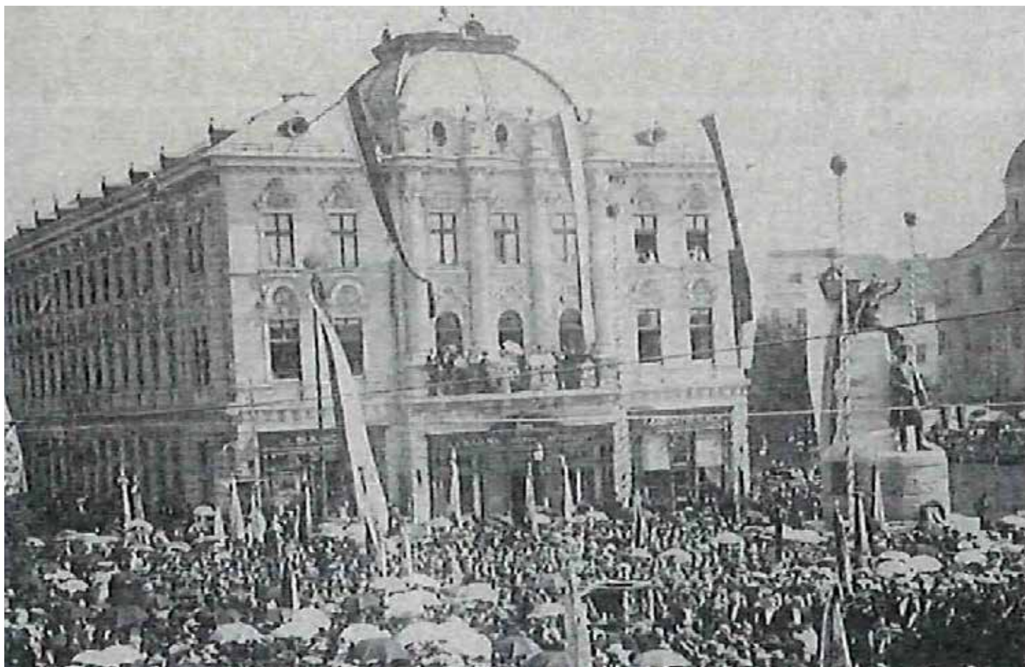
Odkritje Prešernovega spomenika v Ljubljani leta 1905

VIR: ZBIRKA UPODOBITEV ZNANIH SLOVENCEV NUK OBJAVLJENO NA DLIB: URN:NBN:SLIMG-D4HMSTQL