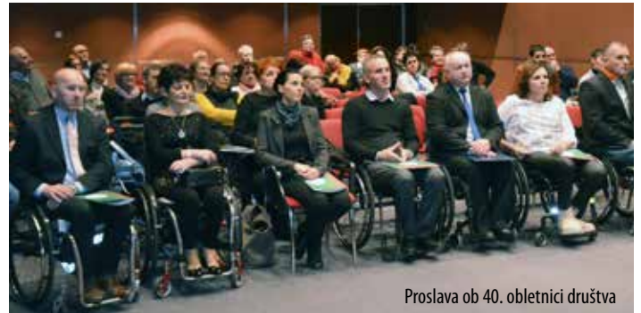
Proslava ob 40. obletnici društva

Na proslavi so se spomnili tudi članov, ki so s svojim delom v preteklosti uspešno krmarili društvo in ga pomagali pripeljati do prepoznavnosti, ki jo ima danes. Nekdanjim predsednikom so podelili plakete društva, drugim zaslužnim članom pa priznanja. Priznanje je za sodelovanje in podporo prejel tudi Mercator, d. d. Zahvalili so se tudi vsem partnerjem, občinam, invalidskim organizacijam, institucijam, sponzorjem in donatorjem ter drugim, ki so z njimi sodelovali in jih podpirali. Še posebno pa krovni organizaciji Zvezi paraplegikov Slovenije. Brez njihove pomoči ne bi dosegli takih uspehov.