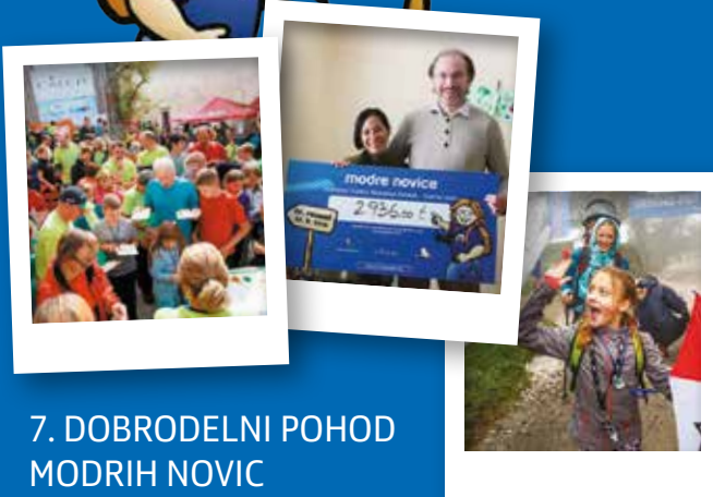
7. DOBRODELNI POHOD MODRIH NOVIC