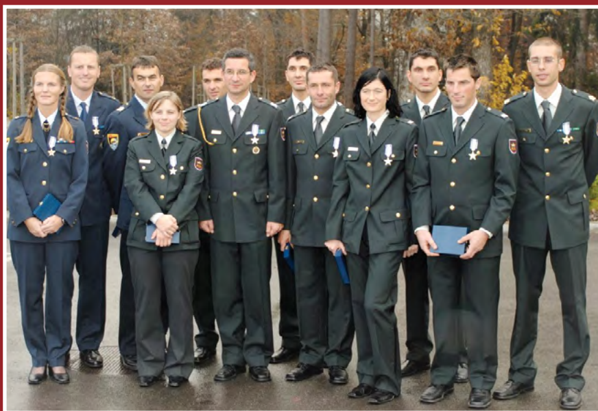
Prejemniki CISM priznanj – športniki