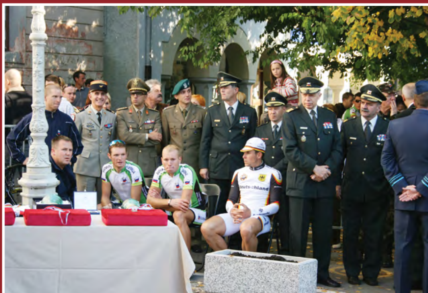
Sklepna slovesnost – zmagovalci posamičnih dirk