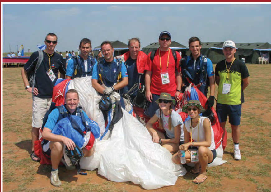
Padalska ekipa na igrah