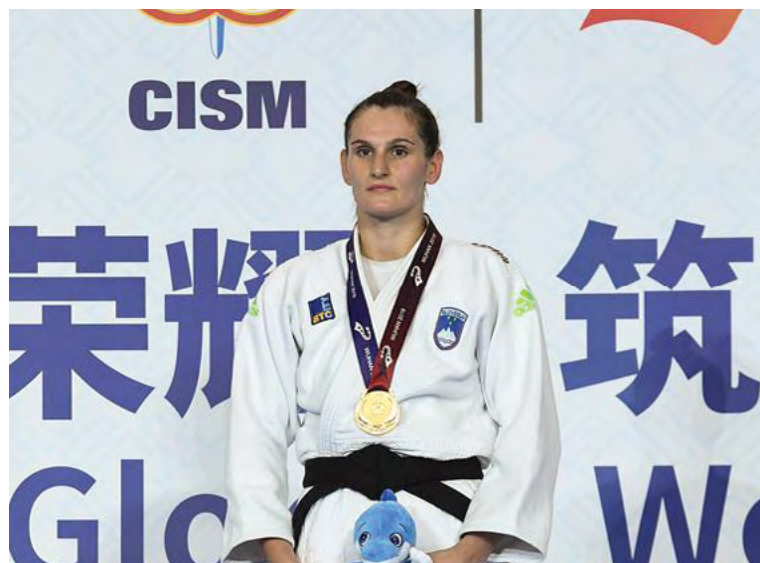
Apotekarjeva na prvem mestu, do 70 kg