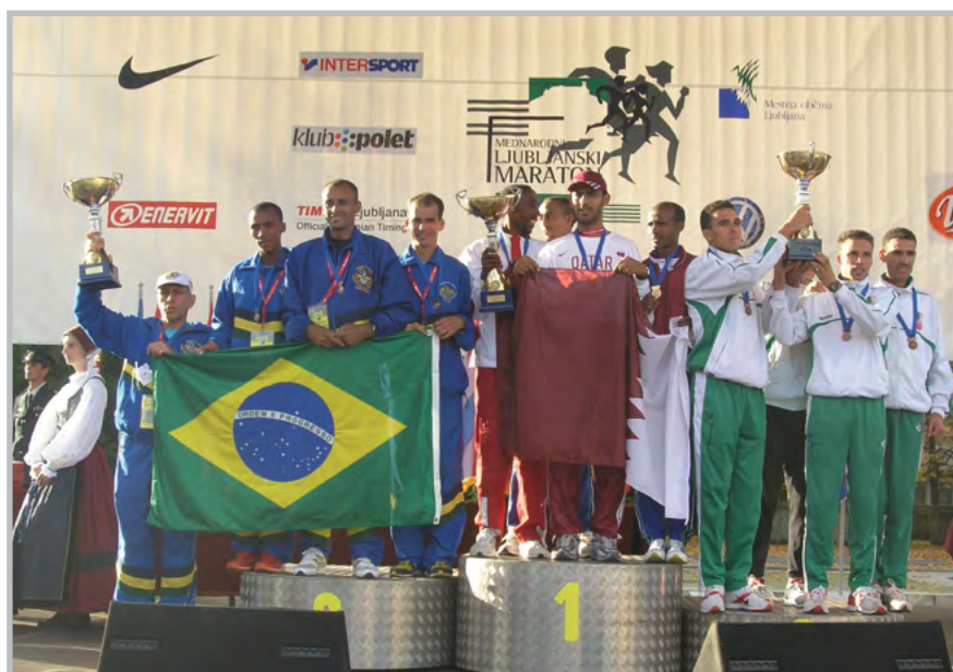
Ekipni zmagovalci maratona