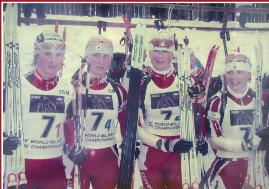
Mali, Brankovič, Grašič, Larisi, patroljni tek