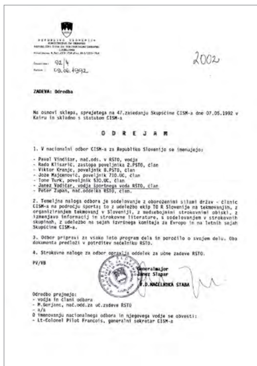
Člani Nacionalne delegacije RS v CISM