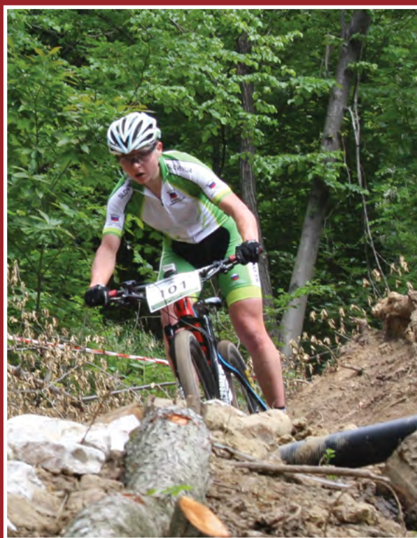
Žakljeva na progi