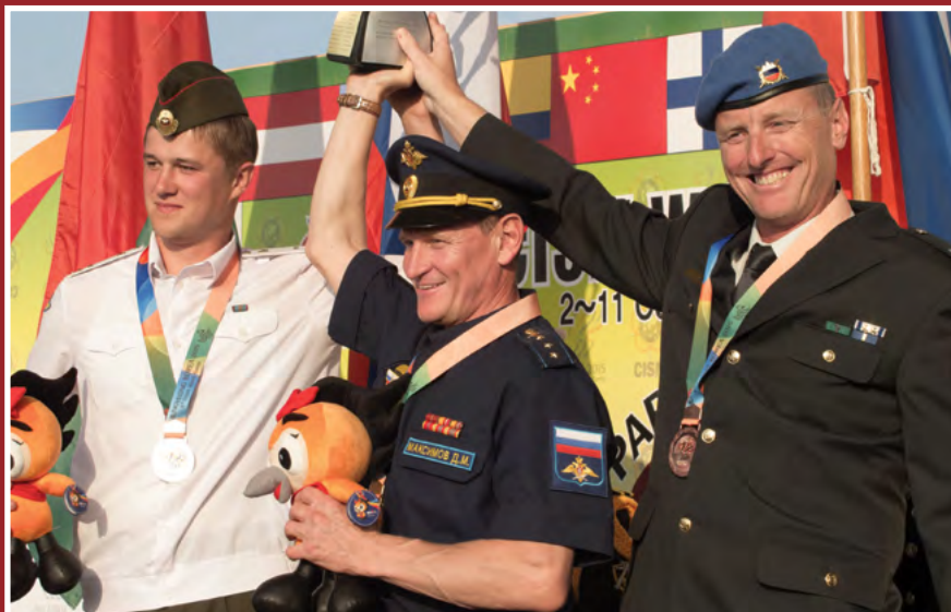
Karun na tretjem mestu v padalstvu posamično