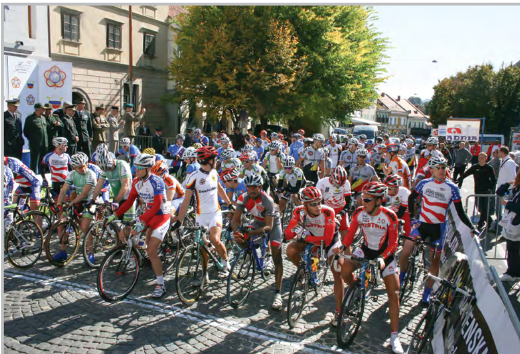
Start posamične tekme