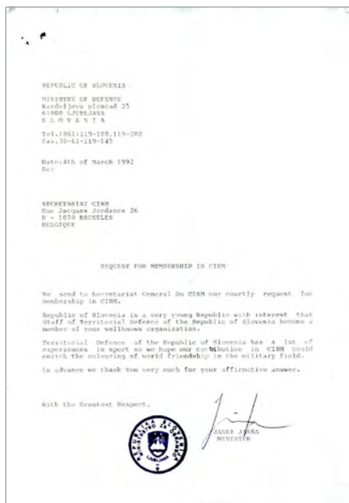
Prošnja za včlanitev Slovenije v CISM

Ministrstvo za zunanje zadeve Republike Slovenije je 24. februarja 1992 začelo postopke za včlanitev Slovenije v Mednarodni svet za vojaški šport – CISM. Na generalnega sekretarja CISM je naslovilo pismo in izrazilo željo, da bi Slovenija postala članica te velike vojaške športne organizacije. Sledila je uradna kandidatura Republiškega štaba Teritorialne obrambe Slovenije, ki so jo države članice CISM obravnavale na svoji 47. generalni skupščini v Kairu v Egiptu. Sedmega maja 1992 so delegati skupščine s 47 glasovi (od 52) sprejeli Slovenijo kot novo članico Mednarodnega sveta za vojaški šport.