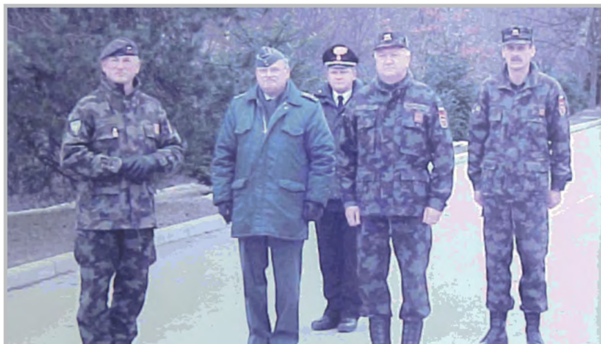
Prihod visokih gostov

Prvenstvo je bilo ponovno odlično organizirano, za kar smo prejeli veliko pohval tujih predstavnikov delegacij.