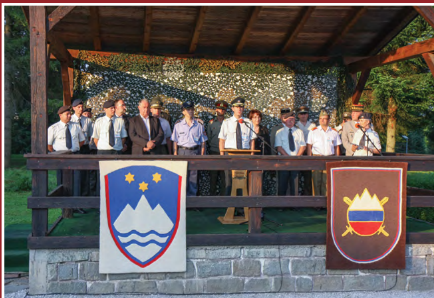
Govor vodje Organizacijskega odbora