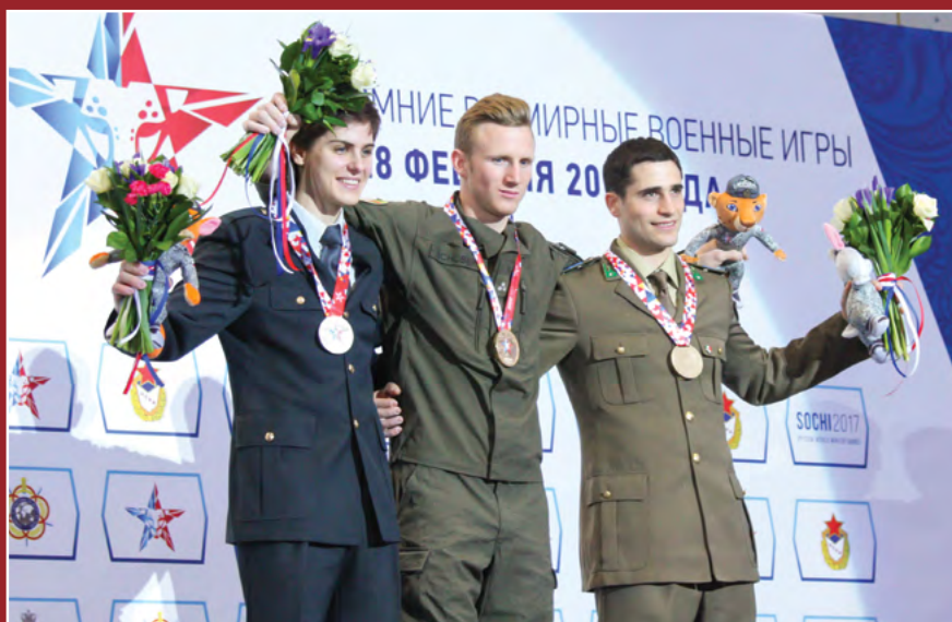
Drugo mesto Škofica v težavnosti