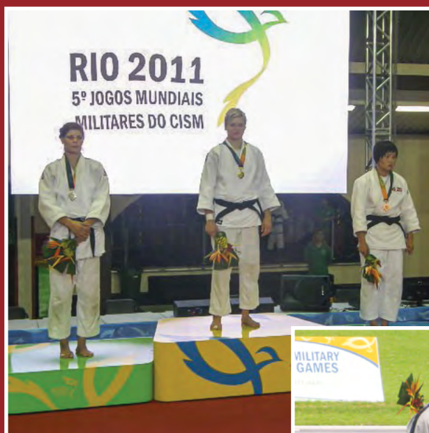
Žolnirjeva zlata – do 63 kg