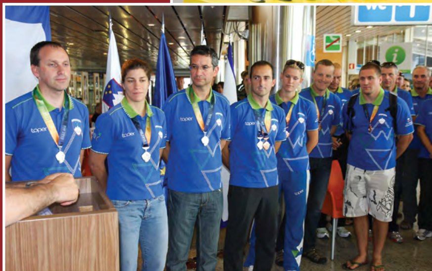
Sprejem ob vrnitvi na Brnik