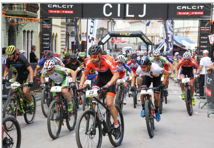
Start moške dirke