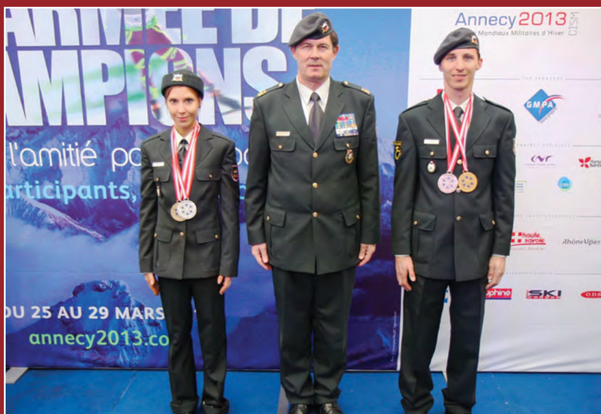
Slovenska delegacija z osvojenimi medaljami