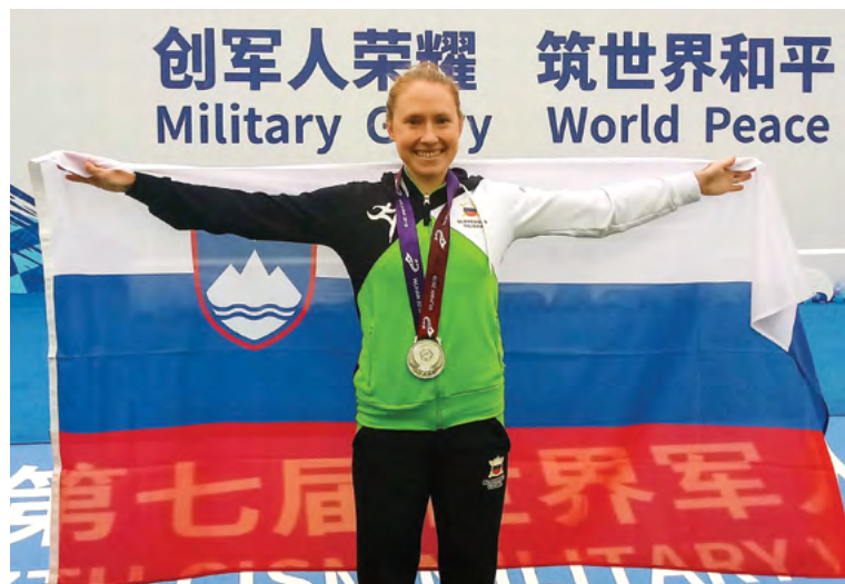
Peršetova srebrna v plavanju na 5000 m