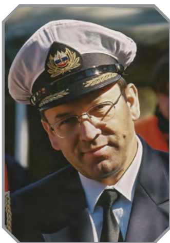
2005: kontraadmiral Renato Petrič