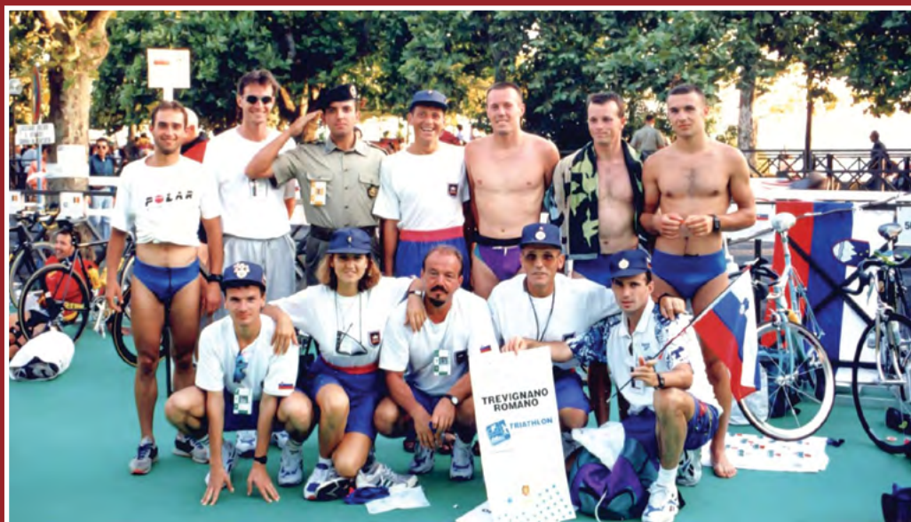
Triatlonska ekipa SV