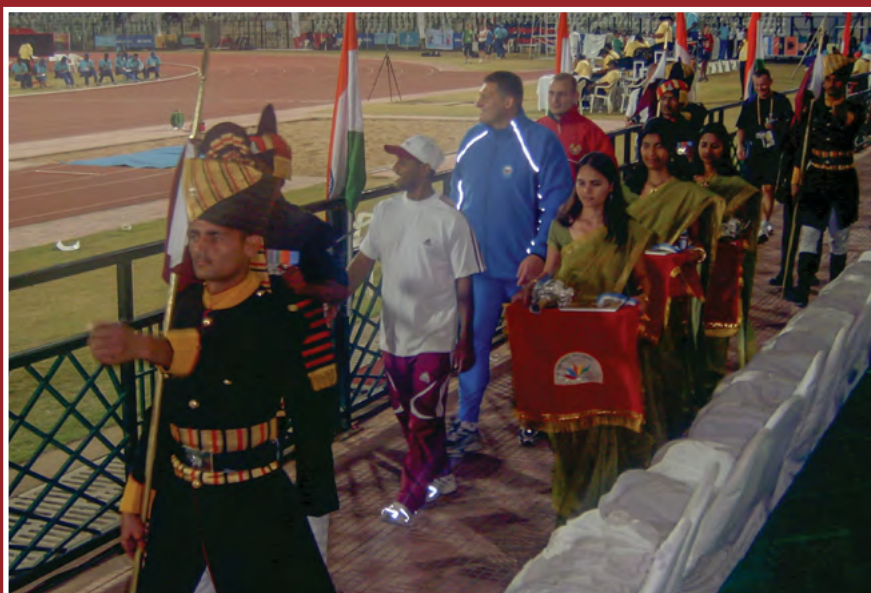
Met krogle, Vodovnik – razglasitev