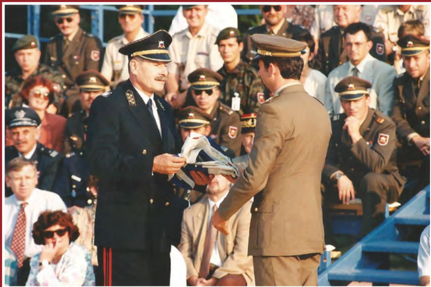
Predaja zastave CISM