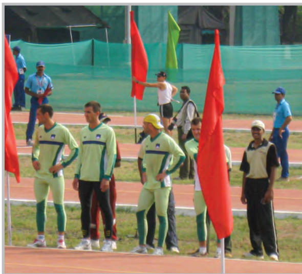
Odprtje vojaškega peteroboja

Med 12. in 22. oktobrom 2007 so v Hyderabadu v Indiji potekale 4. svetovne vojaške igre, na katerih je sodelovalo skoraj pet tisoč pripadnikov in pripadnic oboroženih sil iz 103 držav sveta. Petintrideset pripadnikov Slovenske vojske je v Indiji nastopilo v osmih športnih panogah, in sicer v padalstvu, vojaškem peteroboju, atletiki, boksu, strelstvu, triatlonu, judu in jadrnanju. Mednarodno funkcijo sodnikov