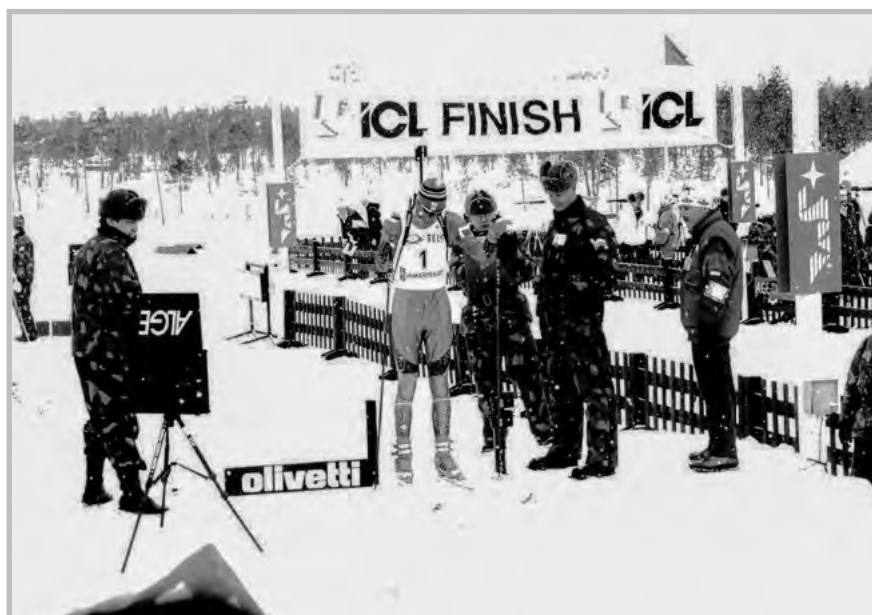
Prva uradna udeležba SV na tekmi pod okriljem CISM na Finskem 1992