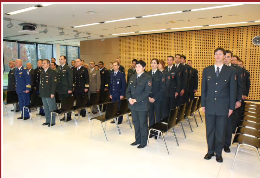
Športniki na sklepni slovesnosti