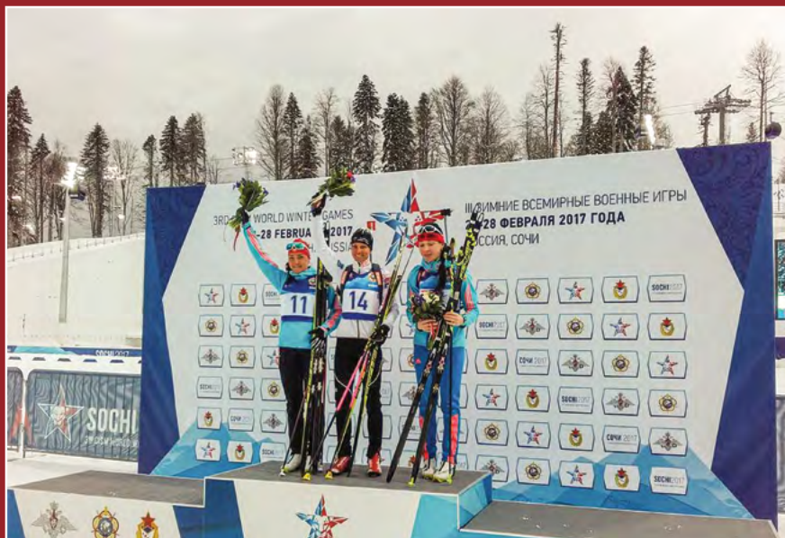
Gregorinova zlata v biatlonu