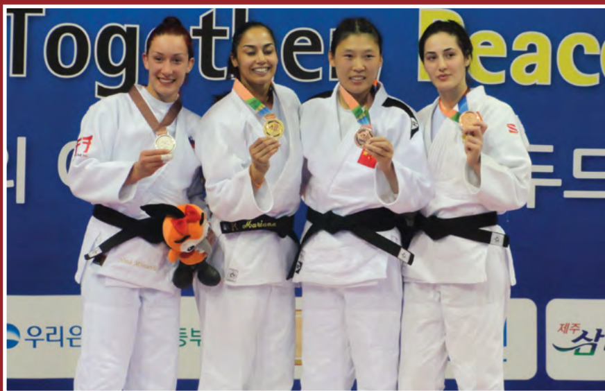
Miloševićeva srebrna v judu