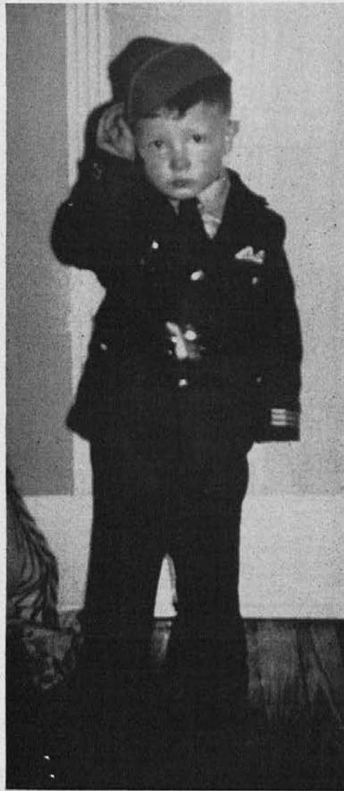
Materin ponos v vojaški suknji.

Mamica je danes sama, ali ji nebi hoteli