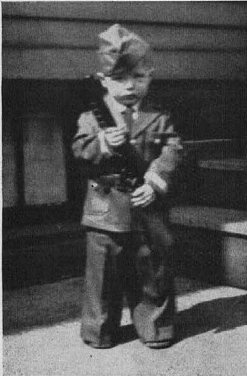
Še najmlajši je soldat—najrajši

Tako nekako se je pismo glasilo. Oblekel sem njegove misli samo v lepše sestavke, smisel pisma je pa ves tak kot o njem moje besede govore.