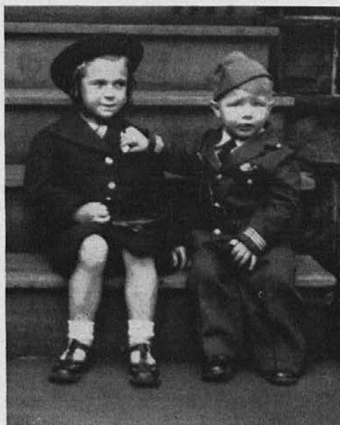
Ta dva ne bota vedela, kaj je vojska. — Upamo in pravimo.

Naša hiša je nekam tuje skrivnostna nocoj.