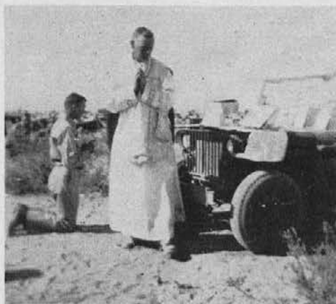
Kurat mašuje na altarju tovrnega avta.

Poleg nje na belih blazinicah pa sanjati dve kodrasti glavi, brezskrbni in srečni. Jukunda ju redi s kapljami lastnega življenja — kakor pelikan . . .