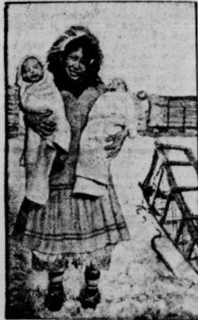
Eskimka z dečjčkoma.

Tudi ptičev je cela vrsta. Tam so: snežna sova, snežni strnad, sokol, vrani, sivi galeb, divje race in še drugi.