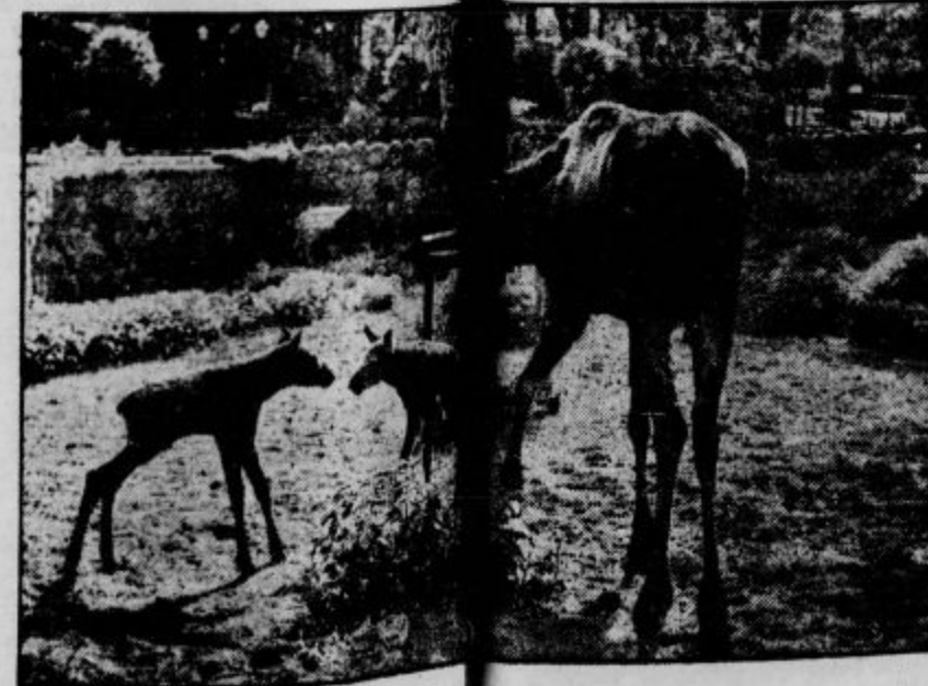
Kobula severnega jela z mladčema

Pač pa je za eskimsko ženo prednost to, da ji treba posode preveč natančno čistiti. Lonec, v