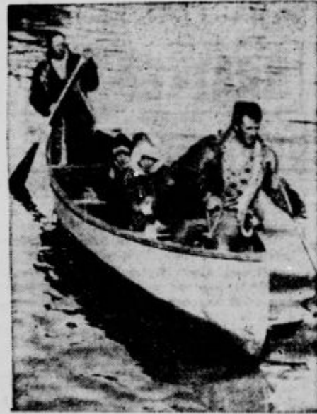
Grönlandija z Severnim ledenim morjem.

Prebivalci Grönlandije so, kakor se imenujejo sami Grönlandci ali Eskimi, kakor jih imenujejo drugi. Zelo so pomešani z evropsko krvjo.