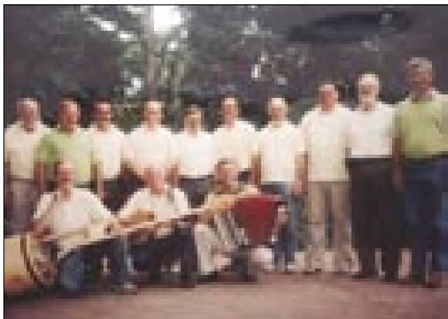
Moški pevski zbor Maj iz Kranja

Slovensko društvo v Budimpešti je tau leto pa (že četrtrič) organiziralo piknik, steroga držimo v čast samostojnosti Republike Slovenije. Ka je te svetek (dan državnosti/az államiság napja)