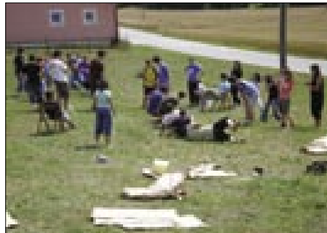
Športne dejavnosti so zelo priljubljene

tudi lončar, z njegovo pomočjo otroci oblikujejo izdelke. Razen tega so še pirografske delavnice, ko v les žgejo različne motive. Imamo pa tudi ogled kmetije v