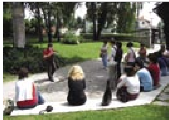
Pri Prešernovem spomeniku v Kranju