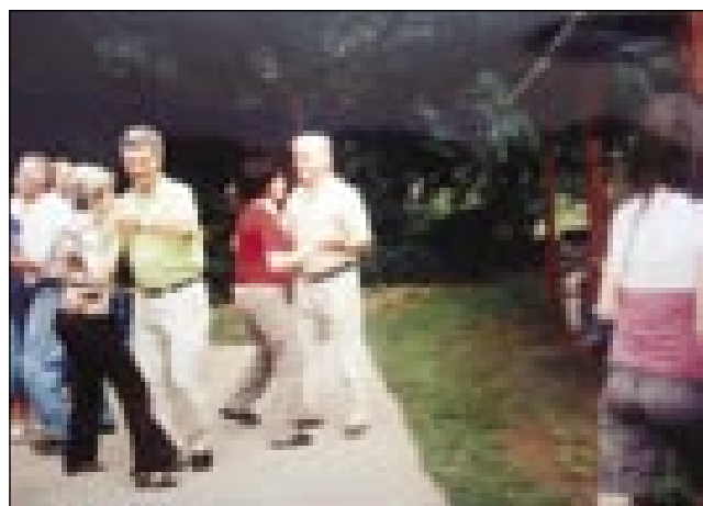
Plesalo je staro ino mlado

Po pozdravih smo začnili program s slovensko himno, moški zbor go je sploj lepau spejvo. Potejm je bila na vrsti pesem Slovec sem, ta se je šikala na te den.