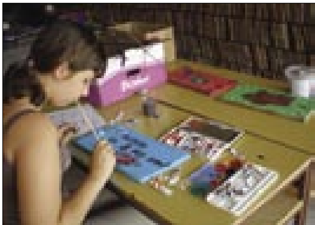
Otroci ustvarjajo v raznih delavnicah

Od 29. junija do 5. julija je v markovski župniji potekal 2. Oratorij pod geslom »Nate računam«, ki