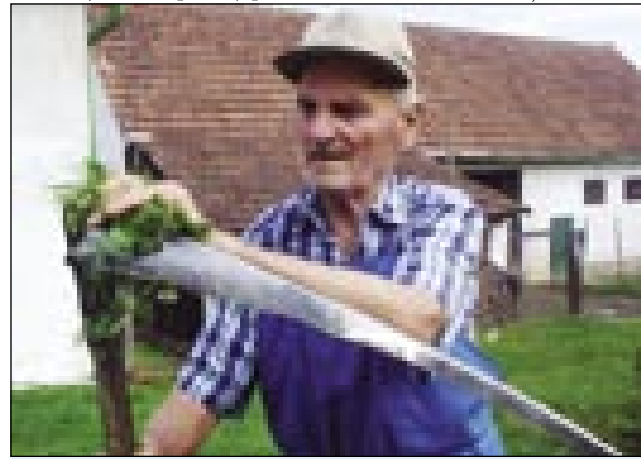
Pušujcini Djanoš vsigdar red držijo kaulak rama

»Dja sam delat v fabrik nej odo, vsigdar sam doma bijo. Žena v fabrik odla delat, dapa ona mi je tö dosta pomagala, pa stariške dočas so živali. Nejsmo meli nej svetka pa nej petka.