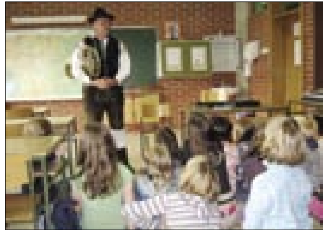
Na uri glasbene vzgoje na OŠ, učitelj v značilni gorenjski noši