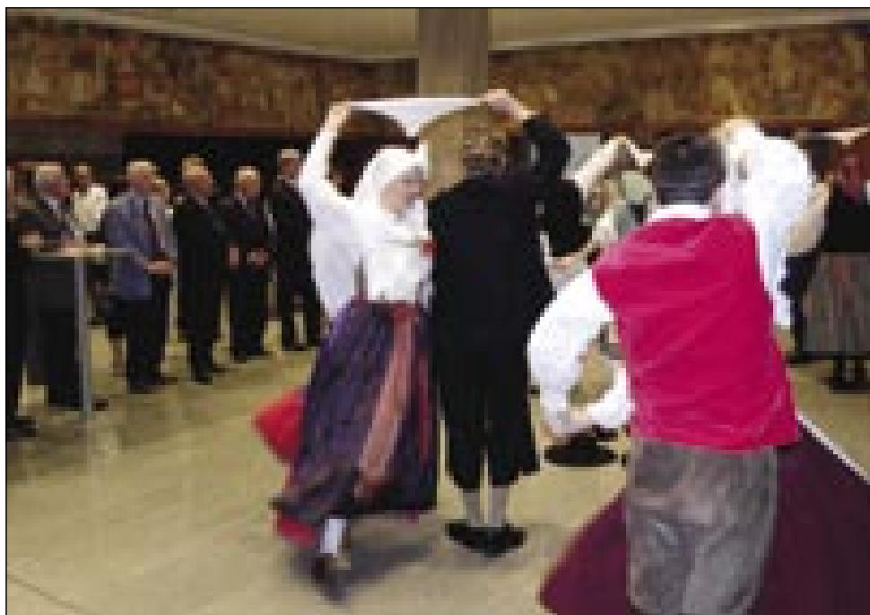
Za obiskovalce je v avli državnega zbora plesala folklorna skupina Nagelj iz Kanade, ki letos praznuje 50. obletnico delovanja