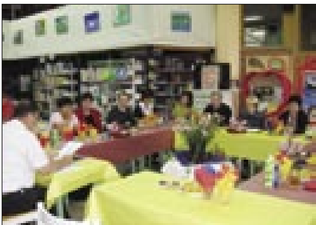
Na obisku na OŠ dr. Josipa Plemlja na Bledu