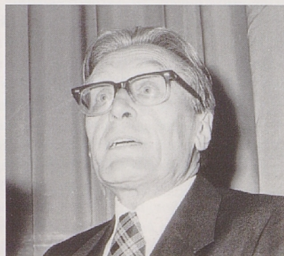
BRATKO KREFT, Draga 1974 - V svojem humanističnem marksizmu, ki se ni identificiral s prakso diktature, si je upal stopiti na tribuno Drage, ko si drugi niso.