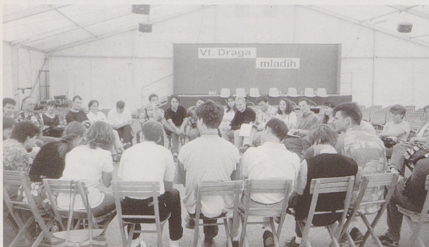
Delovna skupina na lanski Dragi mladih.