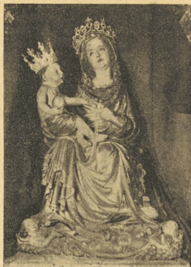
Marijin kip v cerkvi pri Gospe Sveti

Preveč je umetnin v cerkvi, da bi mogli vse naštet. Najznamenitejša je pač že omenjena oltarna menza v severni stranski ladji iz 8. ali 9. stol., položena na šest stebričev, pod njo pa se nahaja rimski sarkofag z zemskimi ostanki sv. Modesta. Ta sarkofag so pa šele pozneje podstavili pod oltarno menzo. O tem, dali so ostanki svetnika nesporni, se prav letos vršijo preiskave; ni pa menda dvoma o tem, da je bil Modest res na tem mestu pokopan. Ta