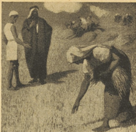
Ruta pobira klasje

Pa denimo, da gospodar dovoli. Potem se neredko ljudje vržejo na drevo, ne kakor da bi hoteli sadje obrati, ampak kakor da je treba vse veje polomiti in morda še kar drevo izrupati. Vse to so znaki pomanjkanja naravne dobrote.