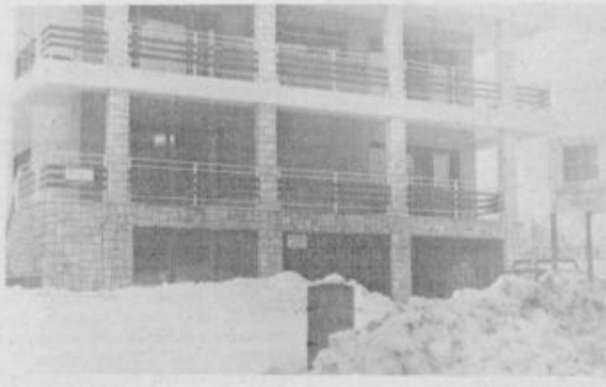
Agencija dela v Zemljičevi hiši