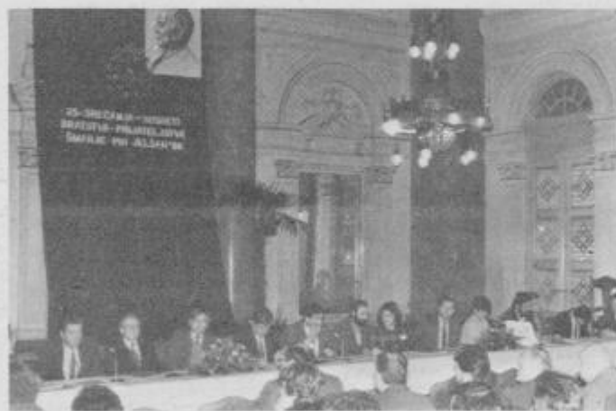
V delovnem predsedstvu slavnostne seje so bili predsedniki občinskih svetov ZS vseh 13 občin