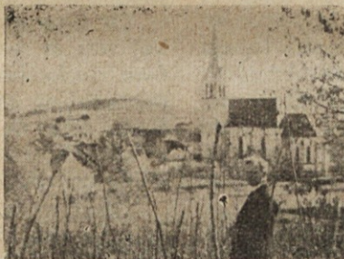
Pogled na Šmihel pri Žužemberku.

s katerim mislijo imenovane oblasti, odpuščajoč mnogim preteklost, obnoviti ner-