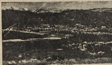
Gorizia es centro cultural de Eslovenia ocupada por Italia. La pintoresca ciudad con su romántico castillo está situada sobre el río Soča (Isonzo).

To je sodobni človek: Košat, poln samozavesti, a brez zdravih korenin. Kakor človek, tako njegova družba.