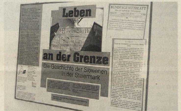
5 stalne razstave v Potrnju