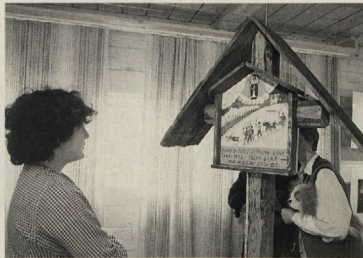
Ko je »Pušič zmrznil 8. svečana 1845 78 let star«

da je slovenska Glasbena šola na Koroškem v 20. letu svojega obstoja neodtujljiv del kulturnega utripa tako slovenske narodne skupnosti kot tudi celotne dežele. V dveh desetletjih je ta šola nudila glasbeni pouk več tisočim učencem, v tem šolskem letu jih je nad 400, nekateri od njih pa so glasbeno izobraževanje nadaljevali in danes že kot absolventi sami vzgajajo nov rod dijakov