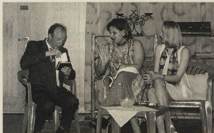
Feksu se je ob damah odprlo srce

nekaj aktualnih ocirkov (euro, Breznik, Hartman, instrumentalisti Žvabeka, Pliberk južno od Dunaja itd., pa tudi nekaj narečnih posebnosti in napak), predvsem pa je v igro vključila mnogo dovtipov, ki so komičnost samo