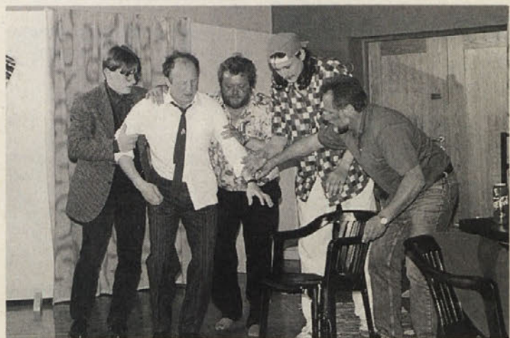
Da se sirotej le ne bi kaj storil!