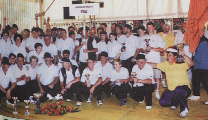
Zmagali so komunalci iz Velenja.