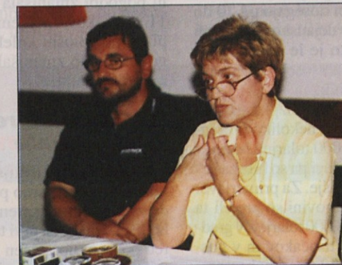
Inšpektorji dajejo delavcem tudi brezplačno pravno pomoč.

Nepravilnosti so tudi pri plačah, kjer delavcem pogosto izplačujejo le minimalno plačo, razliko pa dobijo na roko. Pri izplačevanju plač inšpekcija le posreduje, nepravilnosti pa lahko odpravi le sodišče. Vse takšne primere inšpekcija prijavlja davčni upravi. Inšpektorji ima-