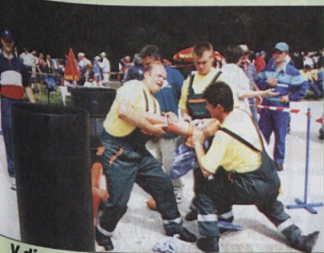
V disciplini kanalizacija je bilo poleg spretnosti treba pokazati tudi moč.