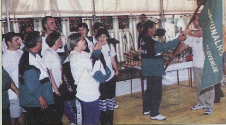
Sežančani so prevzeli prapor organizatorjev, prihodnje igre bodo torej v Sežani.