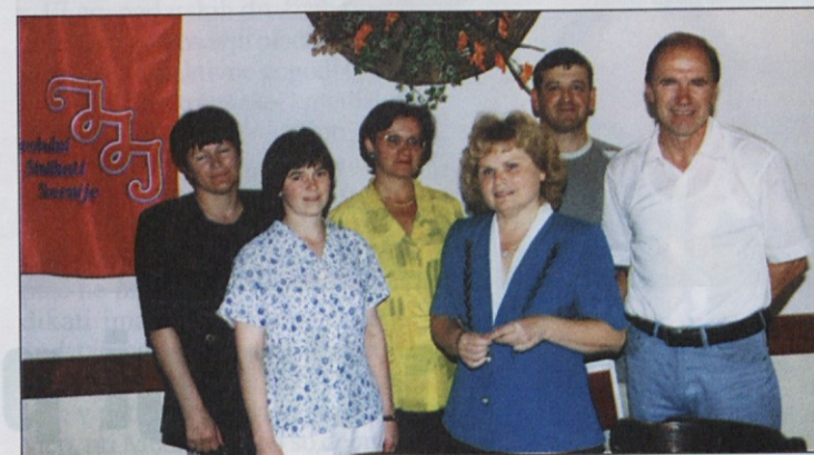
Na gasilski sliki posneti po konferenci so člani nadzornega odbora in sekretarka območne organizacije ZSSS Domžale v družbi s predsednikom ZSSS.

V območno organizacijo ZSSS Domžale je povezan približno 4000 članov iz 40 sindikatov družb in zavodov. Sindikati podjetij so povezani v 12 sindikatov dejavnosti. V preteklih letih so delovali štirje območni odbori sindikatov, ker sta zamrla odbora Sindikata KŽI in SKEI, delujeta le še odbora Stupis-a in Sindikata Vir. Najštevilčnejši je Stupis, v katerem je skoraj tretjina vseh članov Svobodnih sindikatov, drugi največji sindikat je KNG, na tretjem mestu pa SDTS.