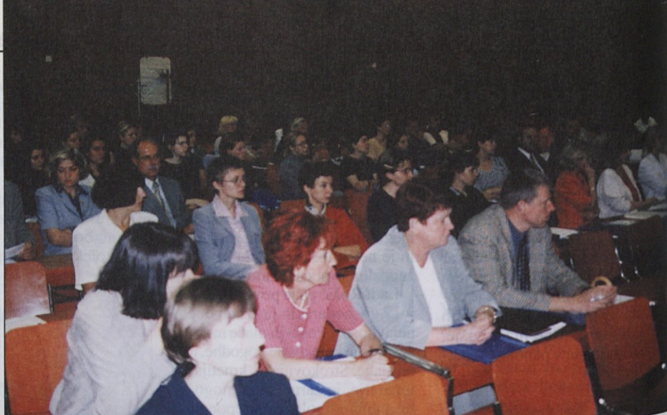
Na posvetovanju so se zbrali predstavniki vseh socialnih partnerjev, zavodov in strokovnih združenj, ki lahko prispevajo k razvoju tekstilne industrije.

Kljub temu, da je politika zapostavljala in še zapostavlja inženirske poklice, mariborska fakulteta za strojništvo izobražuje kadre, ki po svojem znanju, samostojnosti in kreativnosti