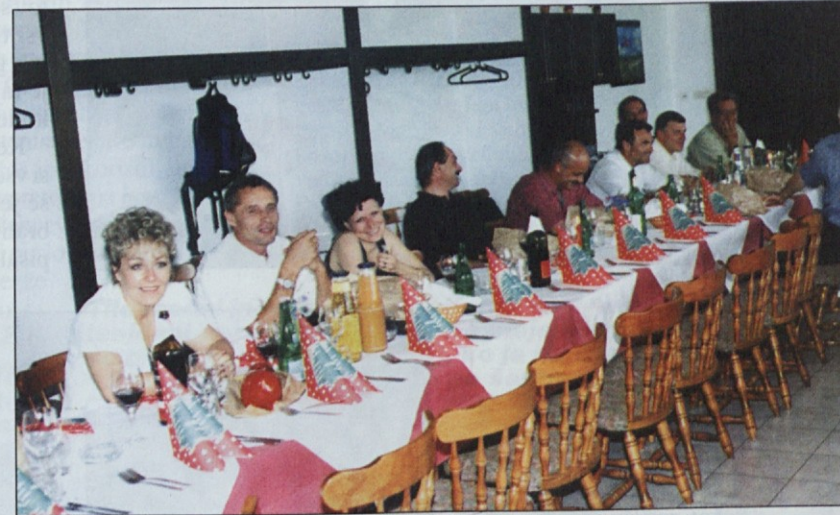
Varčevalci lahko računajo na ugodne obresti, lastniki kapitala pa na dividende.

Narašča tudi dobiček, ki bo ob polletju verjetno tolikšen kot v vsem lanskem letu, ko je dosegel 40 milijonov tolarjev. Stopnja donosnosti kapitala je torej 20-odstotna, dividende na vplačani kapital pa bodo desetodstotne. Vse to je skladno s cilji načrta poslovanja v triletnem obdobju 2000-2002.