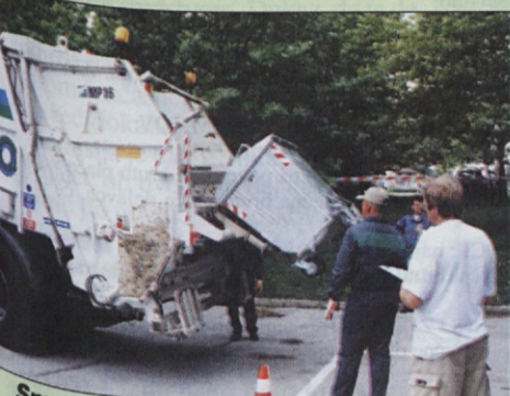
Smetarji so nalogo opravili veliko hitreje kot po naših naseljih.