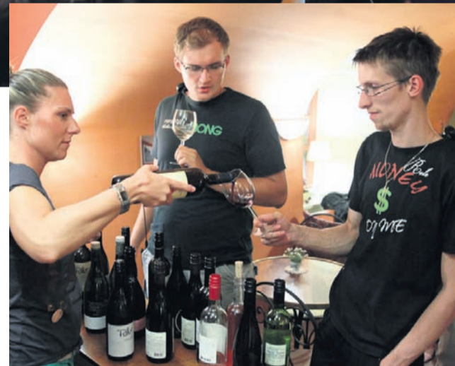
(Dnevi poezije) ... in vina