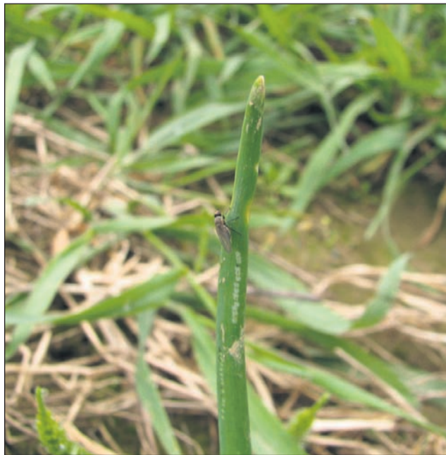
Muha in pikice, ki jih naredi z dopolnim prehranjevanjem; ko jih opazite, je zadnji čas za ukrepanje.

Pazite pa, da boste zastirko tudi v tla dobro zadelali, ne je samo prekrito s kamni. Potem lahko med zemljo in zastirko pri grudah nastanejo, ostanejo luknje. Muha jih bo zanesljivo našla.