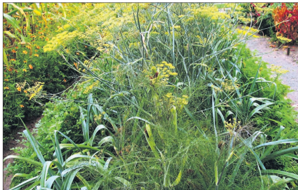
Por, skrit med kopro, peteršiljem in korenčkom je dobro zavarovan.

Legenda: 🥕 korenina 🌸 cvet 🍅 list 🍅 plod 🍅 neugodno 🍅 presajanje