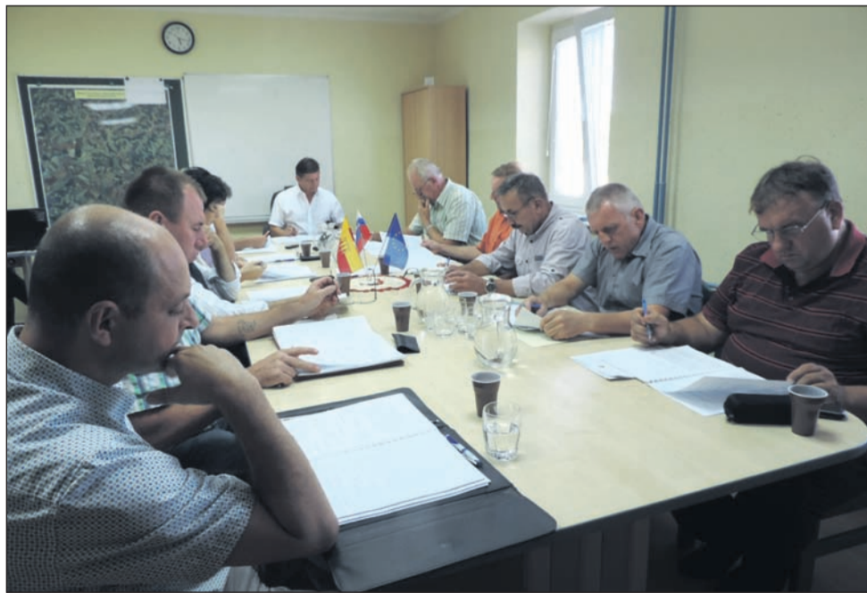
Na tokratni seji so nekateri svetniki očitali, da cestno problematiko rešujejo le v Oseki. Župan je krivdo prevzela na občinski svet.