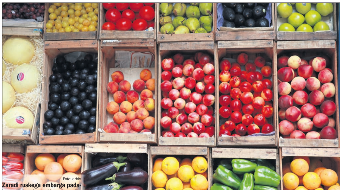
Zaradi ruskega embarga padajo med drugim tudi cene sadja in zelenjave.

zaradi nizkega deleža proizvodov, za katere je ruska stran uvedla omejevalne ukrepe, v celotnem slovenskem izvozu v Rusijo ne bo občutnejšega, zlasti pa ne takojšnjega vpliva na slovensko gospodarstvo.