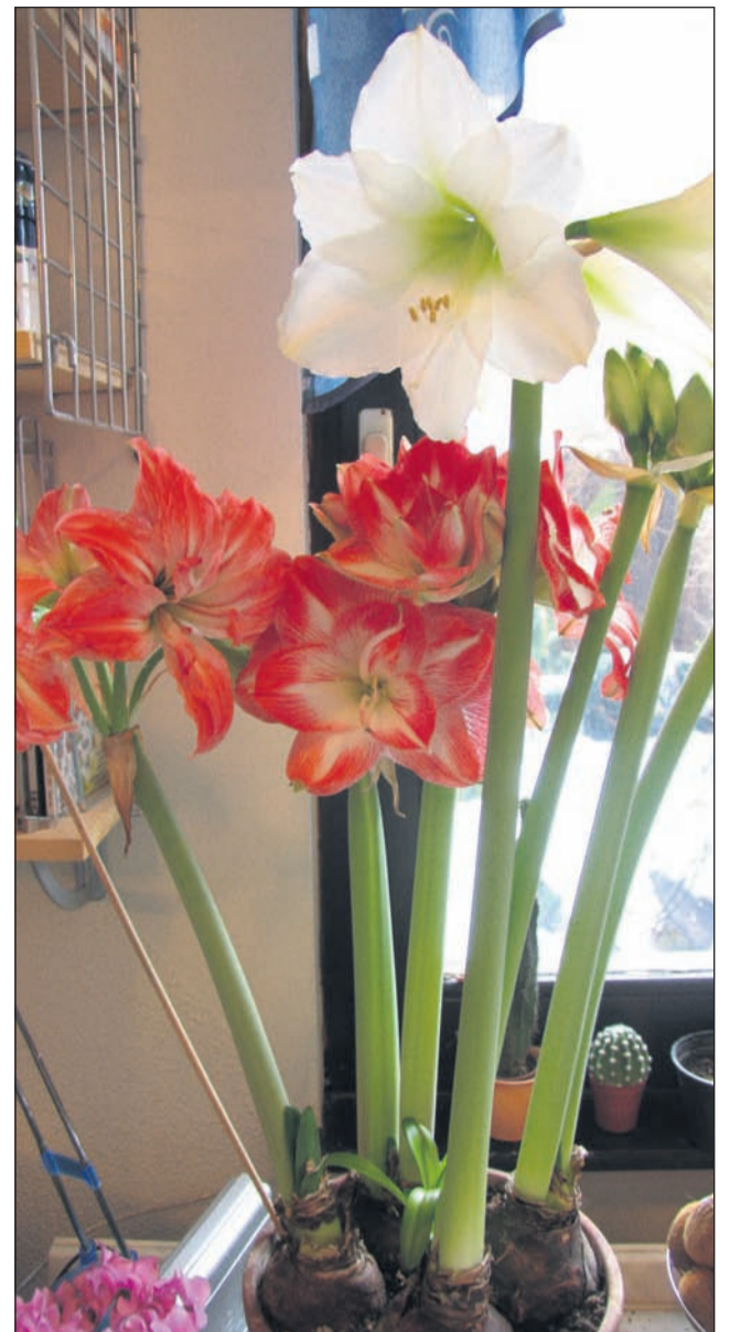
Za cvetenje vitezove zvezde se moramo potruditi zdaj.

Sicer sem recept že napisala, a ga ponavljam. Iz listov rabarbare naredimo brozgo. To naredimo tako, da po receptu predpisano količino zelišč 24 ur namakamo v vodi, nato pol ure prekuhamo na počasnem ognju, ohladimo in precedimo. Pri rabarbari potrebujemo 1 kg svežih listov za 5 litrov vode. Liste z rokami raztrgamo. Voda naj bo postana ali iz domačega vodnjaka ali potoka. Brozgo pa naredimo