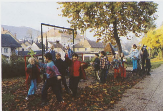
Lep jesenski dan je izvalil iz učilnic tudi trebanjske prvošolke, da so preizkusili svoje vetrnice.