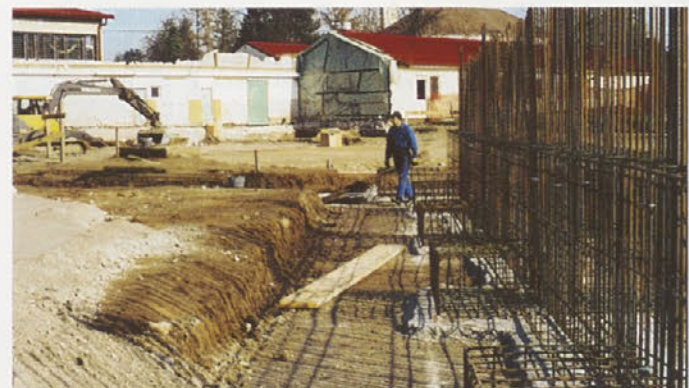
Novi trakt šole in telovadnice na Mirni se že driguje iz temeljev.