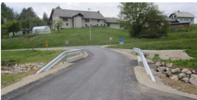
Po gradnji mostu in rekonstrukciji vozišča v Tuštanju, urejeni brežini in postavljeni ograji, je na tem mestu položen asfalt.