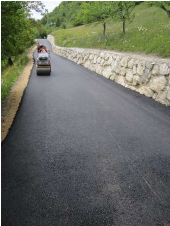
Na v prejšnjih letih rekonstruirani cesti od Velike vasi proti Križevski vasi v dolžini cca 300m je položen asfalt.