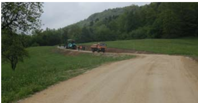
Na cesti v Sp. Dobravi je asfaltiran rekonstruirani del ceste. Cesta je sedaj skoraj v celotni dolžini med domačijo Polnsnik in Drtijo asfaltirana. Na krajšem odseku je pred asfaltiranjem potrebno rešiti lastništvo zemljišča.