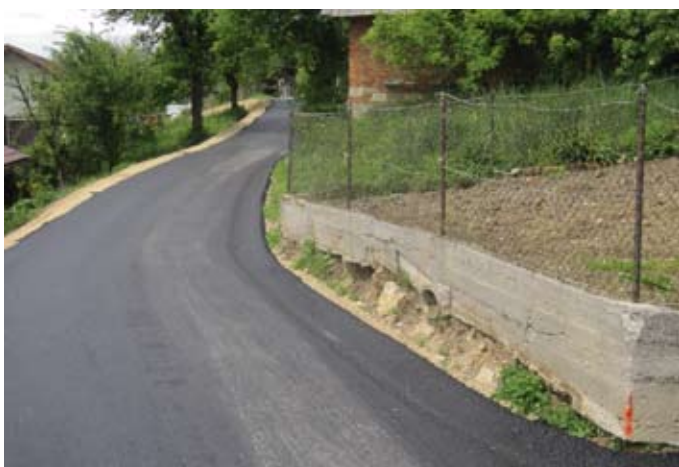
Na v pretekli jeseni rekonstruiranem cestišču v Soteski je bil položen asfalt.