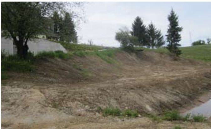
Na zemljišču ob novem vrtcu, ki ga občina odkupuje z namen gradnje šolskega igrišča, je odstranjena vsa podrast, očiščene pa so tudi navožene smeti.