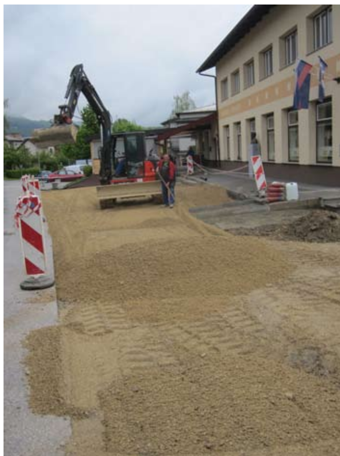
Na parkirišču pred knjižnico Daneta Zajca v Moravčah so odstranjene betonske cevi, ki so motile parkiranje in sam izgled. Urejeno je odvodnjavanje nastreška in položen nov asfalt.