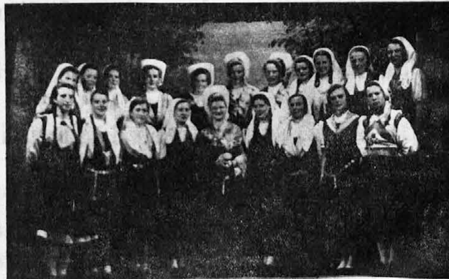
Slovenske koroške pevke v Gorici

Vseučilišče sv. Tomaža izdaja vse polno publikacij v angleškem in španskem jeziku. Njeno učiteljske zapusti vsako leto okoli 400 diplomiranih učiteljev, ki dobijo službo v vladnih šolah. Večina zdravnikov, ki vršijo svoj poklic na Filipinih, je prejelo svojo izobrazbo na vseučilišču sv. Tomaža v Manili in isto bi lahko rekli o vseh ostalih važnih poklicih, tako da lahko brez vsakega pretiravanja trdimo, da je kulturna zgodovina Filipinov tesno združena s zgodovino tega vseučilišča, ki je bilo do leta 1898, edino središče višje izobrazbe za Filipince in ki je tudi dandanes mogočen svetilnik, ki razširja daleč naokoli luč krščanske resnice in kulture.