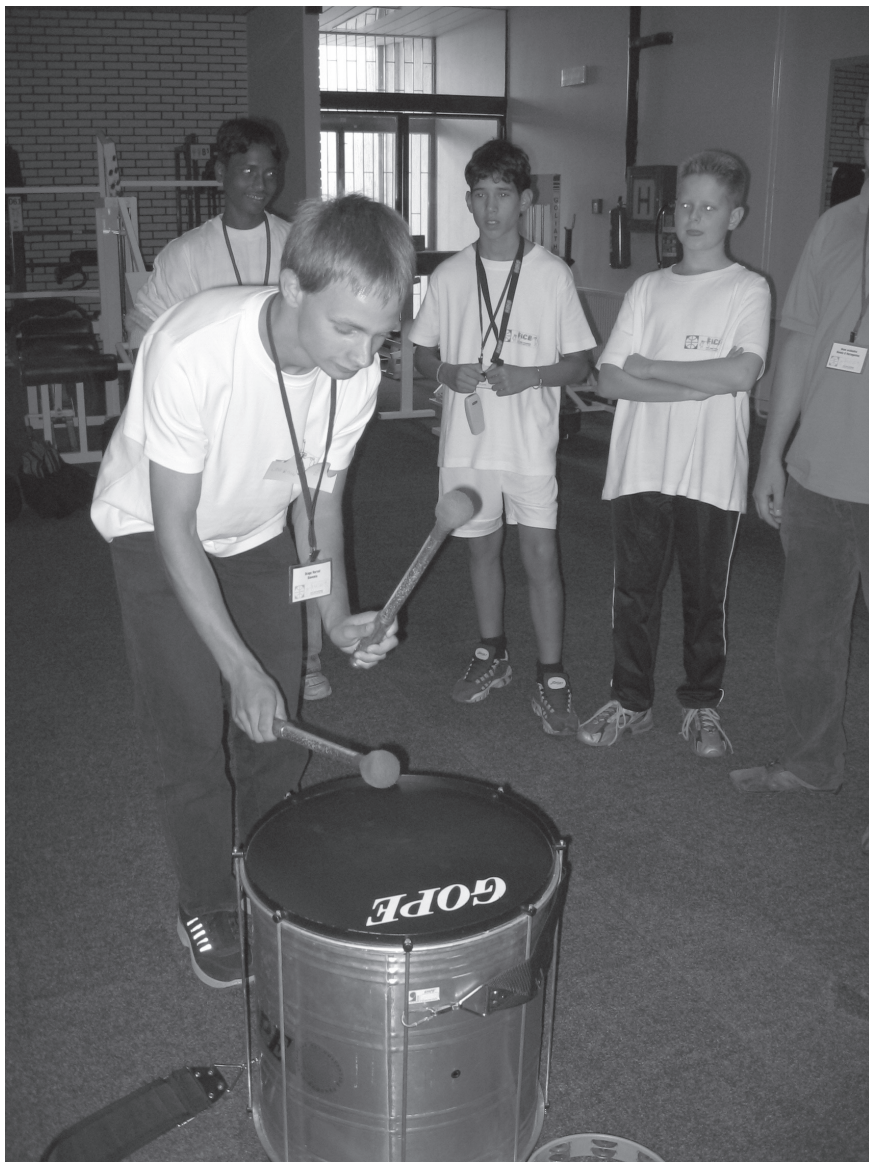
Slika 4: Delavnica Ritem.

Poiskati edinstven način izražanja čustev in misli s pomočjo barv, je bil cilj delavnice »Barve in oblike«. Udeleženci so morali narisati svojih trenutnih pet misli in napisati kako se počutijo, kaj si želijo