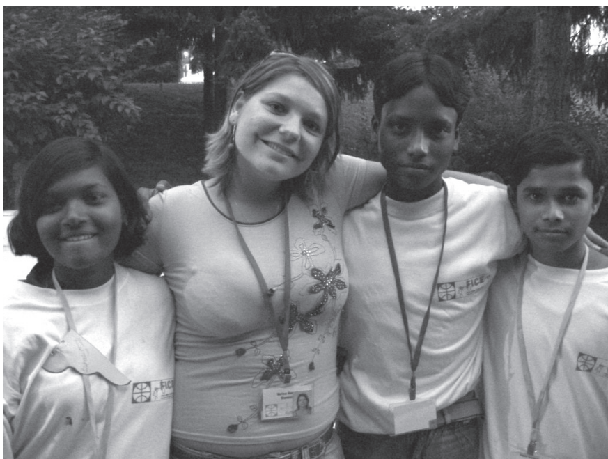
Slika 6: Druženje

Na kongresu smo sprejeli deklaracijo, imenovano »FICE deklaracija – Sarajevo 2006«, ki vsebuje šest členov: