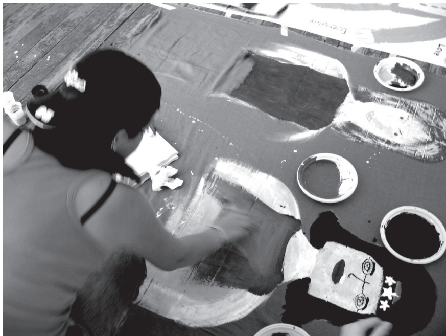
Slika 5: Izražanje z barvami in oblikami

Vsi udeleženci kongresa so dobili izvod časopisa, ki je nastajal v novinarski delavnici, kjer so se mladi seznanili z metodami poročanja. Posebno pozornost so namenili fotografiji.