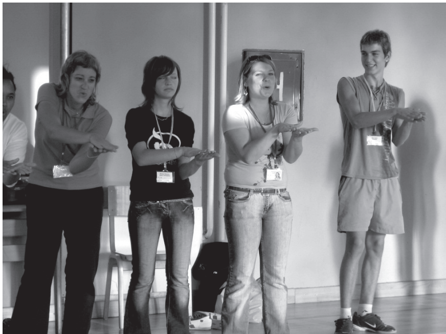
Slika 3: Aplavz, kot ga poznajo v Južni Afriki.

Da je lahko ples dobro izrazno sredstvo, so ugotavljali udeleženci »Plesne delavnice«. V delavnici »Impro gledališče« so mladi govorili o tem, kaj mislijo in radi počnejo s pomočjo improvizirane igre: