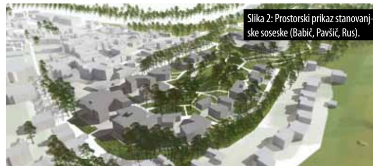
Slika 2: Prostorski prikaz stanovanjske soseske (Babič, Pavšič, Rus).