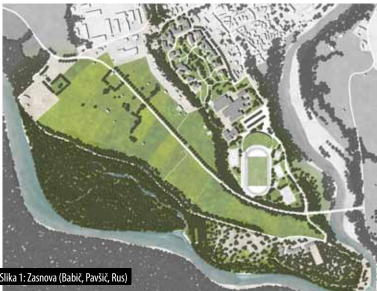
Slika 1: Zasnova (Babič, Pavšič, Rus)