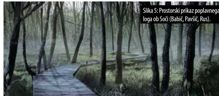
Slika 5: Prostorski prikaz poplavnega loga ob Soči (Babič, Pavšič, Rus).

Students were dealing with the spatial development of the southern part of Tolmin between old historical centre and river Soča. One of the goals was also to examine the possibility of replacing locations between the planned residential area and existing sports park Brajda. Furthermore, suggested spatial solutions should still allow organization of mass music festivals on Soča riverbanks. Students based their design solutions on different concepts. Some ideas for design concepts were based on river Soča natural surroundings, others derived from historical events of Isonzo Front.