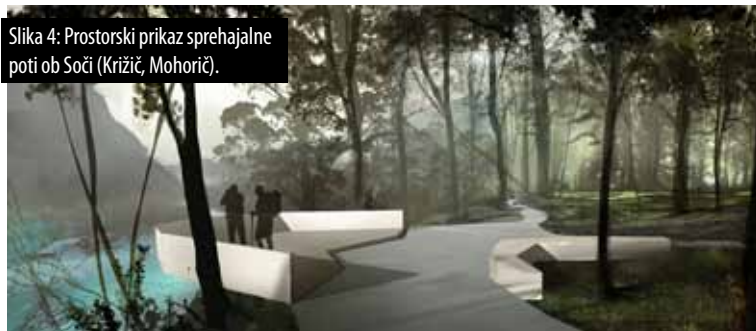
Slika 4: Prostorski prikaz sprehajalne poti ob Soči (Križič, Mohorič).

Soseska bi se na lokaciji obstoječega športnega parka bolj navezovala na samo mesto tako z vidika povezave mestnih funkcij kot z vidika boljše umeščenosti stavbnega fonda znotraj mestnega jedra. Na robu mesta bi bile mestne funkcije od soseske preveč oddaljene, do konfliktov pa bi prihajalo tudi v času festivalov. Športni park bi se z lokacijo južno od šole bolj navezoval na odprte in zelene površine na Sotočju, ki že imajo rekreacijsko funkcijo. Nova lokacija športnega parka bi omogočala umestitev več različnih programov, ki so se na podlagi ankete med prebivalci, ki so jo opravili študenti, izkazali kot potrebni (na primer pokriti bazen, lokal itd.).