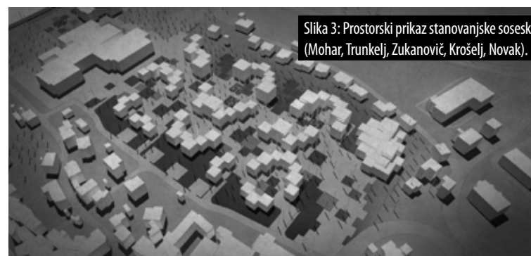
Slika 3: Prostorski prikaz stanovanjske soseske (Mohar, Trunkelj, Zukanovič, Krošelj, Novak).

Študenti so pri svojih zasnovah oblikovali različne koncepte. Nekateri so kot izhodišče svoje zasnove upoštevali naravo, ki je značilna za reko Sočo in njeno neposredno okolico, drugi so izhajali iz zgodovinskih značilnosti iz obdobja Soške fronte, kot izhodišče pa je bilo obravnavana tudi poplavna ogroženost.