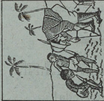
Poglejtu v tole točko lomu mirtli