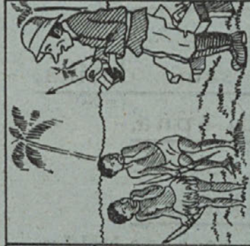
Pobojtu, da vojo naučim streljati