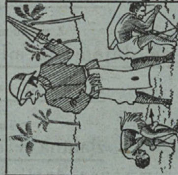
Ena, dve, tri.