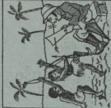
Hop - sredi nasa