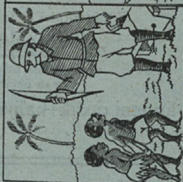
Lakole streljam jaz; poskusajtu