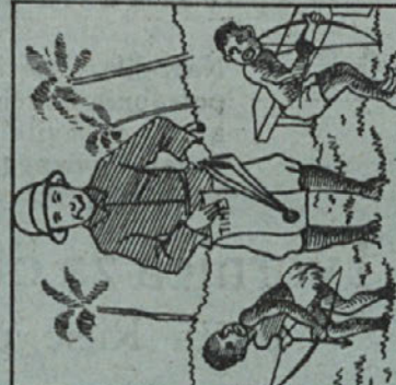
Divna stvar: torej požkustisu