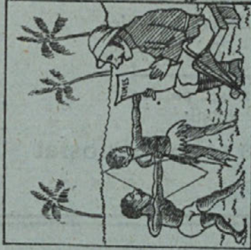
Dajva tega zvitriga Angleža