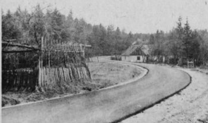
Asfaltna prevleka je naredila vznožje bistriškega Pohorja še privlačnejšega, njegovim prebivalcem pa lepšo vsakdanjost.