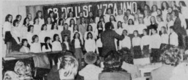
Mladinski pevski zbor iz Slov. Bistrice na enem zadnjih nastopov.