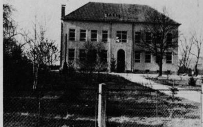
Prenovljena osnovna šola v Laporju je zopet ponos kraja.