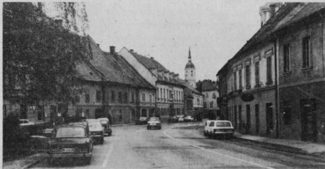
Središče Slovenske Bistrice.