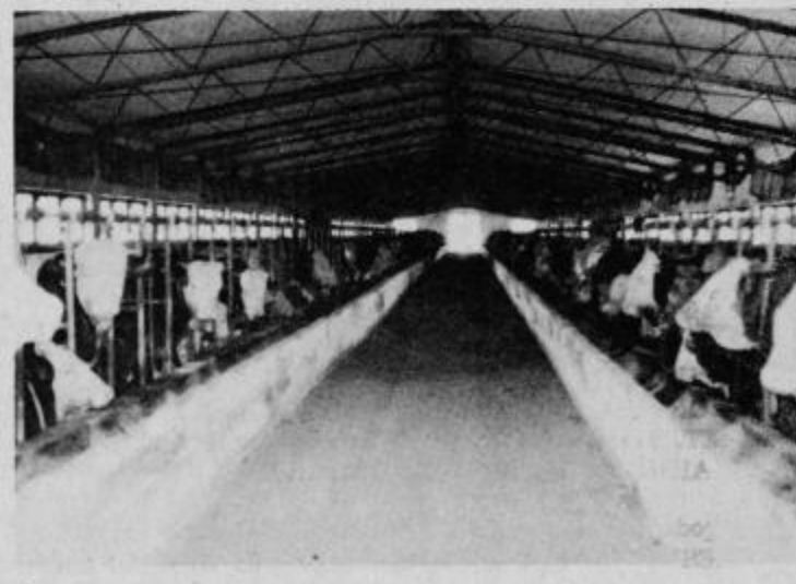
Živina prinaša izgubo — če seveda nimaš lastne klavnice.