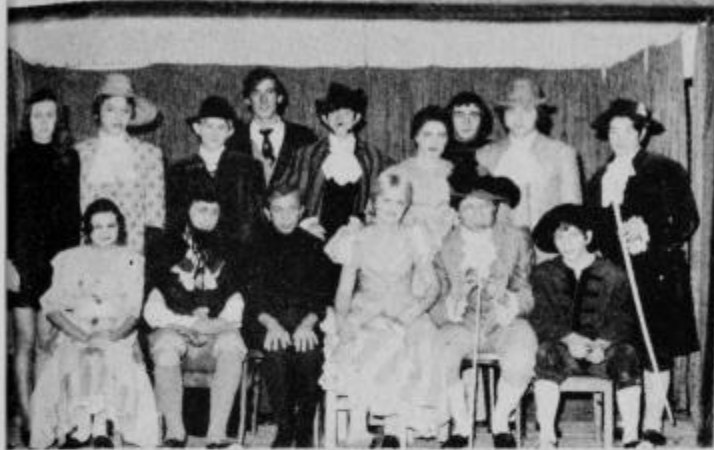
Dramska skupina s Sel ob uprizoritvi „Zdravnika po sili“.