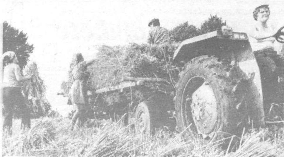
ŽETEV JE »PRESTAVILO« VREME - Kruha bomo imeli dovolj, če si ga bomo sami »sejali«.