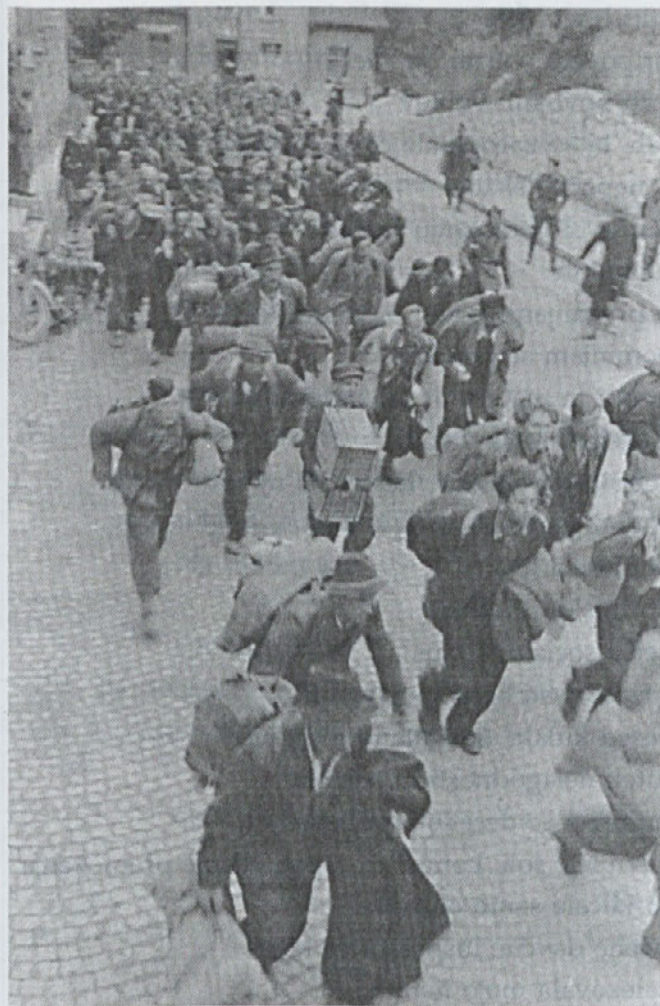
Vračanja Maj 1945 - Kranj

Vi mučenci naši, naš ponos in bolečina naša, ki ste v bližini Božji, izprosile našemu narodu mir, pošteno spravo in sožitje, da bomo končno spet složna slovenska družina in bo ta raj pod Triglavom sveta zemlja posvečenih grobov, kjer bo zrastle nova mladina za novo lepšo Slovenijo.