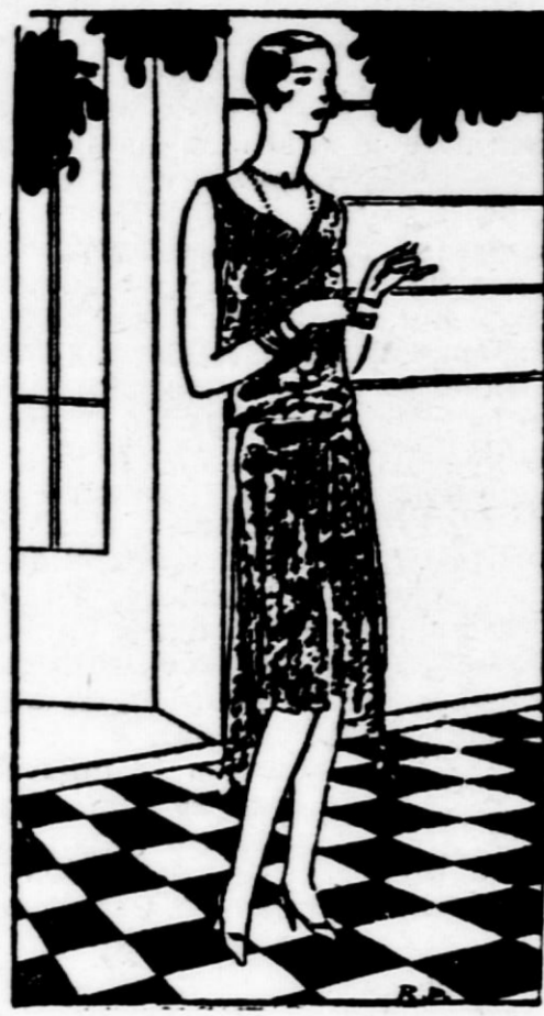
Velika in mala večerna toaleta za zimsko sezono