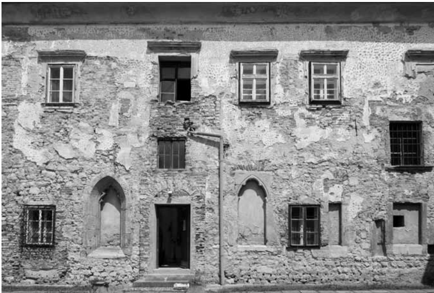
Slika 2: Ptuj, dominikanski samostan, fasada južnega trakta pred zadnjo prenovno

nost posameznih prostorov. 8 Pri sami izvedbi pa je bila kot vsak celovit poseg tudi ta obnova deljena na dva dela, najprej priprava projektne dokumentacije z vsemi potrebnimi predhodnimi raziskavami in nato sama izvedba. Finančno se je zdelo, da bosta oba dela v celoti pokrita, zlasti ker se je investitor zanašal na sklep tedanje vlade o sofinanciranju projekta za konservatorsko-restavratorska dela v višini do okoli 2.100.000,00 evrov. Dejansko so bile predhodne raziskave v celoti finančno pokrite, rezultat tega pa sta bila izdelan konservatorski načrt s konservatorsko-restavratorskim projektom ter izvedba arheološki raziskav. A se je kasneje izkazalo, da bo zlasti za arheološka poizkopavalna dela in konservatorsko-restavratorske posege zmanjkala najmanj tretjina sredstev (okoli 700.000 evrov). To pa je dejstvo, ki bo v veliki meri vplivalo tako na funkcionalno kot na estetsko pojavnost spomenika, saj obnova ne bo zaključena niti v najnujnejšem obsegu. A več o tem v nadaljevanju.