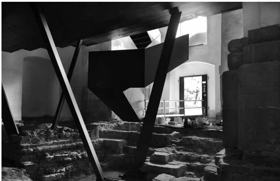
Slika 6: Ptuj, dominikanski samostan, kovinsko stopnišče v vzhodnem delu cerkve z delno prezentacijo arheoloških najdb pod tribuno

lokoma in da bo z izvedbo načrtovanih stopnic v veliki meri zakrit del zahodnega gotskega slavoloka s poslikavo. Zato je ZVKDS predlagal, da se izvedbo požarnih stopnic oziroma požarnega izhoda iz dvorane načrtuje sredi severne stene ladje ob vznožju tribune, kjer se je do nedavna nahajal eden od vhodov v cerkev, ki je sedaj sicer z zadnjimi posegi zazidan, a gre že za degradiran del stene cerkve. ZVKDS je tudi navedel, v kolikor predlagana rešitev zaradi predpisov požarne varnosti ne bi bila sprejemljiva, se požarni izhod lahko izvede tudi v severni steni ladje v vzhodnem delu tribune, kjer obstaja zazidan prehod, ki vodi v prvo nadstropje samostana. Nato je dodal, da je sicer možna tudi izvedba načrtovanega stopnišča na mestu predlagane lokacije, a mora biti stopnišče izvedeno tako, da oblika ali vrsta zaščitne ograje sledi principom maksimalne transparentnosti, s čimer vizualno ne bi zakrivala tolikšnega dela obravnavane prostornine. A se je v postopku usklajevanja s požarno inšpekcijo izkazalo, da nobena od predlaganih rešitev ni ustrezna, prehod v nadstropje samostana pa v tej fazi ni bil predmet gradbenega dovoljenja. Ker trenutno druge, manj radikalne rešitve ni bilo moč izvesti, je ZVKDS soglasje za izvedene stopnice izdal le začasno do izvedbe druge oziroma tretje faze prenove, da se prepreči morebitna gospodarska škoda, ki bi jo neizdanost soglasja in s tem ne pridobitev uporabnega dovoljenja povzročila.