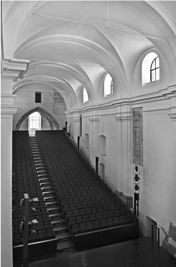
Slika 5: Ptuj, dominikanski samostan, novozgrajena tribuna za gledalce v cerkvi

Nato so bile izvedene obsežne arheološke raziskave, s katerimi so pričakovano prišle na dan izjemne najdbe (nagrobniki, grobnice), ki so zaradi svojega pomena in ohranjenosti takoj odprle vprašanje nujnosti njihove prezentacije in situ . Seveda so istočasno tekle tudi raziskave stavbne lupine, ki so poleg stenskih poslikav odkrile vrsto zazidanih stavbnih elementov, zlasti iz obdobja pozne romanike in gotike. Večina teh elementov je bila