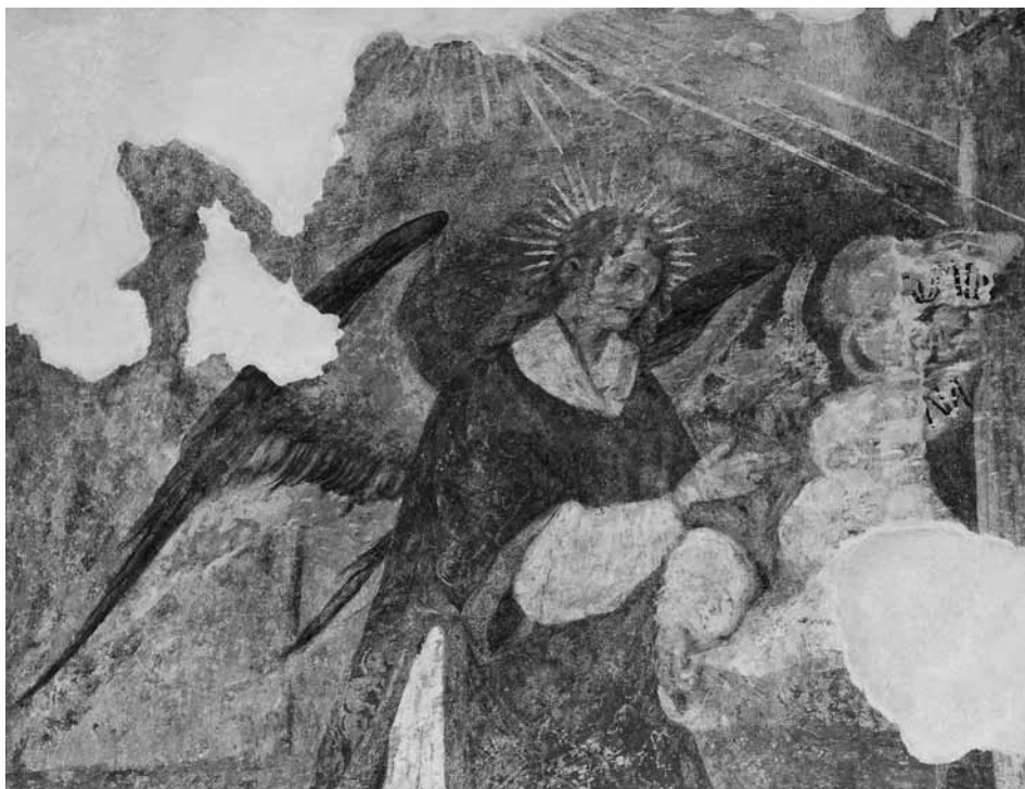
Slika 9: Ptuj, dominikanski samostan, angel s prizora Oznanjenja v križnem hodniku po restavriranju

restavratorski posegi zmanjšujejo zgodovinsko resnico o objektu in njegovi evoluciji. 33 Le male poškodbe, ki bi morebiti bile retuširane, so bile kitane do nivoja barvnih plasti. Teh je malo, več jih je le na prizoru Oznanjenja v križnem hodniku (slika 9) in heraldični upodobitvi na šilasto banjastem oboku v cerkvi.