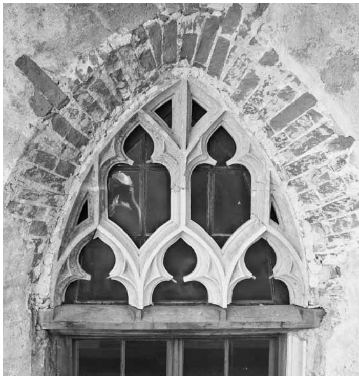
Slika 10: Ptuj, dominikanski samostan, krogovičje okna v severnem kraku križnega hodnika po čiščenju, ki je razkrilo obsežen restavratorski poseg iz 19. stoletja

Po drugi strani je glede tovrstnih odločitev in reševanja takšnih problemov moderna konservatorska teorija veliko bolj praktična. Zagovarja predvsem odločitve v okviru zdravega razuma. 36 V glavnem so bolj zaželeno previdne odločitve in premišljena akcija. In kaj je tu vodilo? Ne neka resnica ali znanost, ampak predvsem uporabnost, vrednost, vrednote in pomen, ki ga ima spomenik v družbi. 37 Zato cilj konservatorstva ni zgolj ohranitev objekta, ampak ohraniti in izboljšati pomen, ki ga ima spomenik v širšem družbenem kontekstu. Pri tovrstnih posegih ne gre toliko za vprašanje izvirnosti, temveč prej za potrebo po kontinuiteti in povezavi z zgodovino, njenimi procesi, potrebo, ki naj bi odražala tudi mnenje večine vpletenih. 38 V našem primeru so ravno ti momenti ključni, čeprav nam je v veliko pomoč že delno konservatorsko vrednotenje. Nobenega