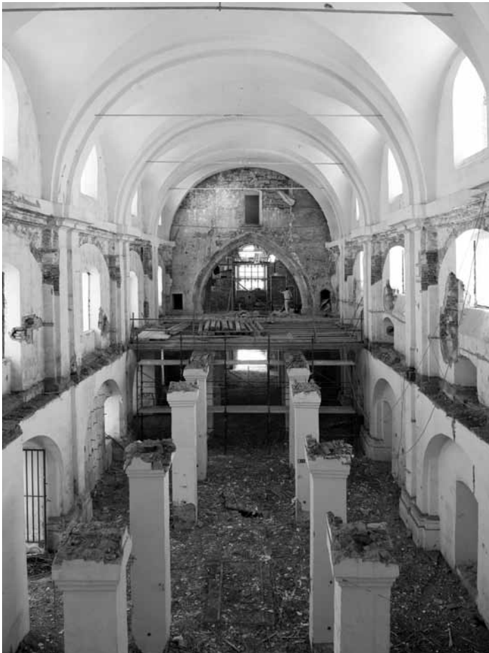
Slika 4: Ptuj, dominikanski samostan, pogled v notranjščino cerkve proti vzhodu med odstranjevanjem medetažne konstrukcije

sicer precej transparentno kritino, zahodno dvorišče urejeno s kaskadami v smislu amfiteatra, v cerkvi pa naj bi bila izvedena velika tribuna z več kot 500 sedeži ter balkonom, vpetim v gotsko slavoločno steno, baročna zakristija pa naj bi bila na zahtevo lastnika celo porušena. Poleg arhitekturnih posegov je bilo v cerkvi zaradi njene gradbeno-statične strukture, ki ne zadovoljuje ustrezne protipotresne varnosti, predvidena obsežna statična sanacija z namestitvijo velikanskih kovinskih vezi in drugimi ojačitvami cerkvenih sten. Večina teh kasneje ni bila izvedena, razen v cerkvi, ki je sicer z obnovo doživela največ sprememb glede na dejansko stanje. Najprej je bila izvedena rušitev etažne konstrukcije, s katero je bila dosežena prvotna prostornina (slika 4).