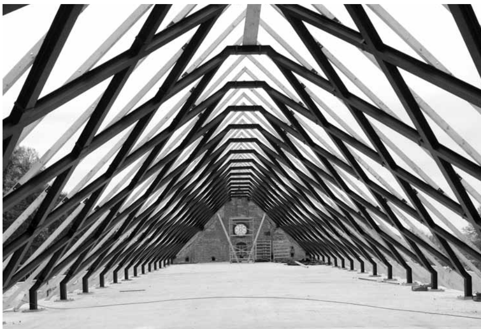
Slika 8: Ptuj, dominikanski samostan, nova kovinska strešna konstrukcija na AB-plošči ter statična rešitev čela vzhodne fasade

sredstev še ni bila izvedena. S pomočjo novega ostrejšja in AB-plošče je bilo statično utrjeno tudi vzhodno čelo cerkve. Utrditev je zajela točkovno sidranje dve kovinskih vezi oziroma podpor, izvedbo AB-venca v obstoječem utoru na zunanjem robu ter utrditev z novim kovinskim ostrešjem, medtem ko tokrat vbrizgavanje zaradi nestabilnih ometov s štukaturami ni bilo izvedeno (slika 8).