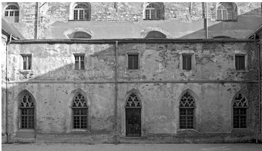
Slika 1: Ptuj, dominikanski samostan, zunanjščina severnega kraka križnega hodnika pred posegi; značilne poškodbe originalnih gotskih ometov in zidanih struktur zaradi stalnega zamakanja

zadnjih desetletjih propadale naprej, resda mogoče s počasnejšim tempom in zaradi različnih vzrokov (slika 1). 6