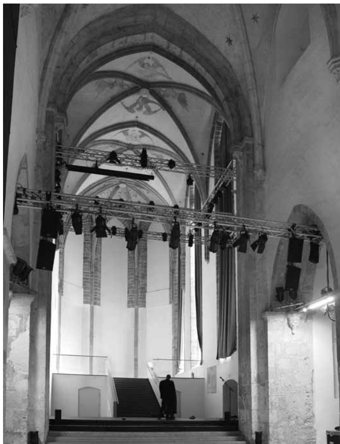
Slika 3: Stein an der Donau, cerkev nekdanjega minoritskega samostana, pogled v prezbiterij

Med sakralnimi objekti izstopajo posegi v notranjščini nekdanje cerkve minoritskega samostana v Steinu ob Donavi v Spodnji Avstriji (slika 3). Cerkev namreč služi kot prireditvena dvorana, zato so morali v prezbiteriju zgraditi poseben oder in namestiti konstrukcijo za sistem osvetljave, ki vsekakor precej krni poglede na gotski obočni sistem in poslikave.