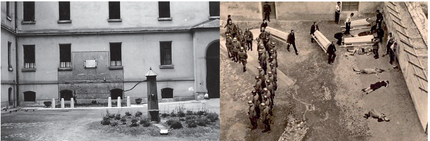
Sodni zapori v Mariboru.