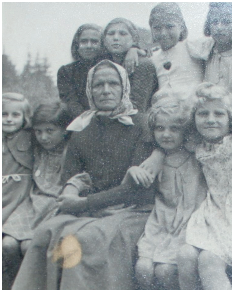
Jurjaševićeva babica z otroci.

Strah matere Rozinke Jurjašević, ki v pismu, 1 prosi moževe starše, naj rešijo njo in njene otroke, je bil upravičen. Vlak s celjske postaje jo je, kot mnoge druge, katerih fotografije so hranjene v zbirki,