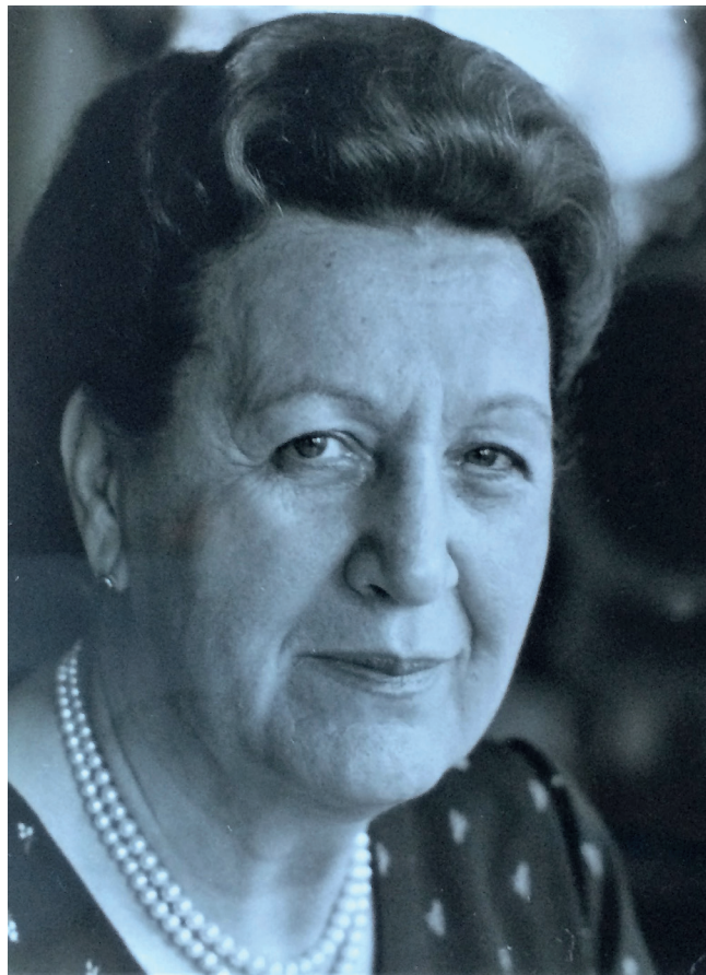
Slika 4: Portret Pepce Kardelj v povojnem obdobju