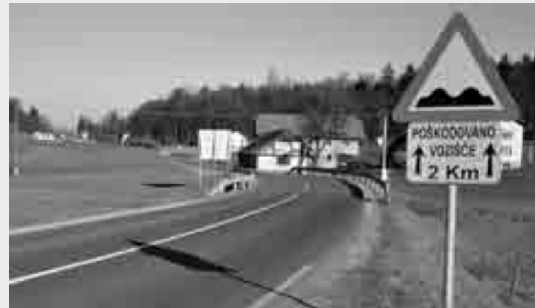
Aktualni projekti na državnih cestah v naši občini pa so še gradnja pločnika Krška vas-Gabrovčec, regionalna cesta Zagradec-Zvirče in iskanje rešitve za oblikovanje glavnega križišča za vstop v Šentvid.

V zvezi z omenjeno cesto Ivančna Gorica-Radohova vas se v bližnji priho- dnosti pričakuje ogled, po katerem bo morda kaj več znanega glede nujne obnove.