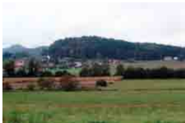
Pogled na mokronoško Tičnico in celotno »Lëblenco« s severovzhodne strani. Desno je malo manj vidna Tičnica, levo težje dostopno gradišče, nekako sredi med njima je gradiška pritiklina Konjska dolina, povsem v ozadju pa vzpetina Straža – sama stara, »gradiška« imena s slovensko zvočnostjo. Na podružnični cerkvi v Slepšku je tica (petelin).

Priče o slovenskem naravoverju v starem veku še naprej prihajajo na plano. Eno izmed novih dokazil je tudi Tičnica pri Mokronogu, torej v naši ne preveč oddaljeni okolici. Nekdanja sestavina gradiške skupnosti leži zahodno od Mokronoga, točneje nad vasema Slepšek in Beli Grič. Vzpetina v vseh pogledih ustreza doslej odkritim duhovnim postojankam iz davnine: obla in ne preveč visoka vzpetina, nenaseljena, porasla z gozdom in obdana z drugimi staroveškimi pritliklinami. Ima pa tudi nekaj posebnosti. Tičnica, na primer, je povsem blizu gradišča, ki je sorazmerno majhno, ima pa dobro hranjene okope. Po nekaterih znamenjih bi sodil, da je bila prvotna utrdba širša in da je vključevala tudi Tičnico, kar se v drugih primerih večinoma ni dalo slutiti. Nekateri pisani viri Tičnico pri Mokronogu imenujejo tudi Božji grob, kar dodatno potrjuje, da gre za starosvetno duhovno postojanko. V širši okolici sta še dve vzpetini s starodavnimi imenoma: Straža in Roje. Pomen Roj je v okviru gradiške infrastrukture še dokaj nejasen in bi ga bilo treba temeljiteje raziskati.