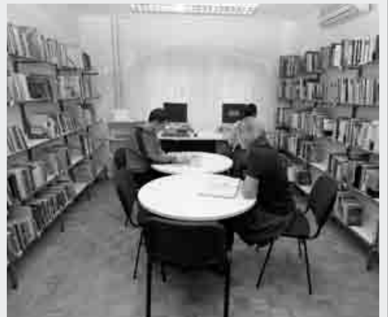
V čitalnici lahko preberete sveže novice, prelistate revije, v sobi pa je tudi literatura za duhovno rast. Tukaj sta dve računalniški mesti.

V knjižnici bosta spomladi potekali tudi dve ustvarjalni delavnici na temo Knjižne kazalke. Že malčke učimo, kako se na knjige pazi in kako nam pri tem pomagajo knjižne kazalke. Tokrat jih bodo otroci lahko izdelali sami. Na voljo bodo različni materiali, kreativni pa bomo z oblikovalko Katjo Adamlje. Prijavnice dobite v knjižnici.