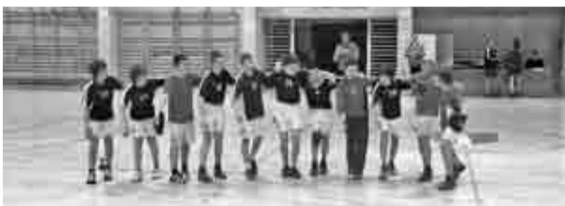
Veselsej starejših dečkov B po zmagi nad Črnomljem in najboljši predstavi v letošnji sezoni.

V januarju so bili zelo aktivni mladinci, odigrali so že dve prvenstveni tekmi