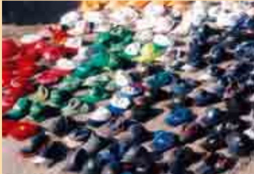
Kape brez možganske podlage.