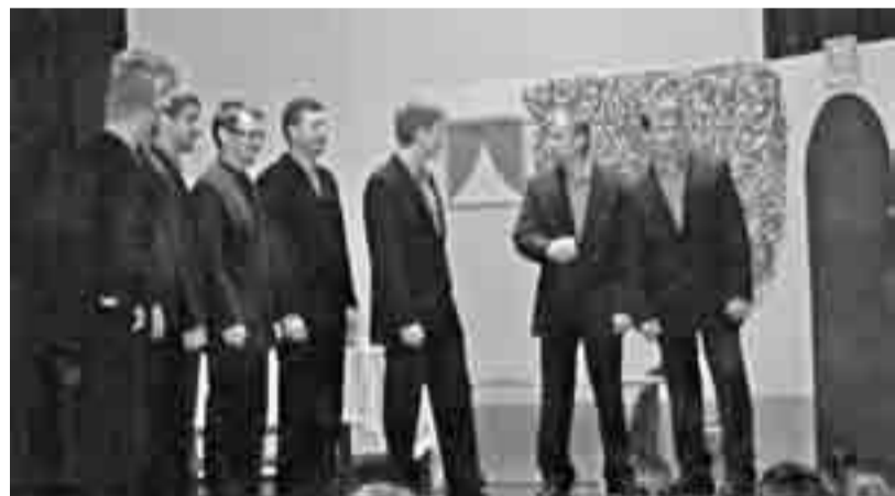
Fantje pojejo podoknico