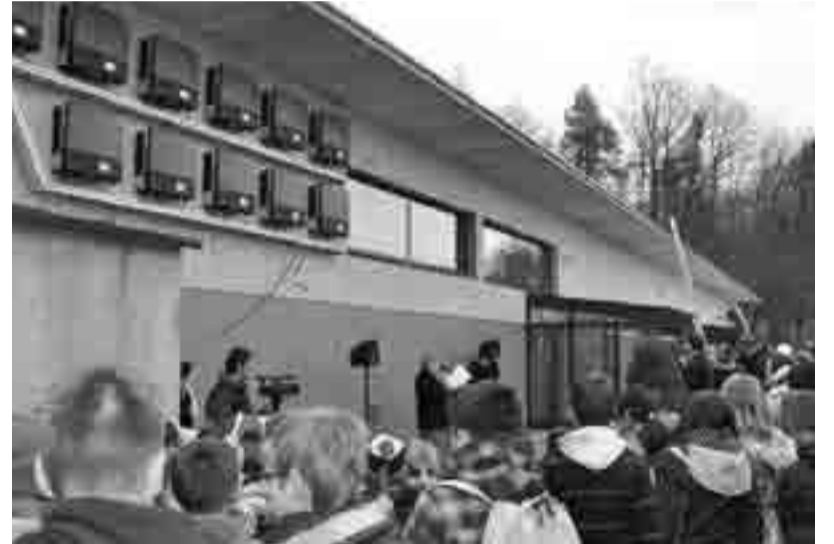
Druga največja sončna elektrarna na strehah osnovnih šol v Sloveniji