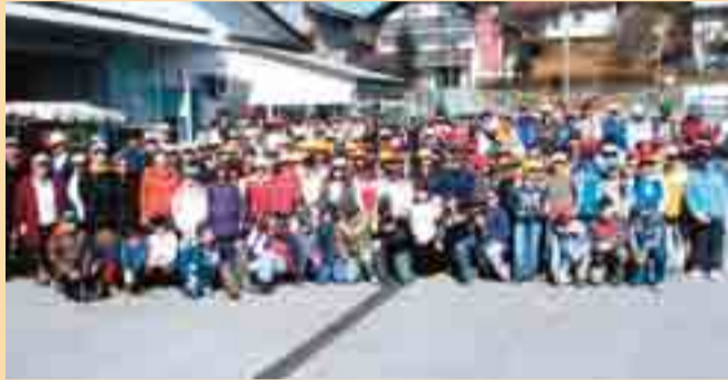
Rekordna kolekcija na glavah šestošolcev. Ostrovidni lahko rekorderja poiščete med množico.