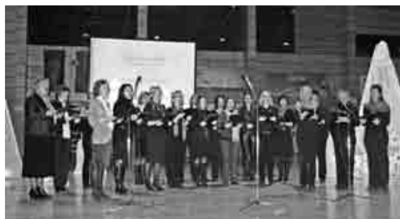
Ženski učiteljski zbor OŠ Stična

predsednica upravnega odbora Šolskega sklada