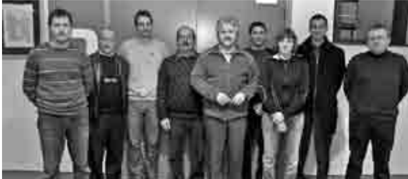
Novo vodstvo ZŠO Ivančna Gorica