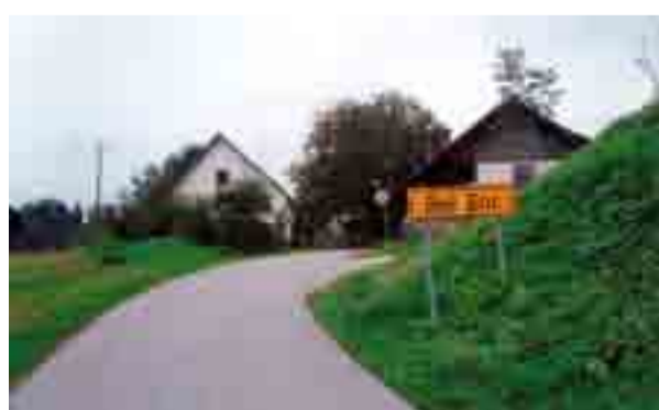
Vas Beli Grič, prej Sveti Križ – nekdanja Bela Ljubljana (narečno Lëblënc), pod istoimensko vzpetino (desno). Kraji s starodavnimi poduhovljenimi imeni imajo zaradi »sumljivega« izvora spremenljivo imensko izrazje.

Posebnost te razpotegnjene dvoglave vzpetine je nadvse zanimivo nekdanje ime Bela leblanca in po njej poimenovana vas Bela Leblanca. Ime je vredno pozornosti zategadelj, ker neposredno potrjuje nastanek imena Ljubljana (dolenjsko narečno Leblena), ki imensko prav tako temelji na lebastih, krušnim (h)lebom podobnih vzpetinah. Da gre za etimološko homologna izraza, potrjuje tudi sedanje ime Bela Ljubljana, ki ga nosi naše stolno mesto. Celo več: v narodni pesmi je prav tako imenovana s pomanjševalnico (Stoji, stoji Ljubljana ...). Beseda »bela« je dodana še nekaterim drugim oronimom in toponimom na Slovenskem in ni povsem pomensko razvozšana. Vsekakor bi bilo treba imetnike tega pridevnika obiskati v naravi in na podlagi skupnih potez utrditi pomen in izhodišče.