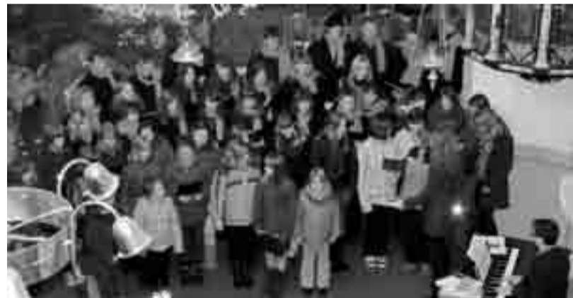
Skupna pesem pred jaslicami

Sobotni večer je bil tako napolnjen s pesmijo, obiskovalci pa so odhajali vedrih obrazov, saj so jih pevci v dobri urici popeljali v čarobnost božiča.