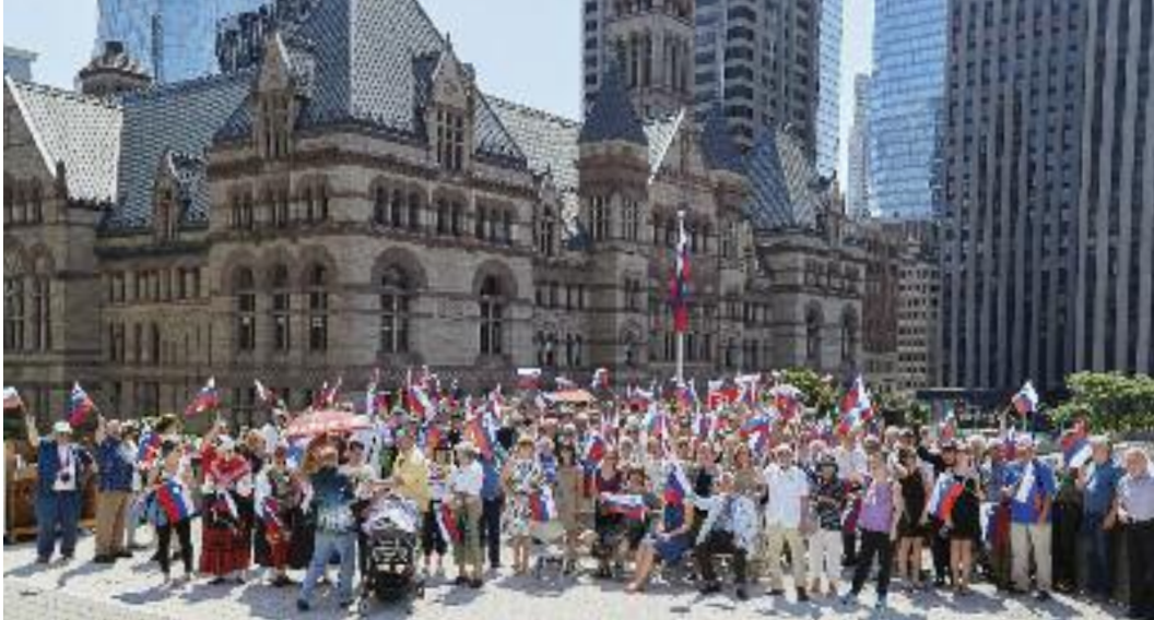
Dvig slovenske zastave na občini Toronto

Nedelja, 26. junij: Piknik na Holiday Gardens. Srečanje tudi pri sveti maši. Igral je Spotlight Orchestra.