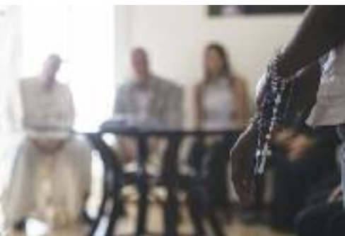
V Skupnosti papeža Janeza XIII.