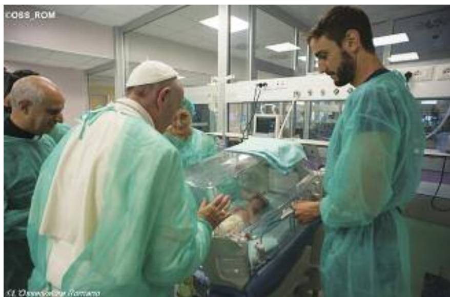
Papež Frančišek v bolnišnici sv. Janeza

Papež Frančišek je 12. avgusta v okviru 'Petkov usmiljenja' obiskal eno od rimskih zgradb 'Skupnosti papeža Janeza XXIII.', ki jo je ustanovil don Oreste Benzi ter se srečal z 20 ženskami osvobojenimi suženjstva prostitucije. Šest jih prihaja iz Romunije, 4 iz Albanije, 7 iz Nigerije ter ostale tri iz Tunizije, Italije in Ukrajine. Povprečna starost prebivalk inštitucije je okoli 30 let. Vse so