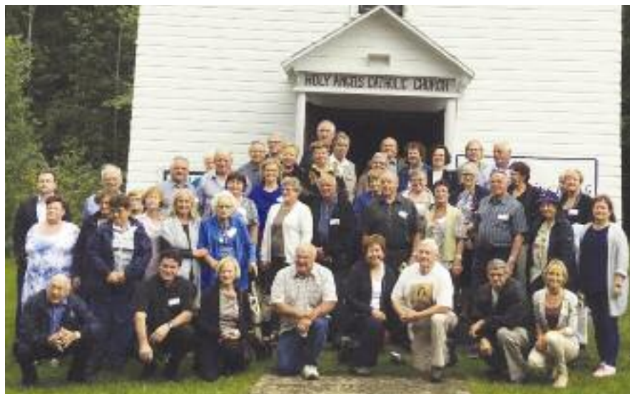
Skupinska slika ped cerkvoijo Svetih angelov