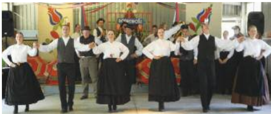
Kulturno umetniško društvo Študent iz Maribora

To, da se trudimo razločevati in videti, kaj je dobro in to spremljati, kar pomeni delati, se vključujemo v delo usmiljenja. Tako moremo kot člani slovenske in verske skupnosti lažje in uspešneje delovati v Jezusovem duhu in po njegovem zgledu za dobro vsakega človeka, za dobro skupnosti in za dobro sveta, v katerem živimo.