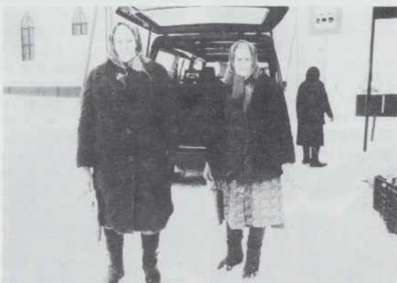
AUTO VSAKŠO PODNE OBED PRIPELA ZA STAREJŠE

poslala pejneze, aj mauži, tam dej je spadno, postavijo cirkev. Dapa cirkev so prej nej tam postavili,