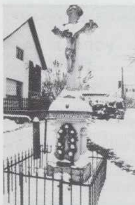
KRIŽ NA SREJDA VASI

Prvo katoličko šaulo so v vesi zozidali 1911. lejta. Vsi mlajši so doma v šaulo