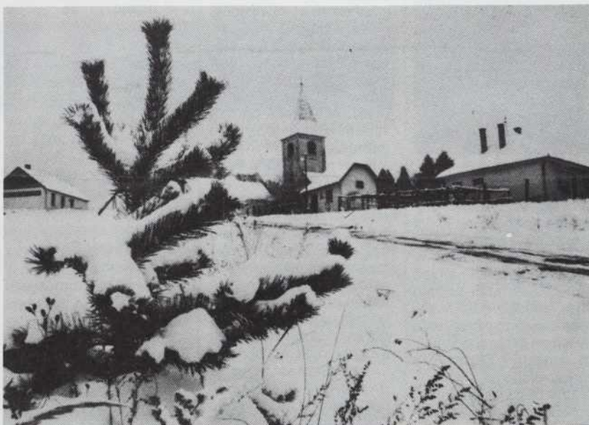
Zasnežena porabska pokrajina

in Madžarske Andrzej Olechowski in Géza Jenesszky pa sta dejala, da si prizadevata za čimprejšnji sprejem sporazumov o svobodni trgovini s Slovenijo. Poljska je napovedala, da bo prihodnje leto odprla v Ljubljani veleposlaništvo. O čem vse se je slovenski zunanji minister pogovarjal z madžarskim vodjem diplomacije, nam ni povedal.