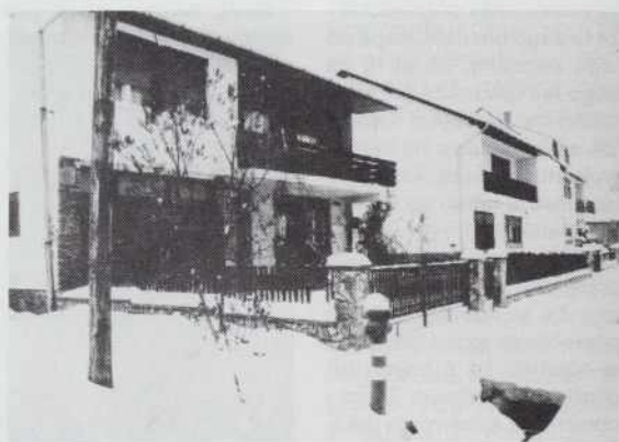
NAUVI RAMI PRI PAUTI

starejši vejo. V vesi nejga nikše prilike za delo, zatok skurok vsi,