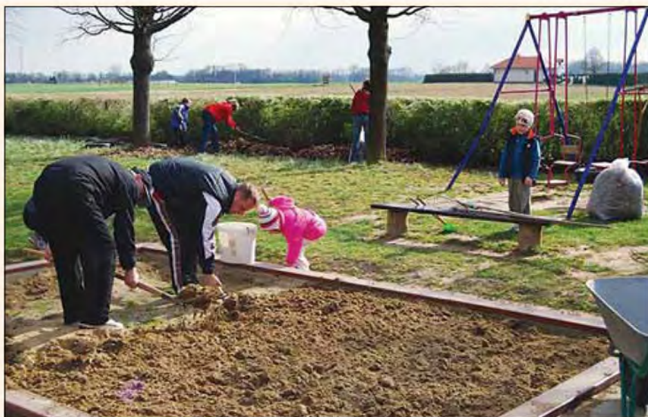
S skupnimi močmi je viden rezultat.

Po končanem delu pa smo si privoščili malico in se še nekaj časa prijetno dru-