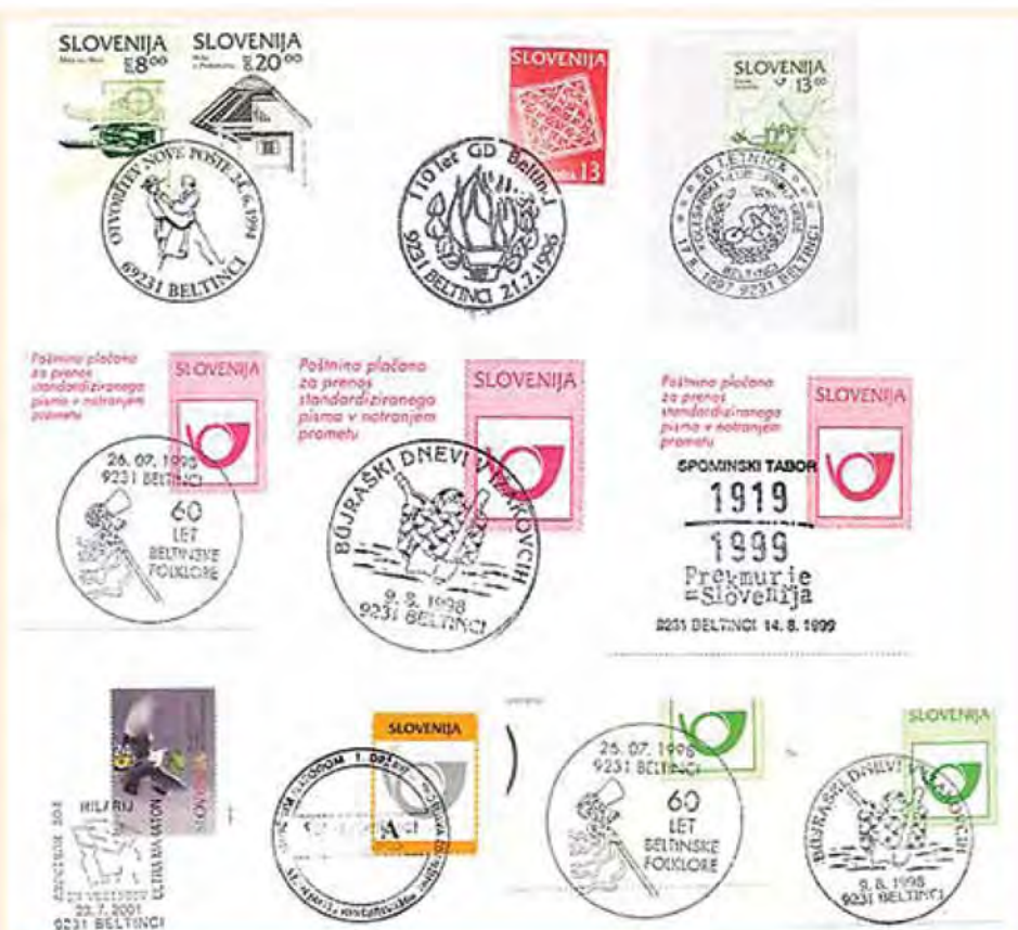
Vir: Slovenika 2003 – Katalog poštne žigov 1919-2003, lastna zbirka

Prvi priložnostni žig je bil izdan ob otvoritvi nove pošte v Beltincih, 24.06.1994. Sledili so še: 110 let GD Beltinci – 21.07.1996, 50 let kolesarskega kluba v Beltincih – 17.08.1997, 60 let beltinske folklores – 26.07.1998, Bujraški dnevi v Ižakovcih – 09.08.1998, Spominski tabor 1919-1999 Prekmurje – Slovenija v Beltincih – 14.08.1999, Ultra maraton po poti kurirjev in vezistov nove Slovenije, ki se začne v Gančanih – 23.7.2001 ter državna proslava združitve prekmurskih Slovencev z matičnim narodom – 18.08.2006 v Beltincih.