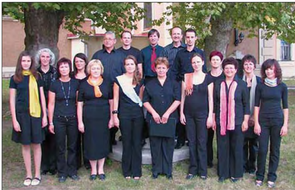
Člani MePZ sv. Ladislava pred župnijsko cerkvijo.

Kot vsaka druga organizirana skupina smo tudi mi v mesecu juniju pripravili piknik in se ob petju, glasbi ter dobri hrani sprostiti, nasmejali, razvedrili in poklepotali. Potem pa so tudi za nas prišle zaslužene počitnice.