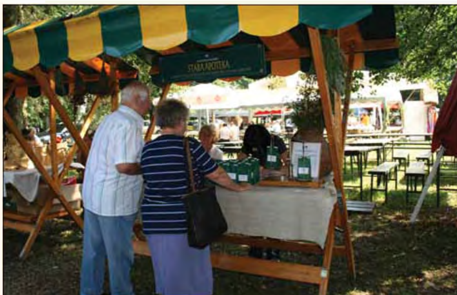
Stojnica Stara apoteka na folklornem festivalu

Prvi poskusi so bili narejeni v okviru Beltinskega folklornega festivala pod okri-