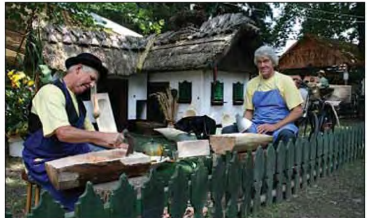
Utrinek iz folklornega festivala