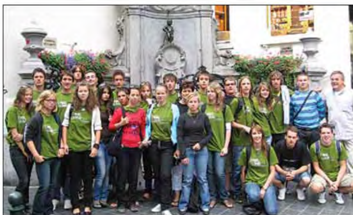
Folklorniki skupaj z manekenom Pisom