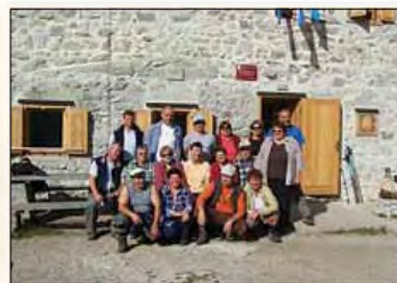
Utrinki iz prijetnih družen: Molička pl.-Korošica-Lučki dedec-Ojstrica, 2008

Strelsko društvo v Gančanih deluje že več kot 30 let. Strelja se večinoma z zračno puško na strelišču v ŠRC v Gančanih. Pred nekaj leti so starejši strelci prenehali s streljanjem, zato aktivno streljajo le še mladi strelci. Z zračno puško se strelja zelo aktivno, saj prihajajo strelci tudi z drugih vasi občine Beltinci. V jesenski in spomladanski sezoni smo tekmovali v naslednjih ligah: regijska pinorska liga, kadetska državna liga s standardno zračno puško, članska regijska liga s standardno zračno puško, članska regijska liga s serijsko zračno puško, državna dopisna liga za pionirje, kadete in mladince. Udeležili smo se tudi državnega kadetskega in pionirskega prvenstva. Dose-