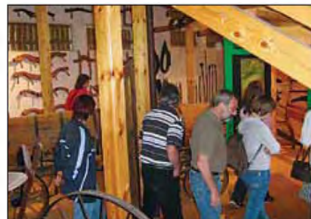
Muzej v Libeličah.

V mesecu juniju smo člani TD "SODAR" iz Gančanov organizirali ekskurzijo po Koroškem. Obiskali smo Libeliče in si ogledali njene znamenitosti (kostnica, cerkev, muzej o plebiscitu in muzej orodja, s katerim se je v preteklosti delalo na kmetijah). Tudi mi želimo imeti muzej starega orodja za pridelavo koruze, zato smo si njihov muzej še posebej dobro ogledali. Pot nas je vodila naprej v Legen (muzej prve kategorije). V Slovenj Gradcu smo si ogledali renesančno cerkev in ureditev mestnega jedra. V ekskurzijo smo zajeli tudi ogled rojstne hiše slovenskega pisatelja Prežihovega Voranca. Ob Iverčkem jezeru smo si pretegnili noge in napolnili pljuča s svežim planinskim zrakom. Naša pot se je zaključila ob Velenjskem jezeru.