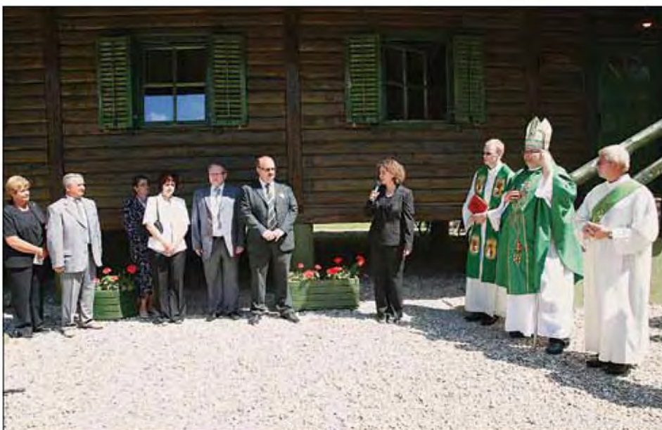
Utrinki iz odprtja razstave.

V programu ob odprtju razstave je »Brežno hišo« in zavetnika mlinarjev,