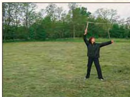
Pokanje z bičem.