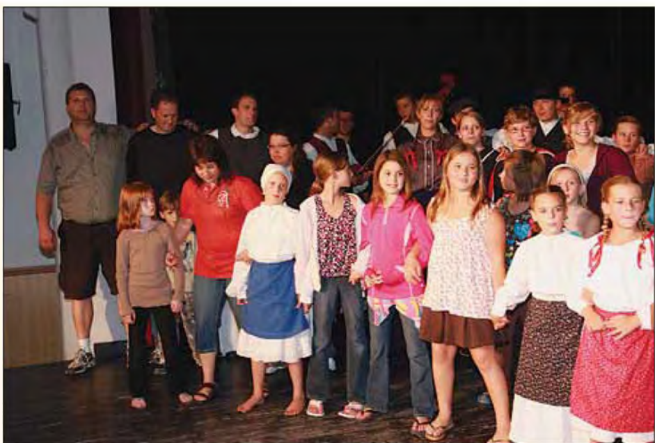
Srečanje prijateljev v kulturnem domu

Začelo se je (naše prijateljevanje in sodelovanje) leta 2000, ko so bili mladi folklorniki OŠ Beltinci tudi v počitniškem času pripravljene z veseljem nastopiti za člane slovenske šole iz Hamiltona in jim skušali na samosvoj simpatičen način približati izročilo njihovih babic in dedkov, ki so zapustili domovino ...in po kateri mnogi še vedno hrepenijo in je ne bodo nikoli pozabili. Naše prijateljevanje se je nadaljevalo in poglobilo leta 2004,