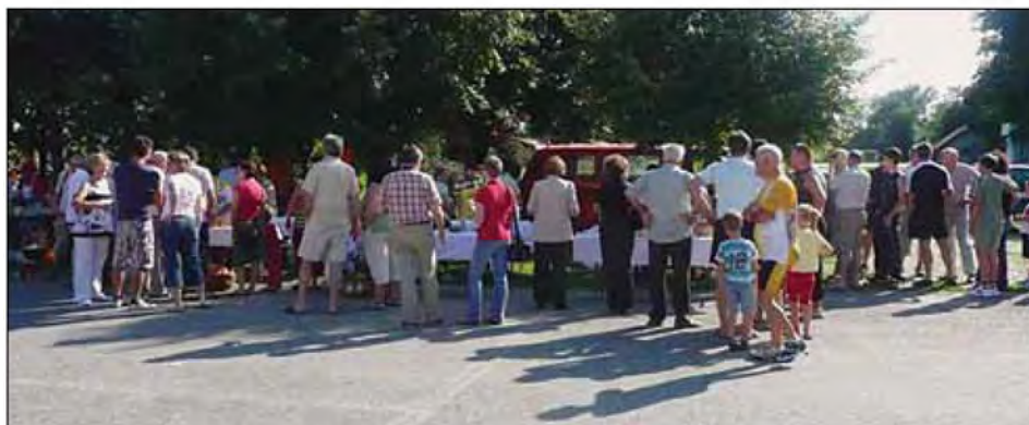
Na langaš je treba počakati tudi na langašijadi.