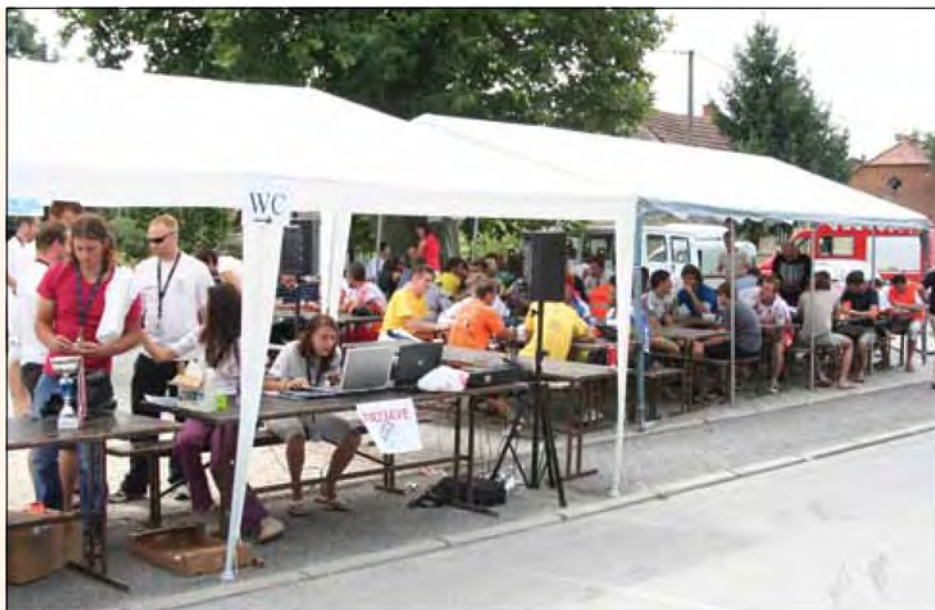
Štartno ciljni prostor

Rezultati Beltinskega kronometra 2008 so bili naslednji: