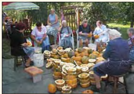
Članice pri jesenskem opraviilu