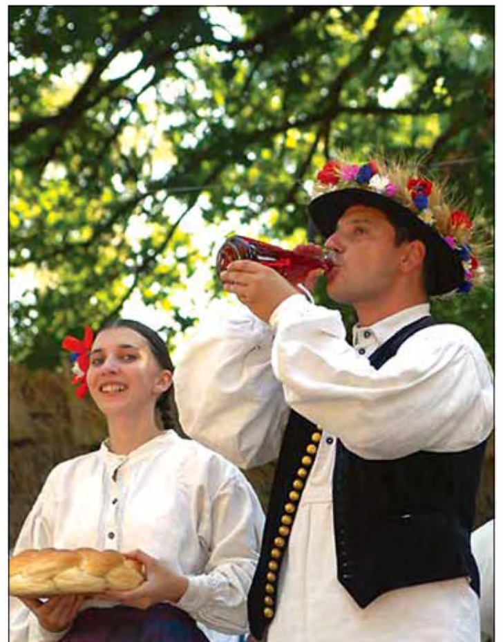
Folkloristi KUD Beltinci so praznovali 70-letnico.