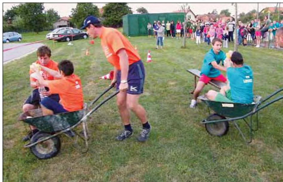
Tekmovalci v akciji pri eni izmed zanimivih iger.

Tretja igra je bila metanje vodnih balonov. Dva tekmovalca sta polnila plastične vrečke z vodo in jih metala čez pregrado, na drugi strani pa jih je z vedrom lovil njun sotekmovalec. V že pre-