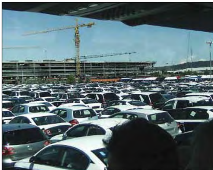
Terminal v Luki Koper - Ali bo tudi v naši bližini kmalu tako?