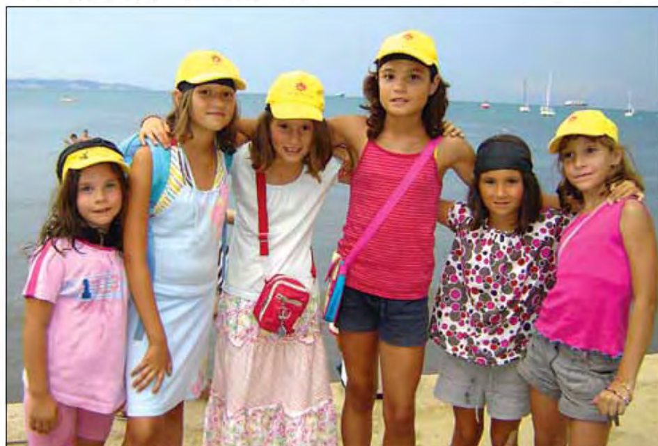
Zadovoljne morske deklice.