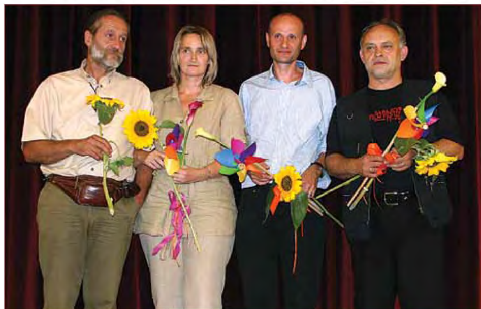
Avtorji filma Občutek za veter na predpremiéri.