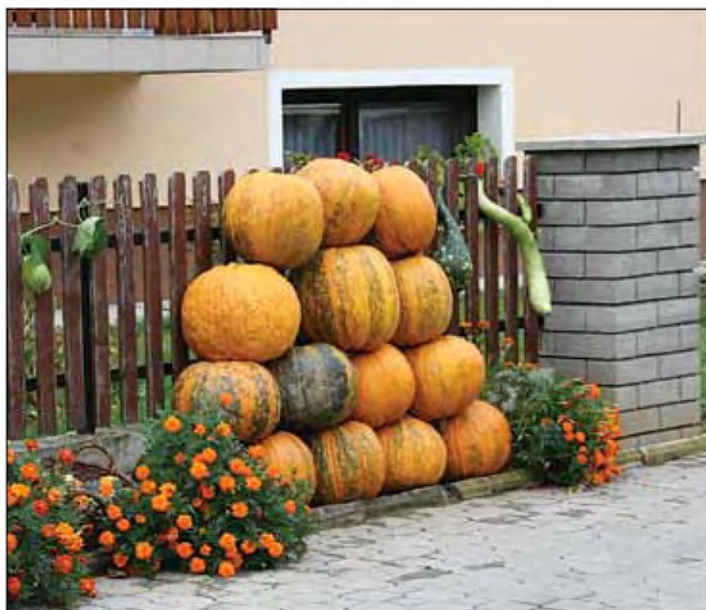
Lipovska domačija je obeležila 6. praznik buč - pozdrav jeseni pred hišo