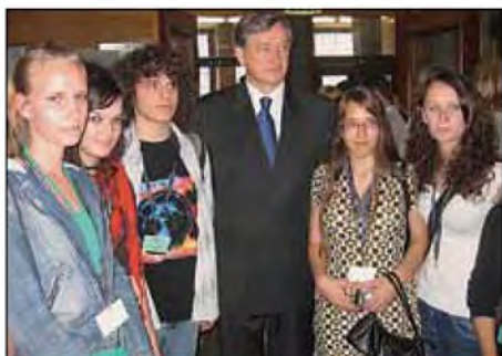
Mladi s predsednikom države D. Türkom