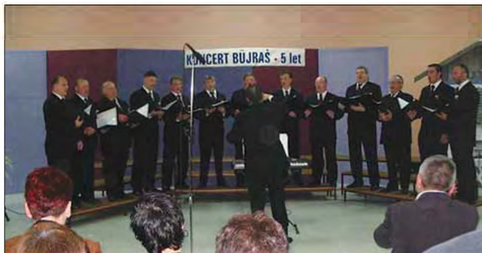
Člani zbor z zborovodjem