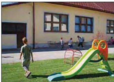
Nova okna so dala šoli drugačen izgled.

izpopolnjujemo svoje znanje na raznih seminarjih, posvetih, študijskih srečanjih. Dopolnjujemo didaktične pripomočke za pouk, skrbimo za urejeno, čisto in lepo učno okolje.