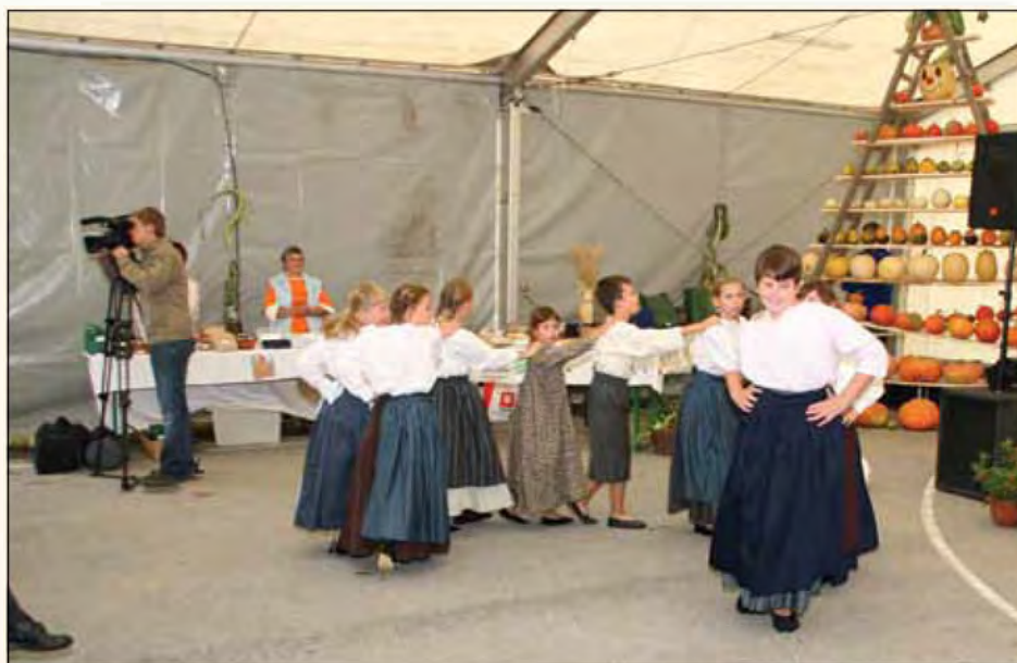
Mladi na prazniku buč.