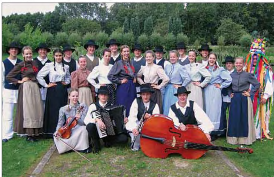
Marki - veseli po uspešno opravljenem nastopu.

hkrati pa se pogovarjali, kako malo je Slovenija prepoznavna med običajnimi ljudmi. Nekateri so sicer razmišljali v smeri, da recimo oni manj potujejo v primerjavi z Nizozemci, da če, potem bolj na Hrvaško, ker Slovenije ne poznajo. O tem sem se na lastne oči prepričala v turistični agenciji, kjer je na pol strani pisalo o Sloveniji (Ljubljani, Bledu, Piranu in Škofji Loki), o Hrvaški pa je bil na polici propagandni material na 8 barvnih listih. Pa ne zato, ker smo to bili mi, ampak kdorkoli bi bil na našem mestu, na takšen način bi se morala Slovenija predstavljati Evropi. To smo posebej spoznali, ko smo se v Bruslju sprehajali z majicami z napisom I FEEL SLOVENIA, ko se je za nami obrnil marsikateri pogled (ter spoznali mlade iz okolice Ljubljane – seveda s pomočjo enakih majic) in je bilo slišati »O Slovenija!« Tudi z izobešeno zastavo na avtobusu, ki nas je spremljala od Beltincev in nazaj do Beltincev smo pomagali k prepoznavnosti naše domovine.