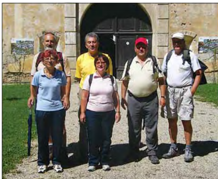
Pohodniki po 28 km končno na cilju