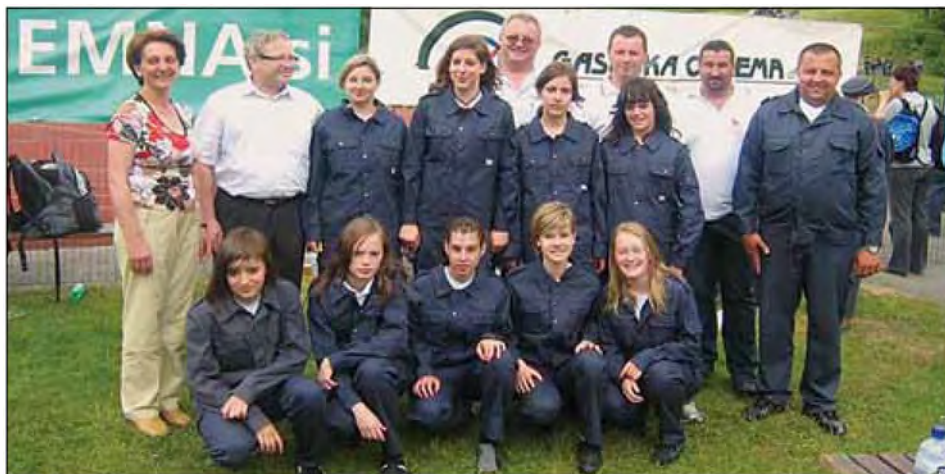
Ob podpori starejših mlada dekleta prevzemajo odgovornost. →