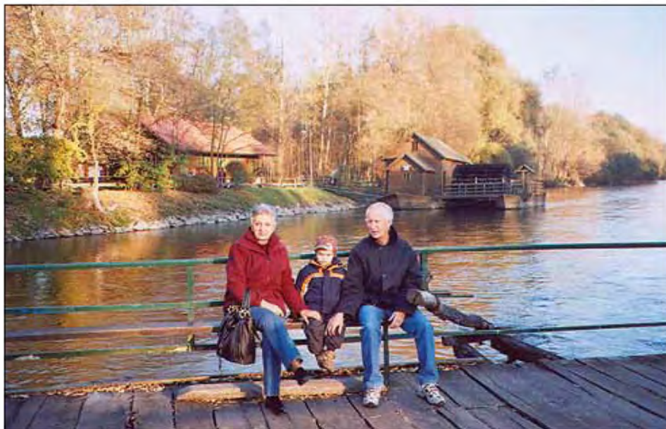
Lan v družbi babice in dedka.

Tako bo vzljubil in začel spoštovati vsako bitje in se ga ne bo bal. Seveda pa mu moramo biti ob tem za vzor, da mu sami ne vcepimo strahu pred živalmi, ki se jih »bojimo« in mislimo, da so v naravi nepotrebne. V vsakdanjem življenju se srečujemo tudi z živalmi, ki nekaterim vzbujaajo strah. Če bomo ravnali »modro«, bomo otroka poučili, da je tudi kača zelo koristna in nam noče nič hudega. Strah