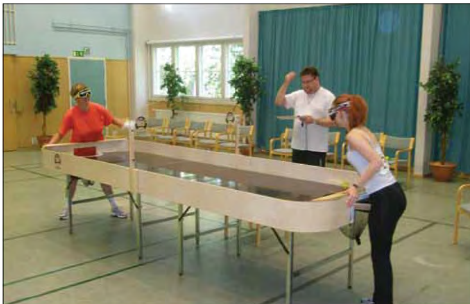
Moja mama med tekmovanjem

marsikaj spremenilo. Začela se je ukvarjati z različnimi dejavnostmi, ki jih večinoma prireja soboško društvo. Povezala se je tudi z ostalimi društvi, šla je na Okroglo pri Naklem in v Izolo plest – zanimivo, prej ni znala plesti, sedaj plete zelo dosti, kolikor ji pač čas dopušča, ponavadi v zimskem času. Začela se je tudi temeljito ukvarjati s kegljanjem na ruskem kegljišču za slepe. Prej je igrala pod B2 in je osvojila kar nekajkrat prvo mesto. Zadnja leta igra pod B1 in tudi zdaj je osvojila že kar nekaj prvih mest... Zelo aktivna je v športu...hodi tudi na tek, hitro hojo, plavanje in v planine. Pred šestimi leti pa se je začela ukvarjati