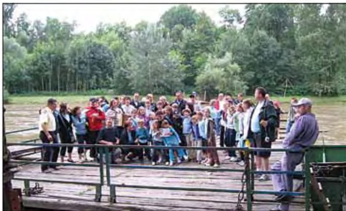
Skupaj smo se vozili z brodom, peli in igrali.