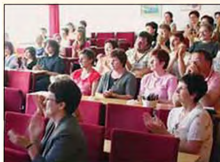
Navdušenje ob doseženih ciljih.