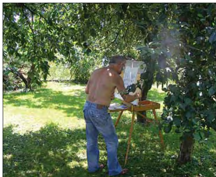
Utrinek z likovne kolonije Izak