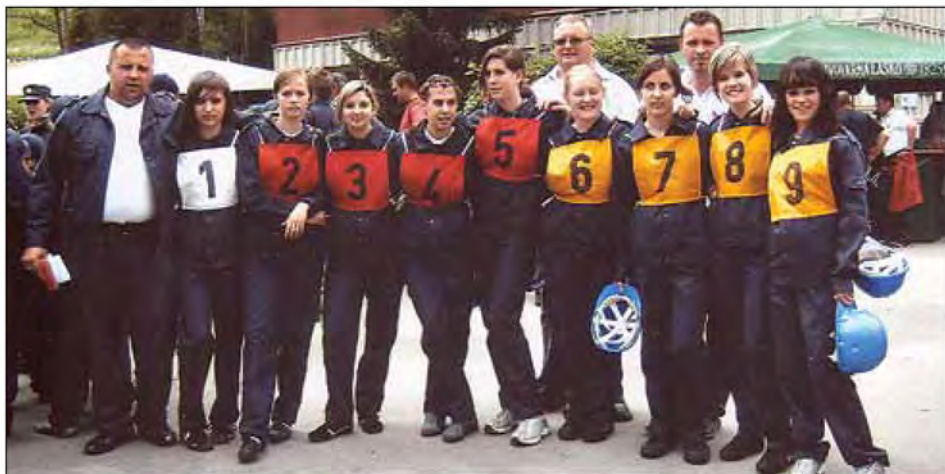
Mlade gasilke z vodstvom