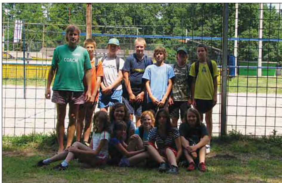
Udeleženci športnih delavnic z izvajalcev