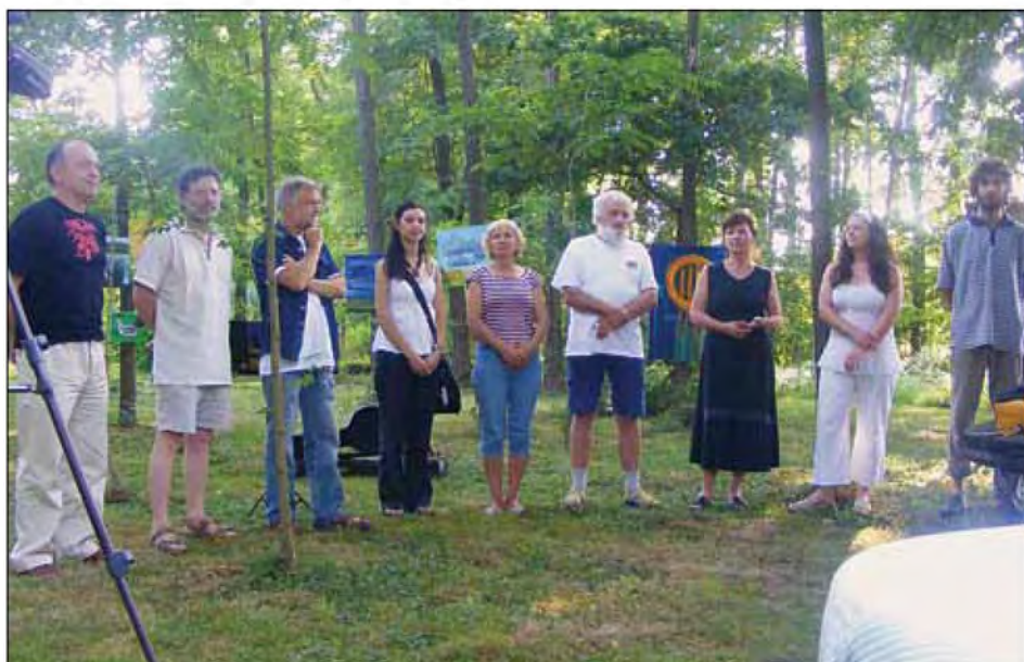
Udeleženci kolonije na priložnostni razstavi nastalih del v gozdiču v »Galeriji pri Lujzi«