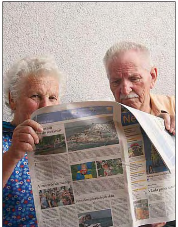
Le kaj je tako zanimivega?