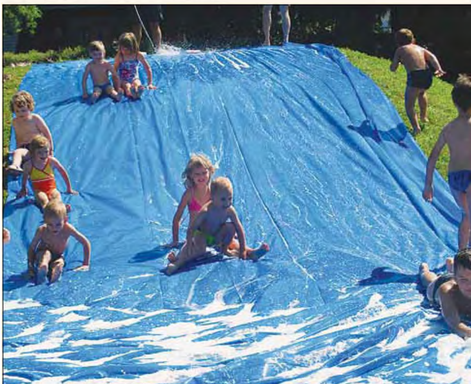
Uživamo, kot da bi bili na pravem morju.

„Srečni so ljudje, ki jim ustreza njihov poklic, Francis Bacon