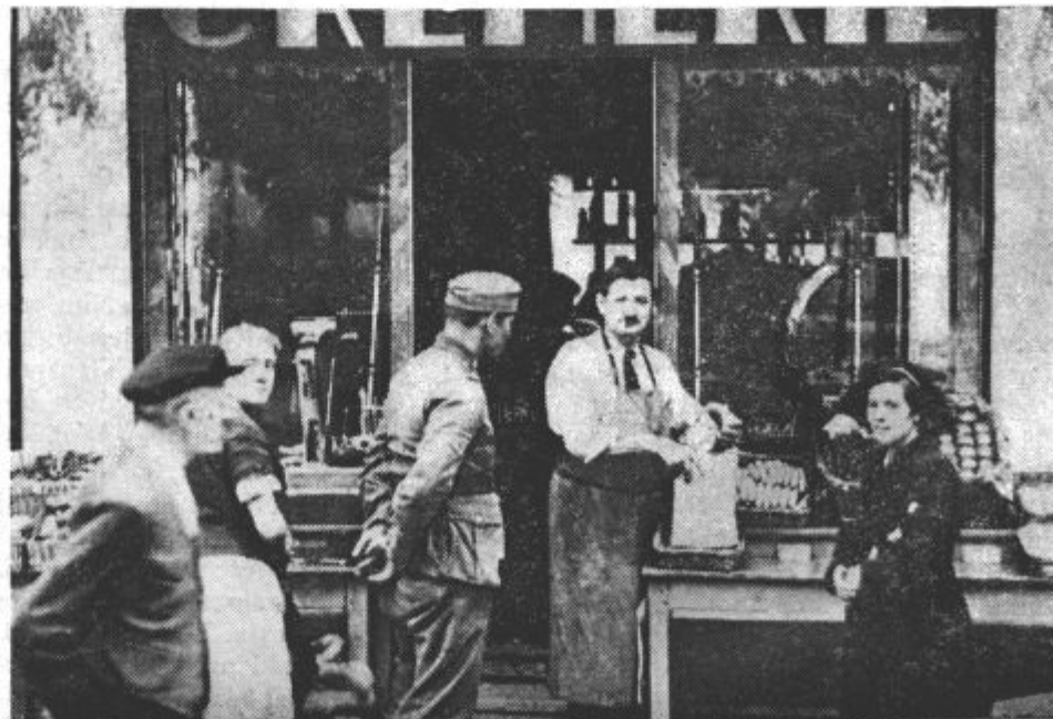
Nemški vojaki so pokupili v pariških trgovinah vse blago in ga pošiljali domov. — Na sliki vidimo nemškega vojaka v francoski trgovini

1. da se krijejo obveznosti nasproti zavarovancem na podlagi premij, vplačanih do 28. aprila 1936 s 70 odstotki (po uredbi iz 1. 1936 je bilo začasno priznano 45 odst.);