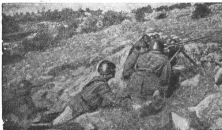
Grška pehota v strelskih jarkih albanskih gora, kjer se z neverjetnim junaštvom bore in napredujejo z grebena na greben kljub silnemu odporu sovražnika

× Maršal Graziani , poveljnik italijanskih čet v Libiji se je odločil z vsemi sredstvi braniti Bengazi. Angleške čete so naletele kakih 60 km za Derno na zelo trdovraten odpor italijanskih čet. Zemljišče je tam zelo prikladno za obrambo in ga hočejo Italijani do skrajnosti izrabiti. Angleži domnevajo, da brani obrambno linijo pred Bengazijem kakih 60.000 mož. Angleško letalstvo je pričelo s silovitimi bombar-