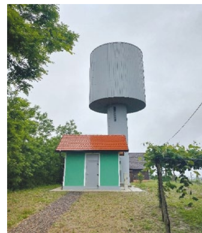
VH Vičanci s hidroforsko postajo Vičanci