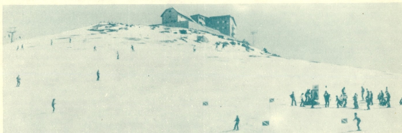
Panoramski posnetek s startne točke pod krvavškim Planinskim domom