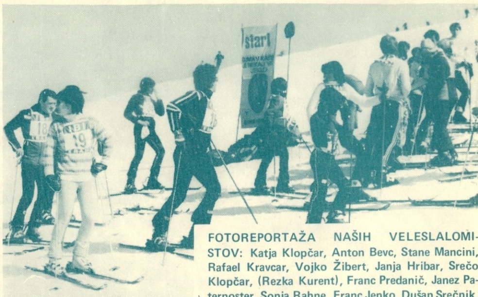
Prizor na startu

DO Dinos je prejela od UNZ zahvalo za materialno pomoč in obljubo, da bomo skupaj z njihovimi strokovnimi delavci obdelali strokovne teme na področju družbene samozaščite.