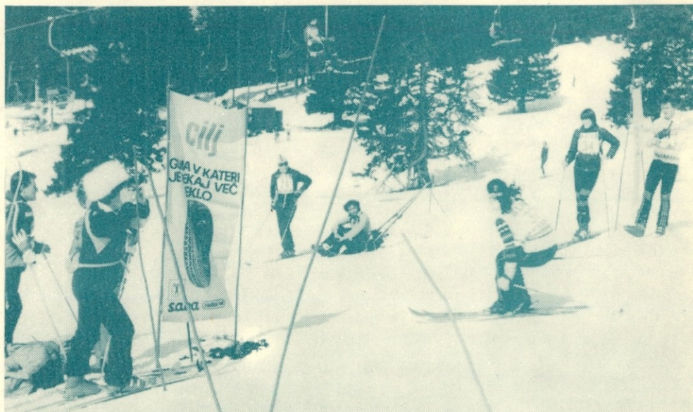
Smuk v cilj je bil deležen velike pozornosti