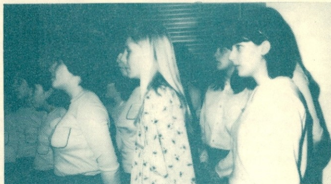
Članice mladinskega šolskega pevškega zbora osnovne šole Danile Kumar