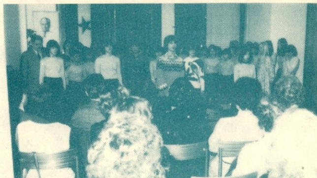
V kulturnem programu na naši proslavi Dneva žena so nastopali recitatorji (spredaj) in mladinski šolski pevski zbor (zadaj), ŠKD osnovne šole Danile Kumar

Različni odgovori s skupnimi šopki rož. Te niso od-