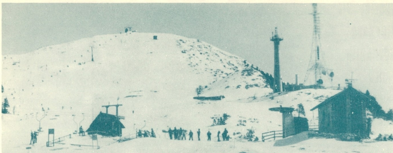
Panoramski posnetek na vrhu Krvavca

bi se z vso brzino spustili proti cilju.