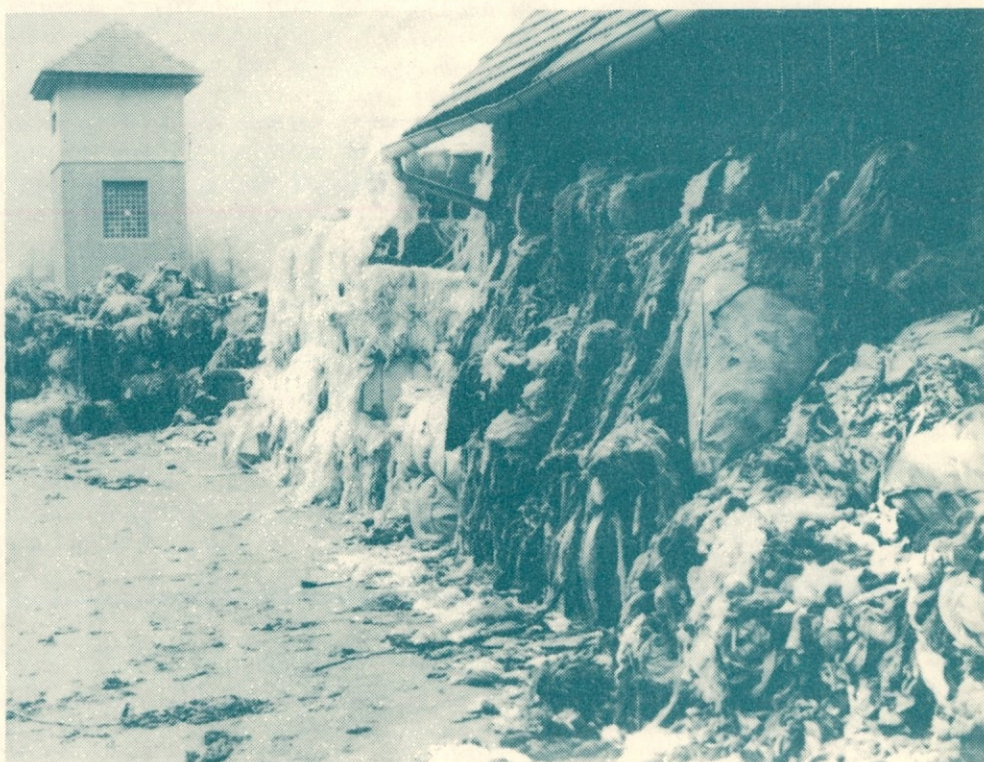
Tekstilni odpadki v srednjem skladišču TO Bohova

V TO Bohova se je vrnila leta 1973 in postala trgalka na trgalnem stroju tekstilnih regeneratov, kar je še danes.