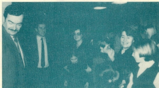
Vzdušje po končani proslavi Dneva žena na kateri sokulturni program v zadovoljstvo vseh navzočih izvajali člani šolskega kulturnega društva osnovne šole narodnega heroja Danile Kumar