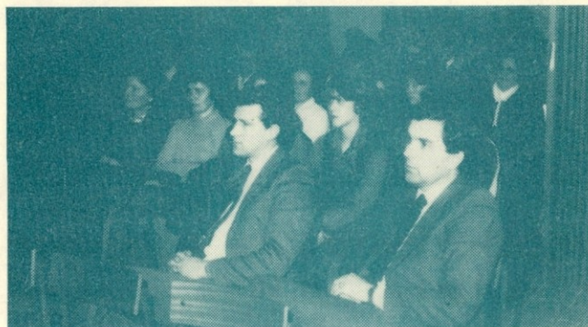
Udeležba na proslavi je bila izjemno dobra