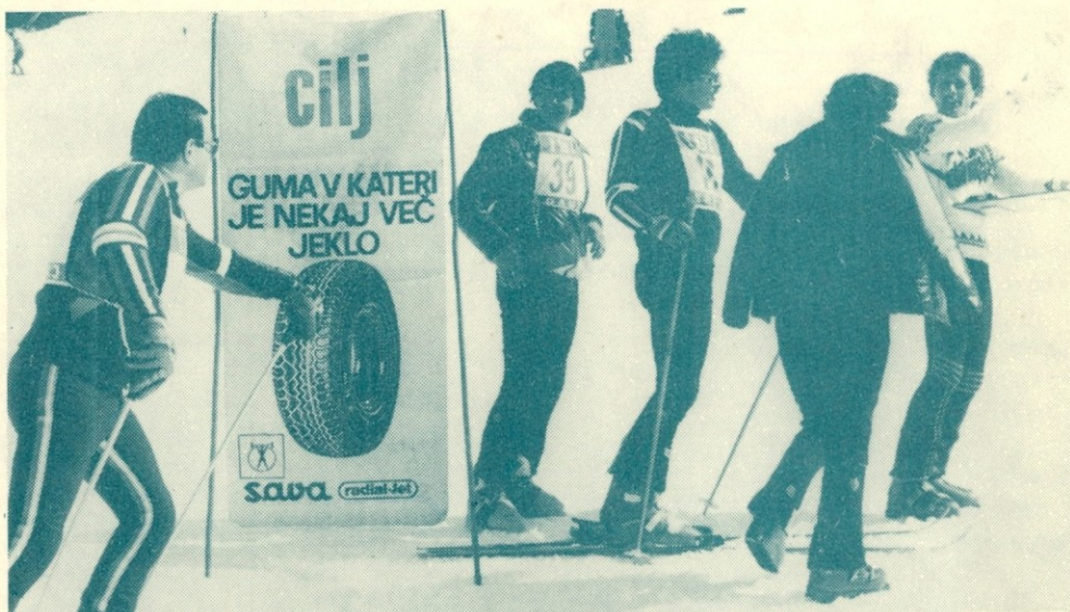
Prizor na cilju