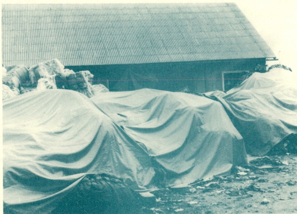
Zaradi pomanjkanja pokritega skladiščnega prostora so vrednejši tekstilni odpadki vskladiščeni tudi tako