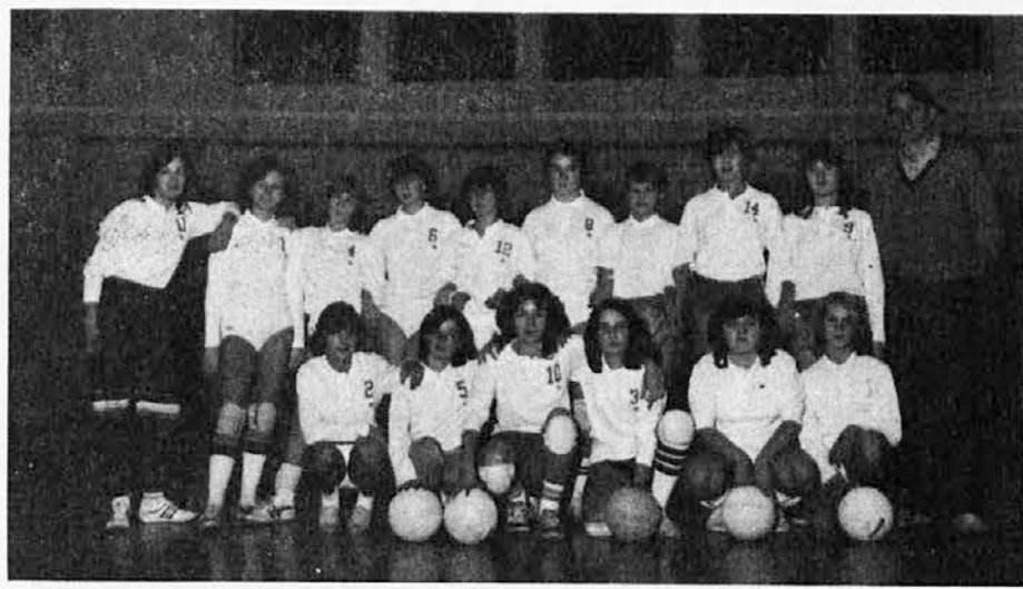
Olympia - Najmlajša ženska ekipa

Vsekakor je bilo izrečnih veliko koristnih idej in pobud, za katere je zadolžen na novo izvoljeni odbor, v katerem so v glavnem vsi prejšnji odborniki z manjšimi premiki in s člansko razširitvijo. Na občnem zboru je bilo med drugim tudi potrjeno, da bo jeseni na Tržaškem in Goriškem koroški kulturni teden.