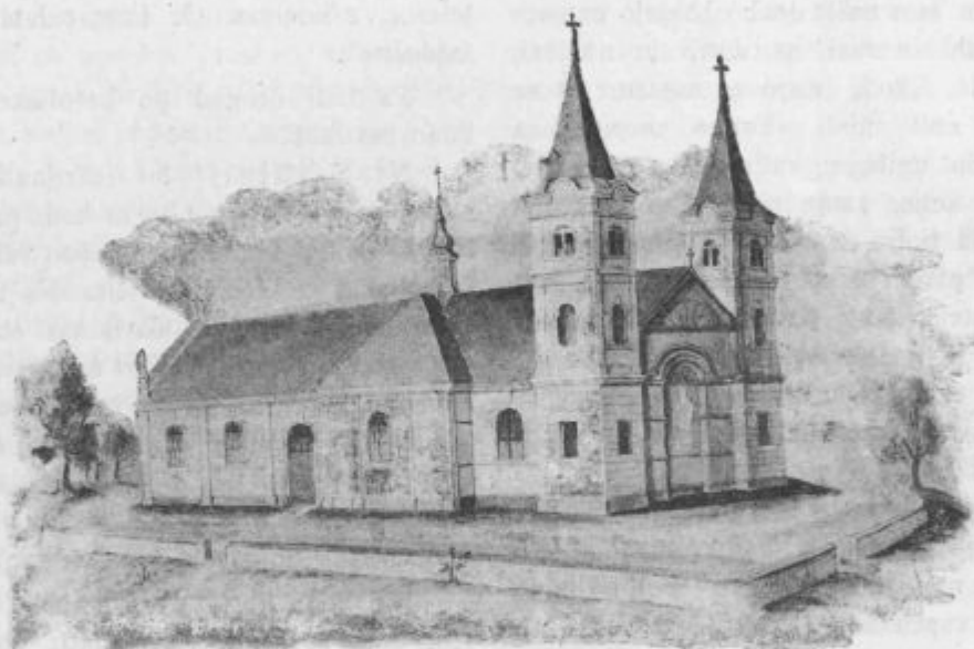
Načrt za popravo božjepotne cerkve Matere božje na Zaplazu.

Ako bi se pa to pretežavno zdelo, potem pač imejmo shode vsak na svojih središčih vsak na svojih božjih potih.