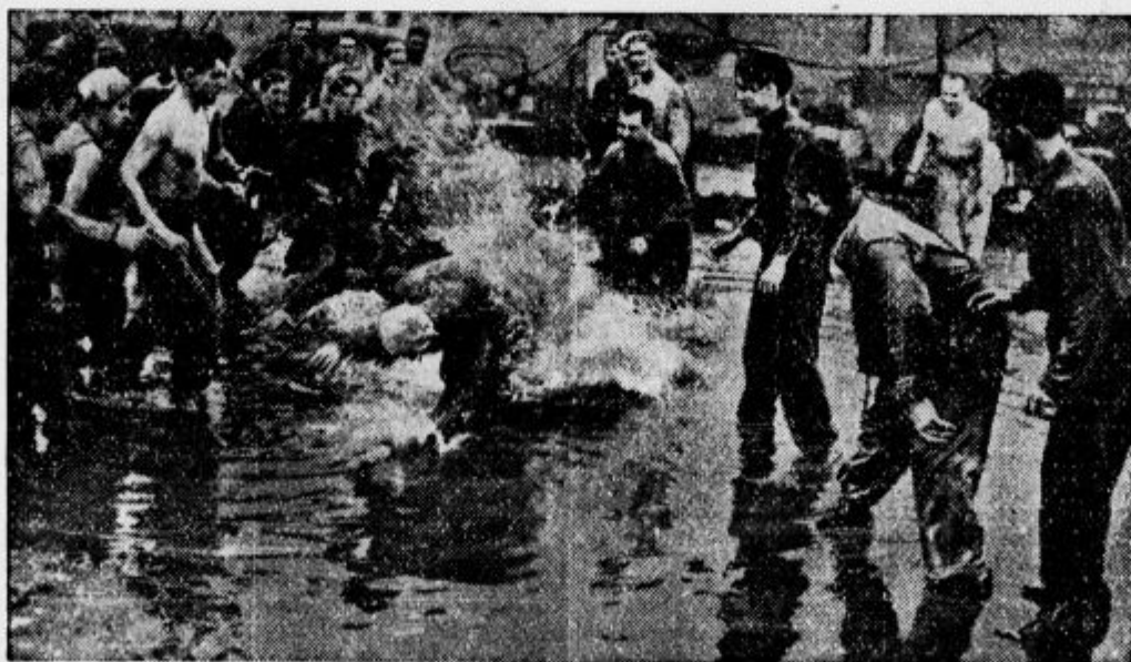
Pri nas pritiska mraz, v Los Angelesu v Kaliforniji pa je vroče in so sedaj sila veseli, ker je po dolgem času padlo nekaj več dežja. Ko so na cestah nastale luže, so se tamkajšnji študentje tako razveselili te hladnejše spremembe, da so se stari in mladi vrgli v lužo in se začeli po njej premetavati

Kako se nam godi, odkar so prišli Japonci k nam, bom moral vam in vsem misijonskim prijateljem ob priliki posebej poročati. Dogodkov je preveč in preveč so razburljivi, da bi vam že danes mogel mirno opisati naš položaj. Mimogrede vam zaupam, da sem danes dopoldne, 26. nov., stal pred japonskim vojnim sodiščem. Obdolžen sem bil, da sem pod pretvezo misijonskih opravil šel izdajati kitajskim četam neki pohod tukajšnjih vojakov in se je manever zato ponesrečil. Zaslisevanje je bilo v resnici le naznanilo smrti. — Mirno sem jih v odgovor razložil, da sem se podal v dotično okolico s posebnim pismenim dovoljenjem komandanta, ki me zaslišuje. Če bi kitajski vojski, ki sem jih res srečal, slutili, da prihajam iz Jenšana, bi me gotovo preiskali, našli vaše dokumente ter me brez odloga ustrelili kot izdajalec. Torej ni govora, da sem z njimi sploh govoril. Ta preprosti odgovor jih je vidno zmedel. Po