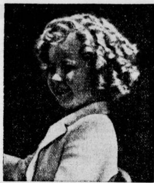
Mala filmska igralka Shirley Temple je menda najbolj priljubljena med vsemi. Deklica je še otrok, kakor je tudi otrok mali Clark Gable. Ameriški listi so privedli ljudsko glasovanje, kateri teh dveh malih igralcev je najbolj priljubljen. Pa se je izkazalo, da je ta deklica mnogo bolj priljubljena pri gledalcih kakor pa deček, dasi je tudi on dobil mnogo glasov. Kako pa bo takle otročaj vzgojen, kadar doraste, za to se nihče ne briga