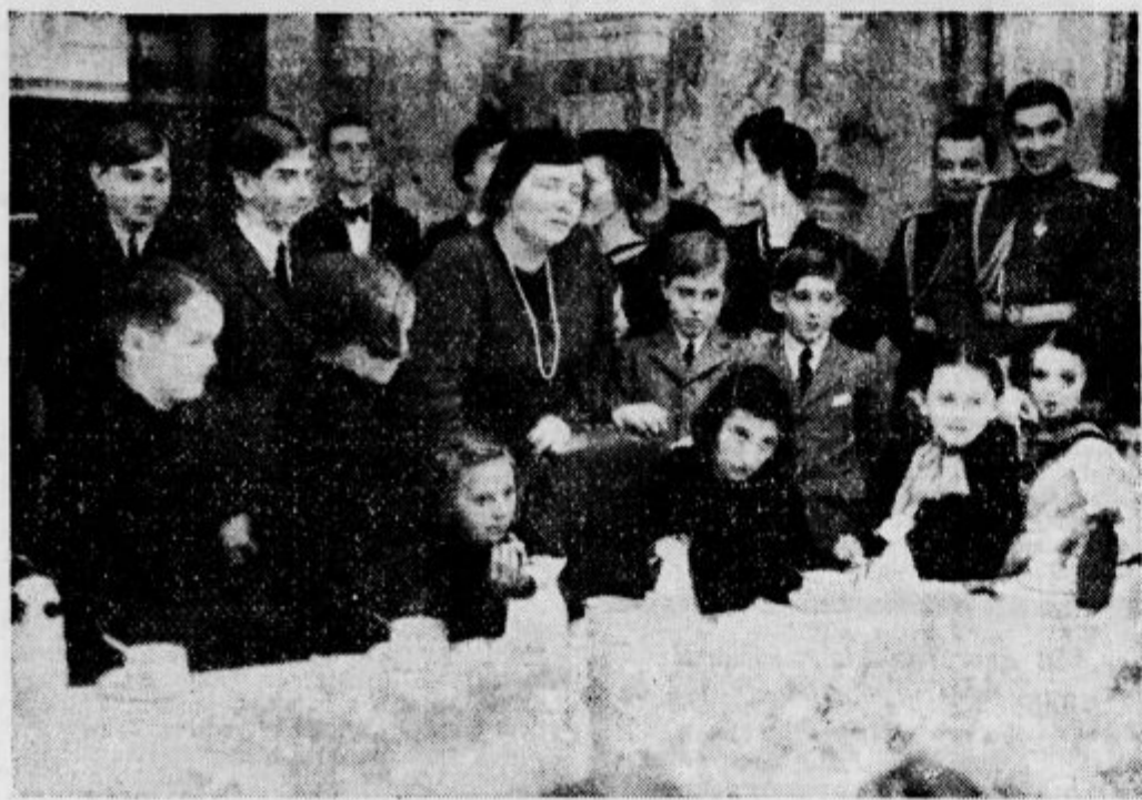
Člani kraljevskega doma v razgovoru s gosti.