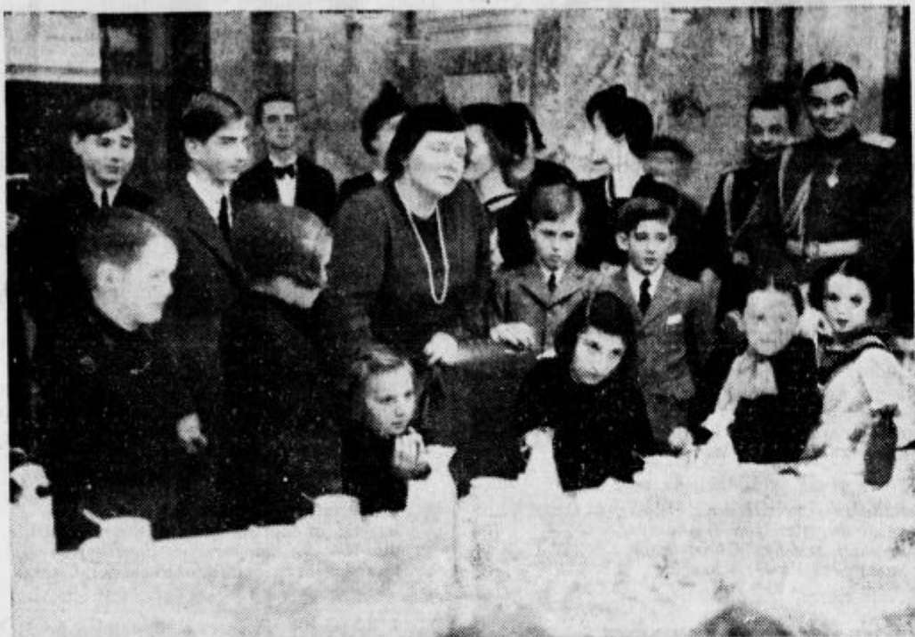
Člani kraljevskega doma v razgovoru z gosti.