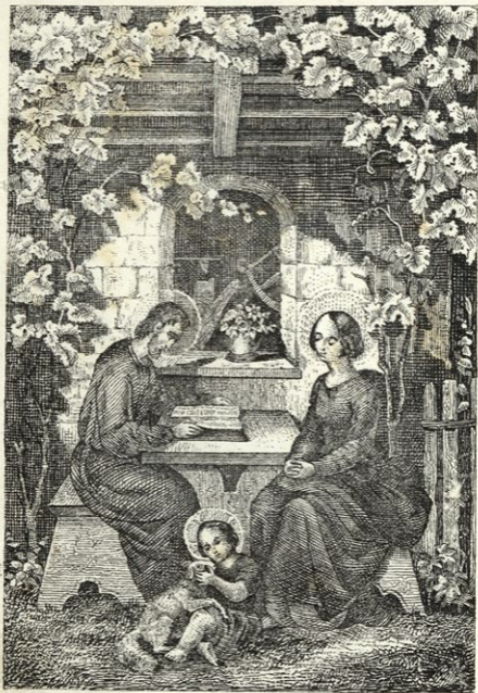
Ježus, Maria, sv. Jožef.