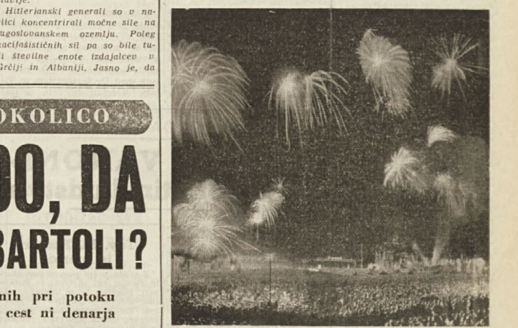
Zaključek mogočne manifestacije svetovne miroljubne mladine v Berlinu.

Leta 1944 so bile razmere v Jugoslaviji kaj težke. Z ene strani so se trudili hitlerjski okupatorji, da bi za vsako ceno držali v svoji pesti vso Jugoslavijo; z druge strani pa so se angloameriški zavezništva s pomočjo Tita, njihovega zakrinkanega agenta, pripravljali, da bi zasedli našo deželo in podzeli vse zdrave domoljubne in revolucionarne sile Jugoslavije.