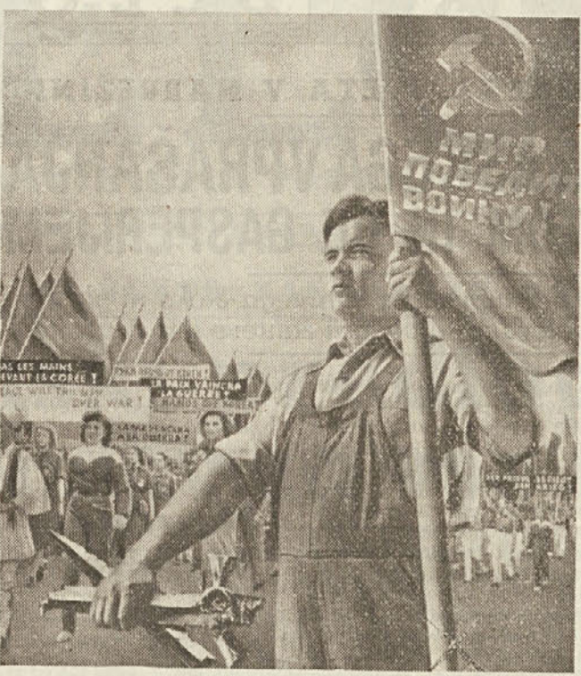
MIR BO PREMAGAL VOJNO

osnovna lastnost, ki razlikuje politiko Sovjetske zveze od politike kapitalističnih držav... Prvi akt vlade delavcev in kmetov po zmagi Oktobrske revolucije je bil proglas o miru - Ameriški imperialisti si žele vojne za povečanje svojih profitov - Sovjetski narodi potrebujejo mir za izgradnjo komunizma v deželi