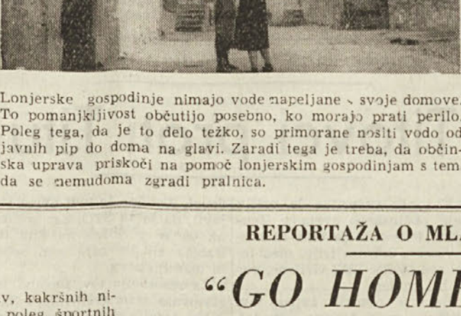
Lonjerske gospodinjice nimajo vede napeljene v svoje domove. To pomanjkljivost občutijo posebno, ko morajo prati perilo. Poleg tega, da je to delo težko, so primorane nositi vodo od javnih pip do doma na glavi. Zaradi tega je treba, da občinska uprava prisloži na pomoč lonjerskim gospodinjicam s tem, da se nemudoma zgradi plačnica.

umetnih in narodnih pesmi. Sprejeto je nato to. Gombac v imenu SHPZ ter med drugim omenil, da s to predstavo otvarjamo novo gledališko sezono, v kateri bomo skušali prikazati vse nečje zmogljivosti naših ljudskih odrov in pesko glasbenih skupin.