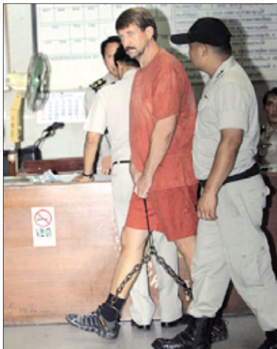
Viktorja Bouta so »v železku« privedli pred sodnike

Bouta, nekdanjega sovjetskega letalskega časnika, so prijeli marca 2008 na Tajskem, ko naj bi skušal prodati večjo količino orožja kolumbijskim gverilcem Farc, vendar je šlo v resnici za ameriške agente. V ZDA so ga iskali, ker naj bi s floto transportnih letal prodajal orožje številnim skupinam in tako pomagal pri podpihovanju številnih spopadov v Afriki, Južni Ameriki in na Bližnjem vzhodu. Sam trdi, da je vodil zgolj letalsko transportno podjetje. "Kariero" naj bi začel predvsem s preprodajanjem orožja, ki je po razpadu Sovjetske zveze preplavilo črni trg. Po njem pa naj bi posneli tudi film Gospodar vojne (2006), v katerem se soočita Nicholas Cage kot Jurij (Bout) in Ethan Hawke kot prizadeveni ameriški agent.