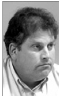
Vzhodni Kras, nova dvojezična institucija: Občina Trieste