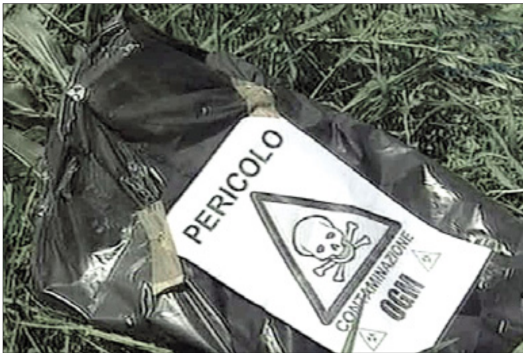
»Napada« furlanskih protiglobalistov na sporno polje koruze

Po Fidenatovih ocenah so mu protiglobalisti s svojim početjem prizadejali petsto evrov gmotne škode, morebitno popolno uničenje nasada pa bi ga stalo dodatnih šest tisoč evrov. Koruzo so analizirali v laboratoriju v Fermu, rezultati pa so potrdili, da je pridelek gensko spremenjen, sosednjih zemljišč pa tovrstna koruza ni prizadela.