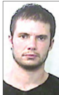
35-letni morilec prostitutk Ramon Berlosio umrl včeraj ponoči v videmski bolnišnici