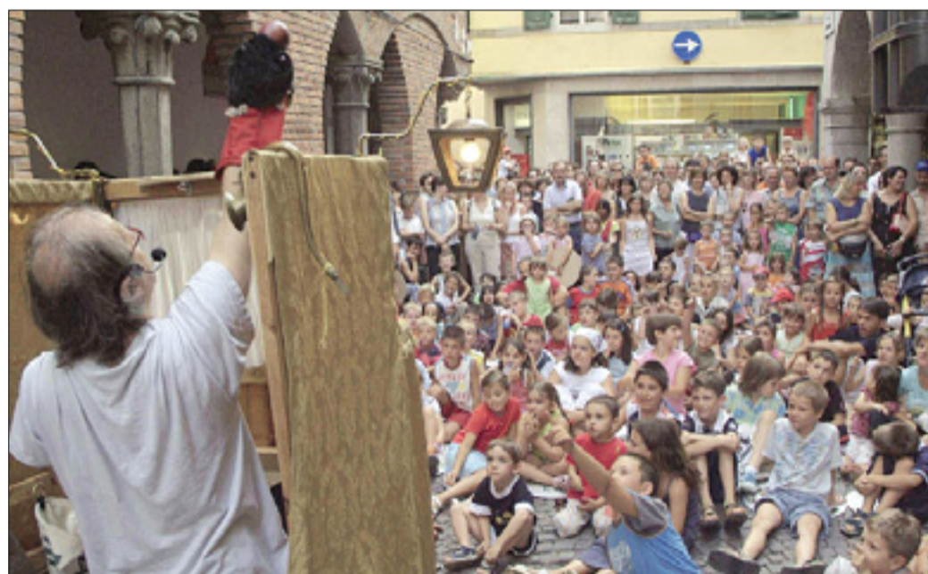
Lutke so lani poživile tudi Gradež

Prvič oglejska sekcija in srečanja z mojstri - Maja leta 2011 večji dogodek ob 20-letnici