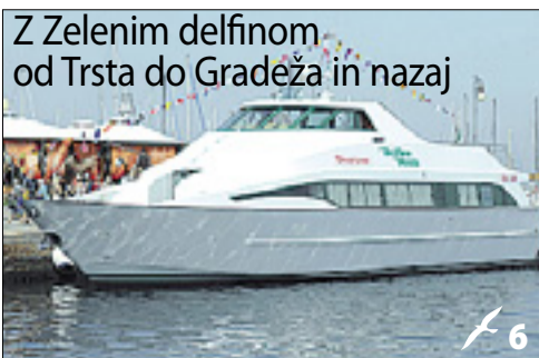
Z Zelenim delfinom od Trsta do Gradeža in nazaj