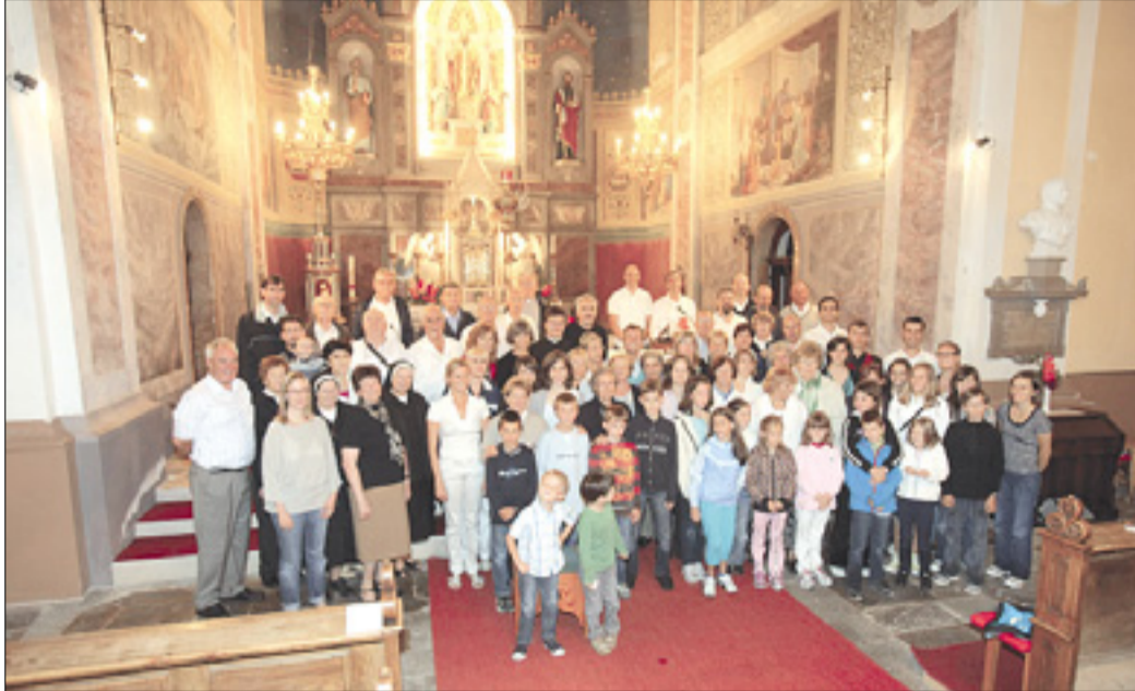
Letošnji udeleženci in udeleženke

Poletni seminar, namenjen cerkvenim pevcem s Tržaškega, ki je letos potekal v drugem avgustovskem tednu, je tudi tokrat uspel. Za to pa imajo zaslugе prizadevni organizatorji Zveze cerkvenih pevskih zborov, ki so se ponovno potrudili in organizirali nad vse uspešen šestdnevni pevski seminar v priznanem letoviščarskem središču na Gorenjskem. Tokratna izbira kraja je bila Bohinjska Bistrica, prijazno gorsko središče obdano z naravnimi lepotami, predvsem gorami, kot so Črna prst, Rodica in Vogel, pa slapom Savice in prekrasnim Bohinjskim jezerom ob bližnjem Ribčevem lazu.